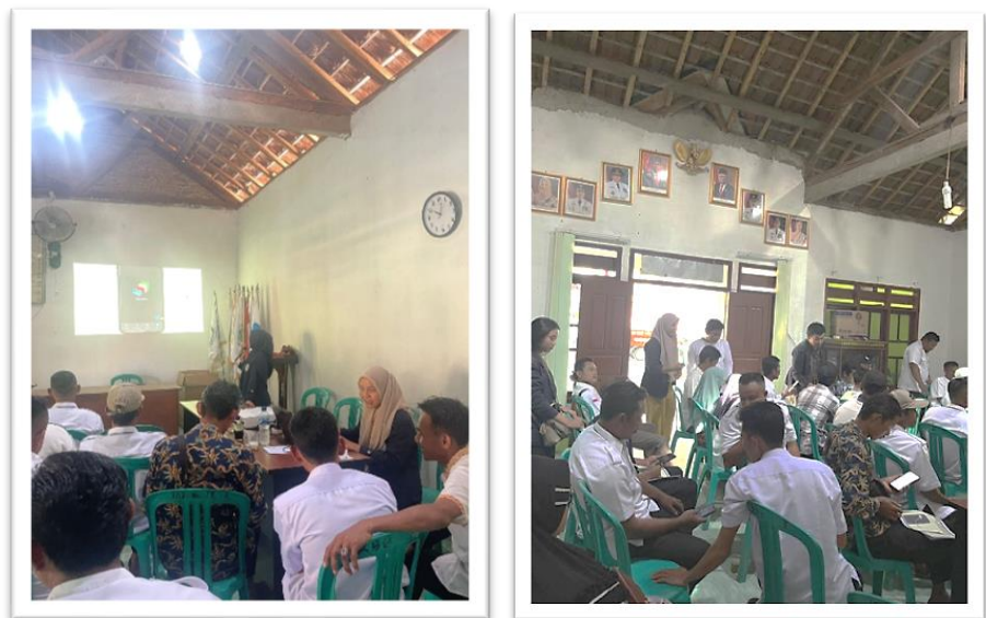
Gambar 2. 4 Pelaksanaan Sosialisasi Paperless

Tujuan dari sosialisasi penggunaan Google Drive ini yaitu mendorong terhadap media penyimpanan, pencarian dokumen atau file, kolaborasi berbagai dokumen kerja yang terintegrasi secara langsung secara digital untuk dapat digunakan kapan saja menggunakan perangkat elektronik PC, Laptop, ataupun HP. Berikut kondisi pada saat Sosialisasi Paperless dapat dilihat pada Gambar 2.4