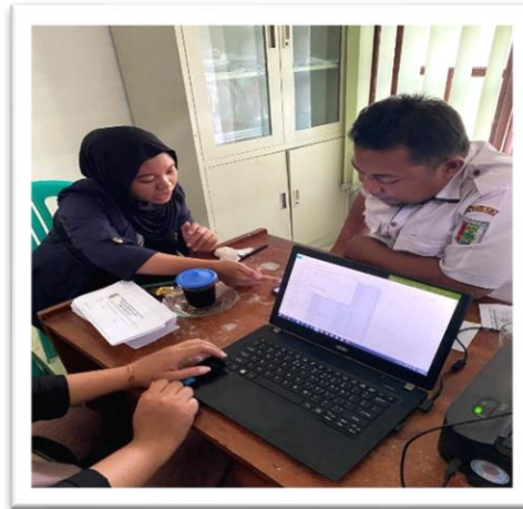
Gambar 2. 1 Izin Pelaksanaan Paperless