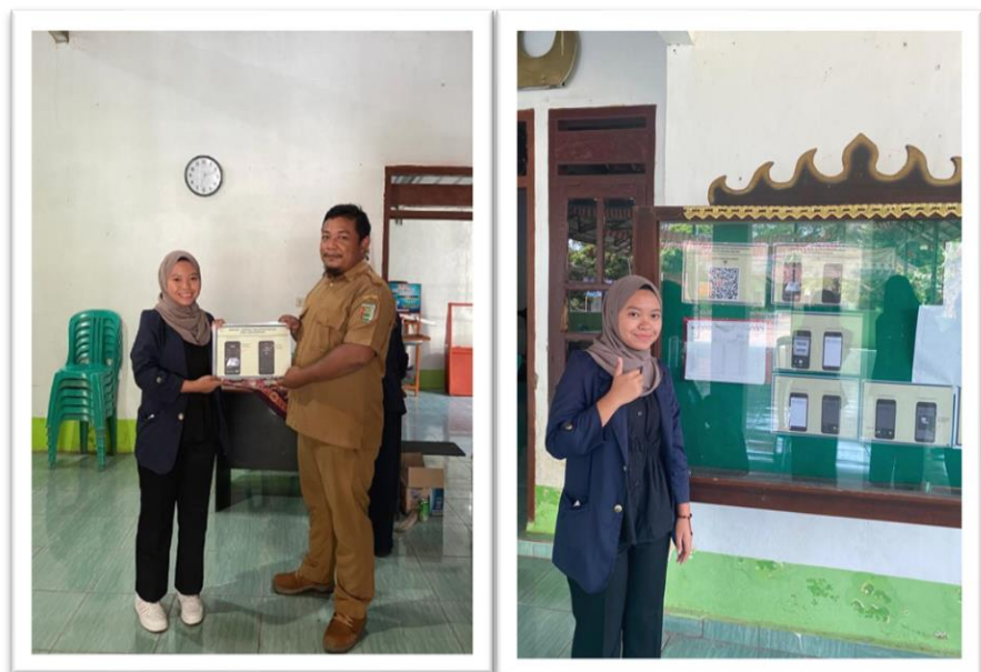
Gambar 2. 5 Penerapan Paperless

Program kerja Paperless ini berfungsi untuk memberikan kemudahan bagi masyarakat setempat dalam mendownload surat-surat yang dibutuhkan serta dengan format yang sesuai dengan aturan Balai Desa Kubu Batu. Melihat dari permasalahan yang ada yaitu masyarakat kerap membuat surat yang di butuhkan tidak sesuai format maka dari itu Bapak Agung selaku Sekertaris Desa meminta solusi terkait permasalahan tersebut oleh karena itu penulis membuat mading tutorial mengenai tutorial cara mendownload surat secara Online di Balai Desa Kubu Batu. Berikut penerapan Paperless dapat dilihat pada Gambar 2.5