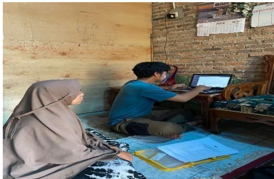
Gambar 2. 3 Sosialisasi SIMONIK