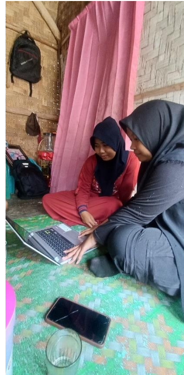
Gambar 2.1 Aplikasi Buku Warung Gambar 2.2 Foto saat pelatihan