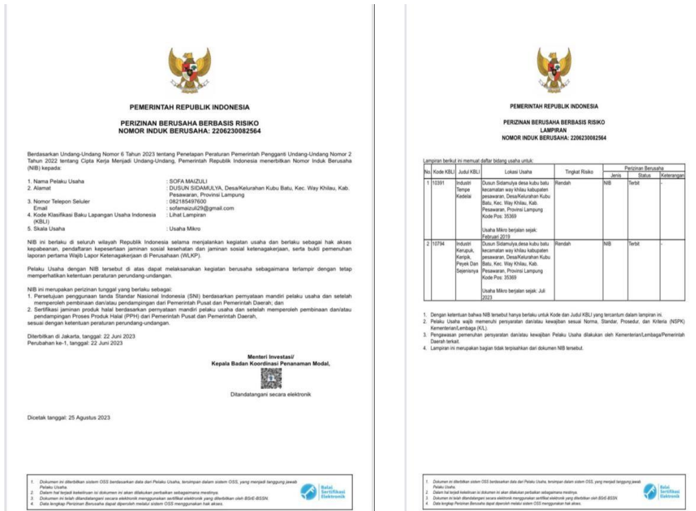
Gambar 2.2 File Dokumen NIB

Setelah melakukan pendampingan pembuatan NIB, maka proses selanjutnya hasil dari pembuatan dokumen terbit. Dapat dilihat pada gambar 2.2 dibawah ini