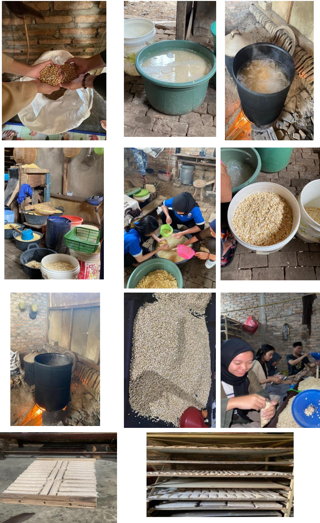
Gambar 2.6 Proses pembuatan tempe