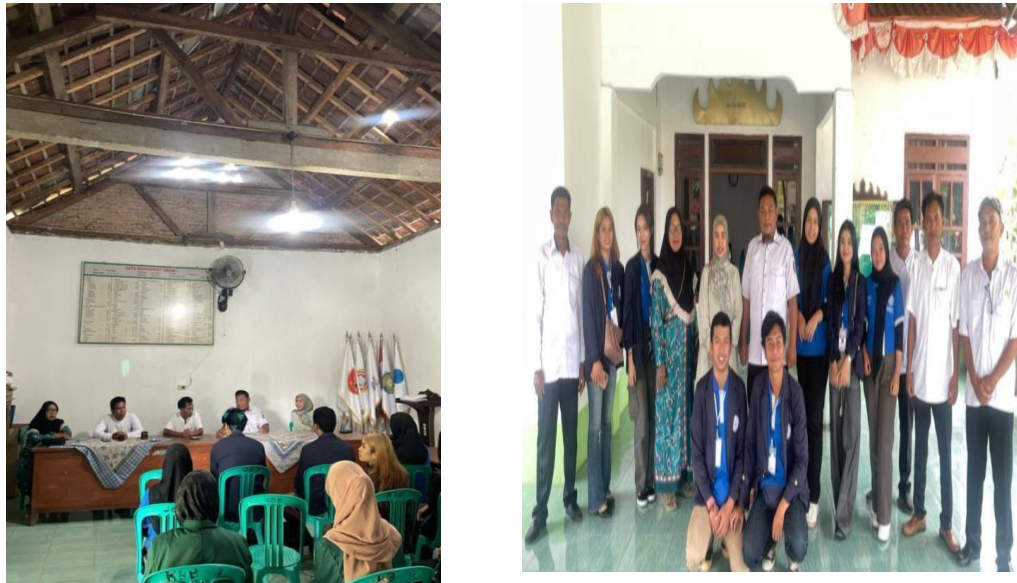
Gambar 2.5 Penerimaan mahasiswa PKPM IIB