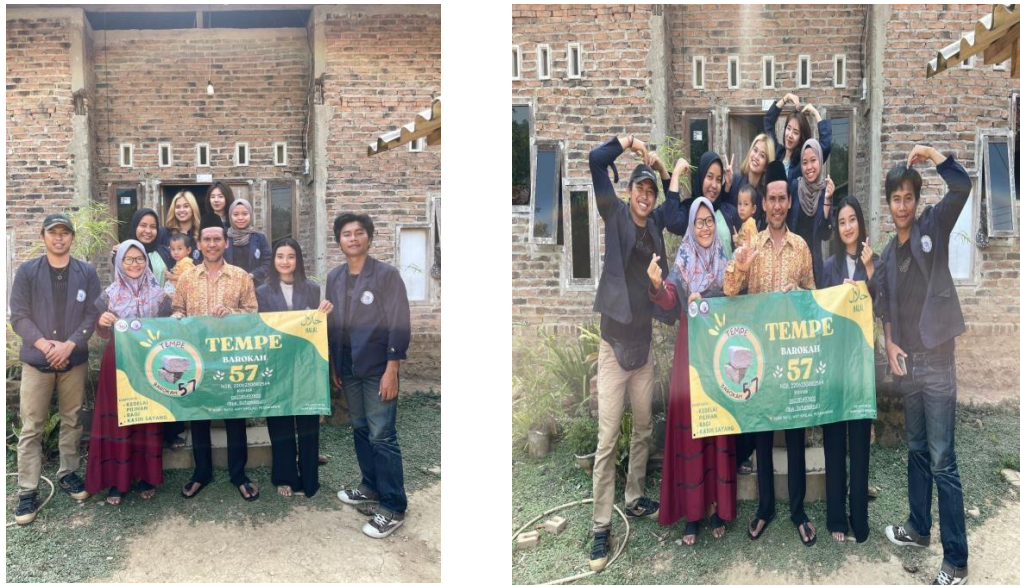
Gambar 2.7 Penyerahan Benner

Berikut gambar penyerahan benner dapat dilihat pada gambar 2.7