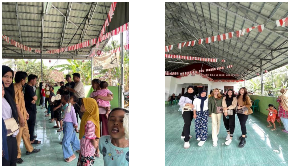
Gambar 2.9 Lomba 17 Agustus

Pelaksanaan lomba untuk memeriahkan Hari Kemerdekaan Indonesia masyarakat Desa Kubu Batu mengadakan berbagai macam lomba mulai dari lomba anak anak sampai dengan dewasa. Lomba tersebut diikuti warga desa dengan antusias, selain itu ada KKN dari UIN RIIL yang ikut serta dalam kepanitian lomba tersebut. Bagi yang memenangkan lomba akan mendapatkan doorprize yang menarik. Dapat dilihat pada gambar 2.9