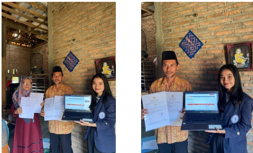
Gambar 2.3 Penyerahan NIB Ke UMKM 1

Kegiatan terakhir yaitu memberikan pemahaman kembali kepada pelaku UMKM mengenai manfaat dari pembuatan NIB. Nomor Induk Berusaha (NIB) mempunyai peranan penting bagi pelaku UMKM. Adanya NIB guna menciptakan suasana yang aman dan kondusif bagi UMKM, dimana pemerintah mengeluarkan kebijakan baru yaitu bagi pelaku UMKM diharapkan untuk memiliki perizinan yang lengkap dan legal dimata hokum yang berlaku. Hal tersebut didasarkan pada manfaat yang diperoleh dari adanya legalitas usaha, yakni mendapatkan jaminan perlindungan hukum, memudahkan dalam mengembangkan usaha, membantu memudahkan pemasaran usaha, akses pembiayaan yang lebih mudah, dan memudahkan memperoleh pendampingan dan pelatihan usaha dari pemerintah (Kusmanto et al, 2019). Dapat dilihat pada gambar 2.3