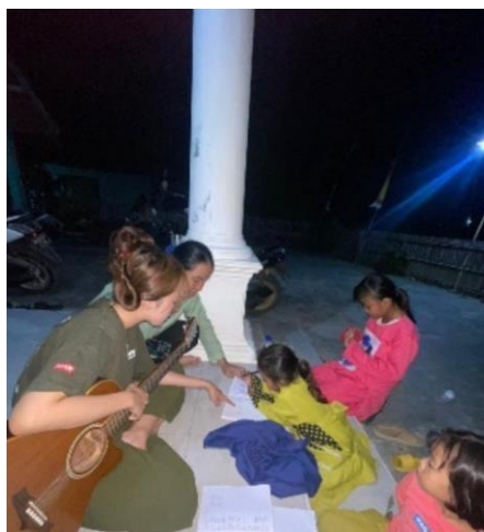
Gambar 2.8 Belajar Bersama di Posko

Pelaksanaan Belajar bersama anak- anak diadakan tanggal 11 Agustus 2023 ini disambut dan diikuti dengan sangat antusias oleh anak-anak, Belajar bersama ini dilakukan di posko kami guna mengisi kekosongan waktu kami dan diisi dengan pengalaman baru mengajar dan membantu anak –anak menjawab yang belum paham dalam sekolah dan membantu mereka mengerjakan PR.