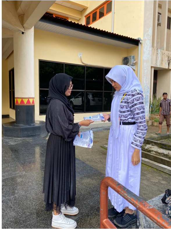
Gambar 4.4 Membagikan Brosur Kepada Calon Mahasiswa