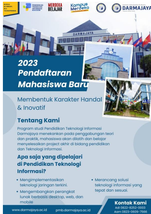
Gambar 4.2 Poster Promosi