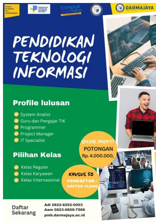
Gambar 4.3 Poster Promosi