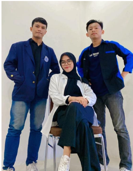
Gambar 4.1 Foto Dalam Pembuatan Video Marketing