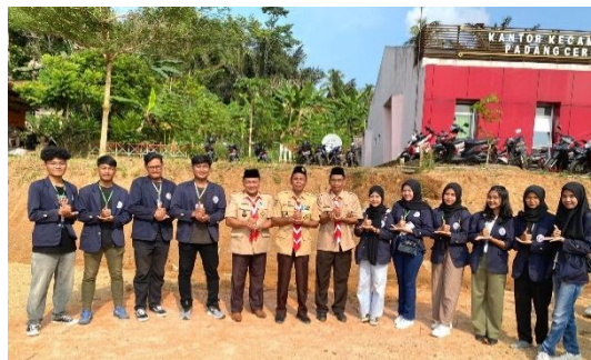
Gambar 2.3.10 Mengikuti Upacara Hari Pramuka

Keikutsertaan Mengikuti Upacara Hari Pramuka di Kantor Kecamatan Padang Cermin