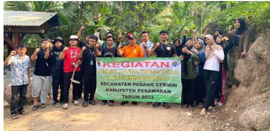
Gambar 2.3.9 Mengikuti Kegiatan Padat Karya Tunai Desa, Desa Sanggi

Melakukan kegiatan bersih bersih di sekitar lokasi Padat Karya Tunai Desa (PKTD) Desa Sanggi.