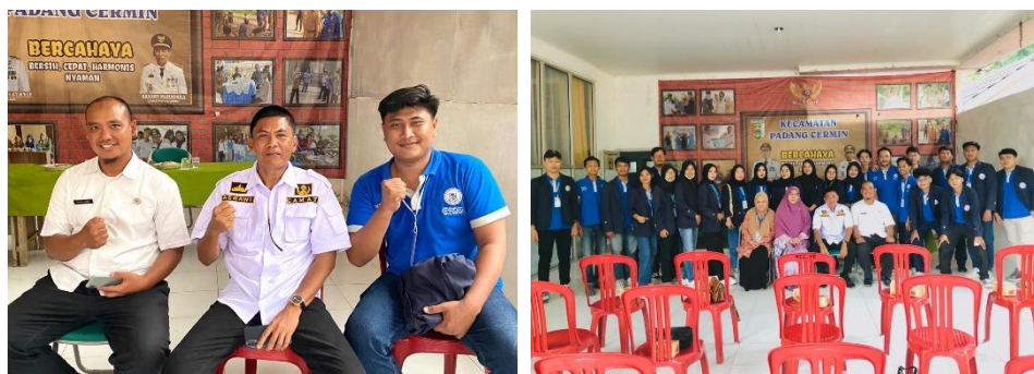
Gambar 2.3.2 Berkumpul di Kantor Kecamatan

Sebelum menuju ke desa Sanggi , masing masing kelompok menuju ke Kantor Kecamatan untuk melakukan konfirmasi kedatangan mahasiswa PKPM kepada Bapak Camat dan juga Perangkatnya