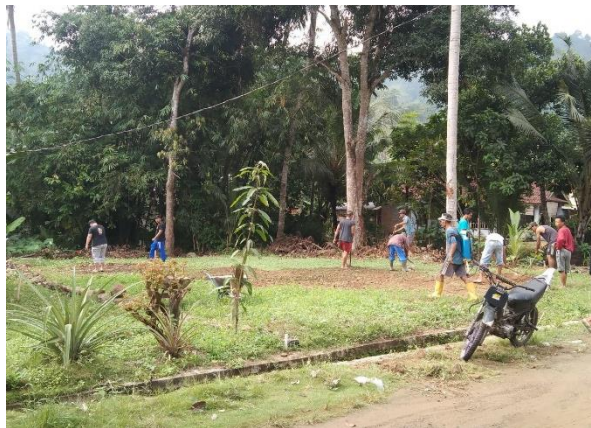
Gambar 2.3.4 Gotong Royong Di Lapangan Voli

Keikutsertaan Mahasiswa PKPM pada kegiatan gotong royong lapangan voli yang akan digunakan sebagai lokasi lomba kemerdekaan HUT RI.