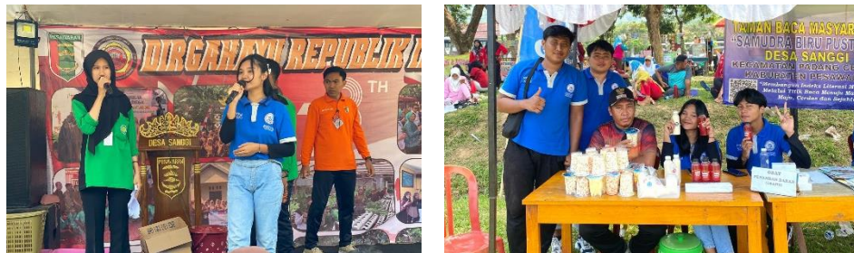
Gambar 2.3.18 Panitia Jalan Sehat, Dan Memperkenalkan Produk UMKM

Pada kegiatan ini sebagian mahasiswa PKPM menjadi panitia dan ada juga yang melakukan pemasaran Produk UMKM yang ada di Desa Sanggi, Khususnya Sirup Mangrove.