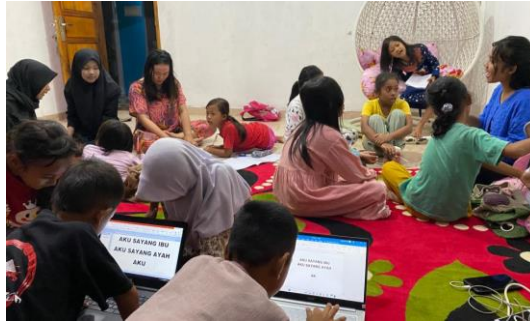
Gambar 2.3.15 Mengundang Anak-Anak Kecil Untuk Diberikan Ilmu Pengetahuan Tambahan

Memberikan Ilmu Pengetahuan Tambahan kepada anak-anak Desa Sanggi agar memahami Pengembangan Teknologi di Era Globalisasi.