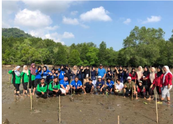
Gambar 2.3.7 Melakukan Penanaman Mangrove