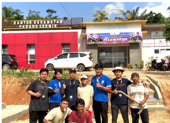
Gambar 2.3.6 Gotong Royong di Kantor Kecamatan

Mahasiswa IIB Darmajaya diminta kerjasamanya untuk melakukan gotong royong di halaman kecamatan Padang Cermin, karena akan digunakan untuk Upacara Memperingati Hari Pramuka dan Upacara HUT RI -78