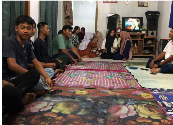
Gambar 2.3.5 Musyawarah Kegiatan 17 Agustus

Keikutsertaan Mahasiswa PKPM pada kegiatan musyawarah kegiatan memeriahkan kemerdekaan HUT RI di Kediaman Bapak Kepala Dusun Karang Indah.