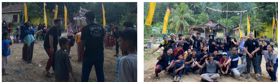
Gambar 2.3.13 Panitia Lomba HUT RI

Masyarakat Karang Indah dan Mahasiswa PKPM IIB Darmajaya mengadakan beberapa perlombaan seperti balap karung, joget balon, dan perlombaan lainnya.