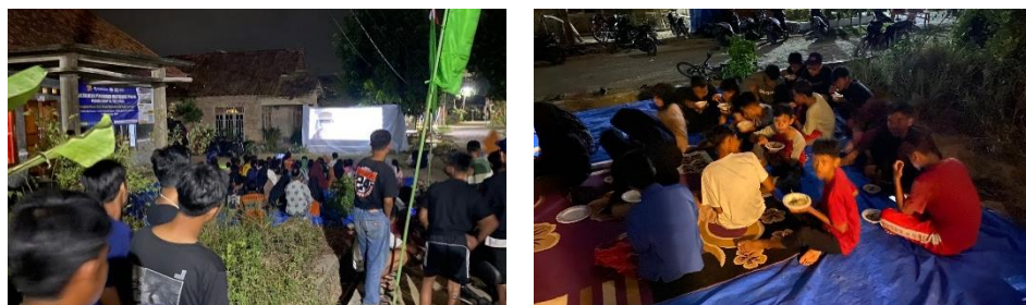
Gambar 2.3.19 Acara Perpisahan Dengan Masyarakat Dusun Karang Indah

Kegiatan ini bertujuan untuk berpamitan dan mengucapkan terimakasih kepada seluruh Masyarakat Desa Sanggi khususnya Dusun Karang Indah.