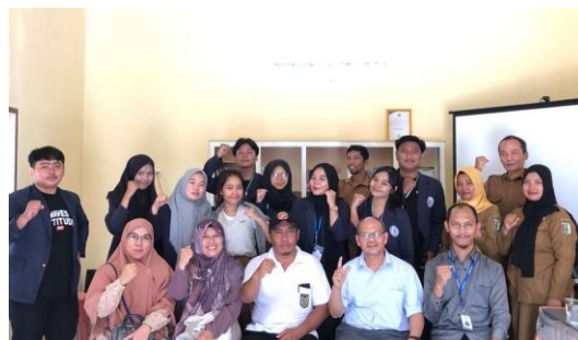
Gambar 2.3.11 Kehadiran Dosen Pembimbing Lapangan

Kunjungan Dosen dan TIM IIB Darmajaya di Desa Sanggi yang berlangsung di gedung Perpustakaan Desa Sanggi