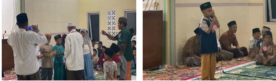
Gambar 2.3.12 Panitia Lomba Adzan & Mengaji

Dusun Karang Indah mengadakan lomba adzan dan mengaji dalam rangka memperingati Kemerdekaan HUT RI ke-78,