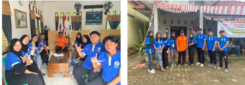
Gambar 2.3.3 Konfirmasi Kedatangan Di Kantor Desa Dan Membuat Rencana Program Kerja

Hadir di Kantor Desa Sanggi untuk konfirmasi kedatangan mahasiswa serta membahas Program Kerja PKPM yang akan dilaksanakan selama 30 hari.