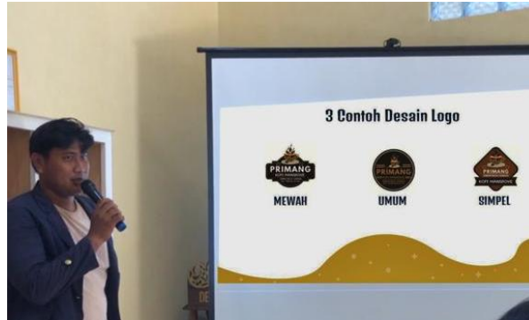
Gambar 2.3.20 Sosialisasi Dan Persentasi Program Kerja PKPM IIB Darmajaya

Menampilkan hasil Desain Kemasan, dan cara pemasaran yang baik dan benar