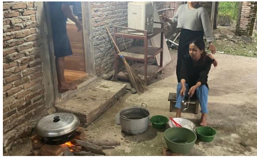
Gambar 2.3.17 Membuat Sirup Mangrove