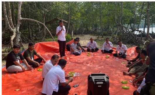
Gambar 2.3.16 Rapat Koordinasi Dalam Rangka Pembubaran Dan Evaluasi Panitia HUT RI

Setelah Kegiatan Upacara HUT RI selesai maka diadakan Pembubaran serta Evaluasi Kegiatan yang berlangsung di Kantor Kecamatan Padang Cermin