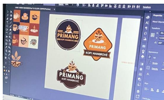
Gambar 2.3.14 Desain Kemasan Produk

Melakukan desain kemasan produk UMKM Menggunakan Adobe Illustrator.