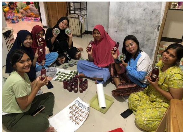
Gambar 2.3.8 Melihat Proses Pembuatan Olahan MANGROVE

Kunjungan ke UMKM PRIMANG untuk melihat proses pembuatan olahan Buah Pedada yang akan dijadikan Sebagai, Sirup Mangrove, Dodol Mangrove, dan Kopi Mangrove.