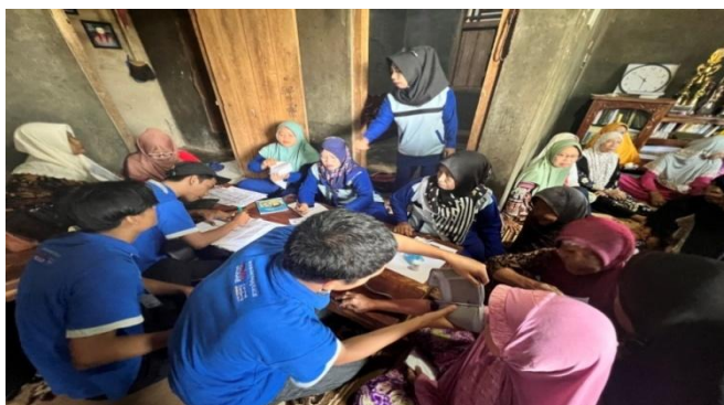
Gambar 2.5 Kegiatan Posyandu Lansia

Membantu Ibu-ibu PKK dalam mendata lansia di Dusun Ogan II. Kegiatan posyandu meliputi penimbangan berat badan, pengukuran tinggi badan, pengukuran lingkar perut, pengecekan tekanan darah serta gula darah, dan pemberian makanan tambahan seperti bubur kacang ijo.