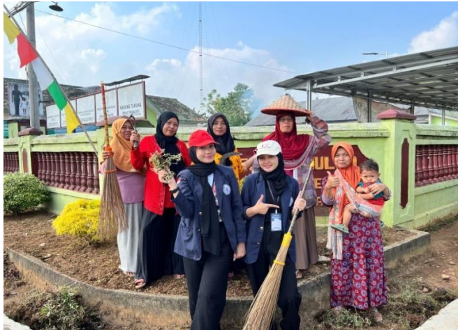
Gambar 2.4 Bakti Sosial Di Balai Desa Trimulyo

dilaksanakan di Balai Desa Trimulyo dimana akan menjadi tempat acara lomba akan diadakan. Baktisosial ini dilakukan bersama ibu-ibu PKK Desa Trimulyo, yang terdiri dari bersih-bersih lingkungan balai desa, menanam ulanganaman, dan pengecetan pot.