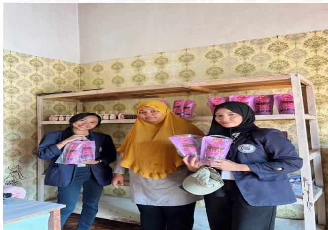
Gambar 2. 2 Pengambilan Gambar & Video Produk UMKM Chio Snack

Berdiskusi dengan pemilik UMKM bagaimana konten kekinian yang menarik dan sedang ramai digunakan oleh penjual online lainnya sebagai bentuk kreatif menarik dari konten-konten yang sudah ada sebelumnya lalu akan dipromosikan di media sosial . Serta Pengambilan beberapa objek produk untuk di ambil gambar serta video nya , lalu dijadikan konten promosi. Kegiatan ini dilaksanakan pada hari Jum'at 25 Agustus 2023, dapat dilihat pada gambar 2.