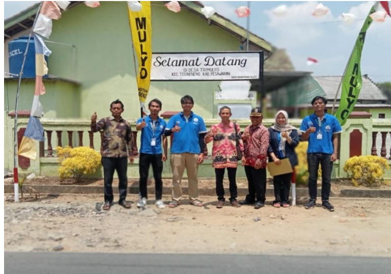
Gambar 2.6 Pemasangan Plang Selamat Datang

Membuat plang selamat datang di Desa Trimulyo, yang dipasang di balai desa, desa Trimulyo. Pembuatan plang ini dilakukan sebagai bentuk peninggalan mahasiswa PKPM yang melaksanakan kegiatan PKPM di Desa Trimulyo, selain cindremata berupa plakat.