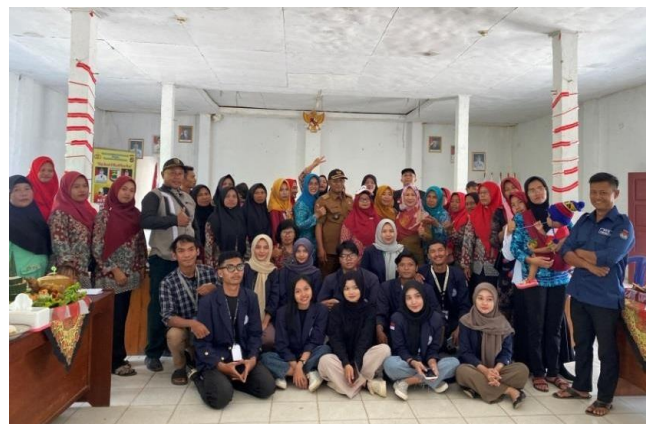
Gambar 6. Lomba Tumpeng Antar Dusun Dalam Acara HUT RI ke-78