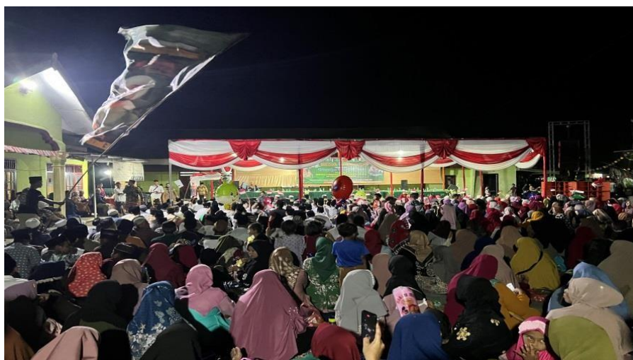
Gambar 13. Pengajian Akbar pada Malam Puncak HUT RI