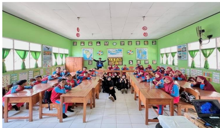
Gambar.9 Sosialisasi Stop Bullying Sejak Dini Di SDN 10 Tegineneng