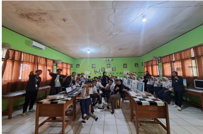
Gambar 10. Sosialisasi Pelatihan Komputer di SMP Negeri 15 Pesawaran