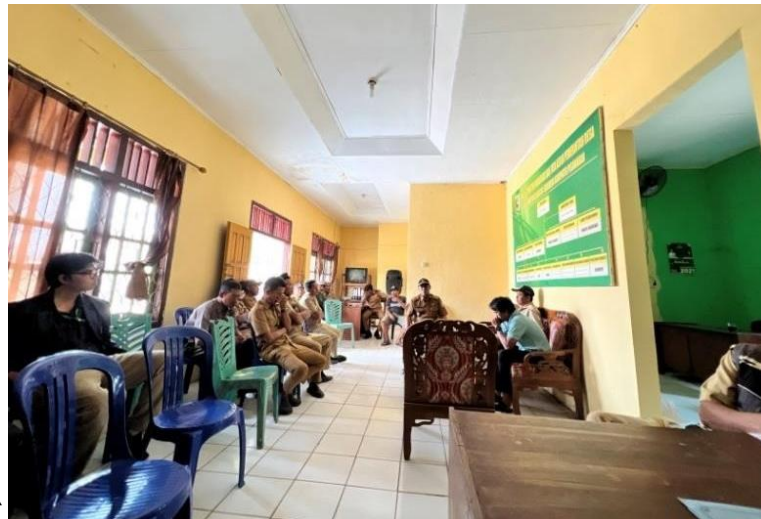
Gambar 5. Rapat Bersama Aparatur Desa