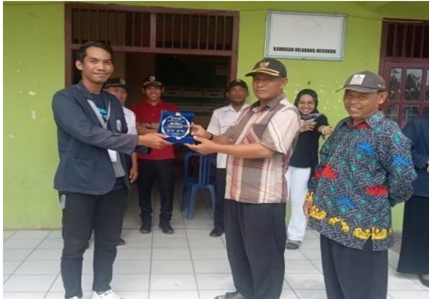
Gambar 14. Pemberian Cindramata