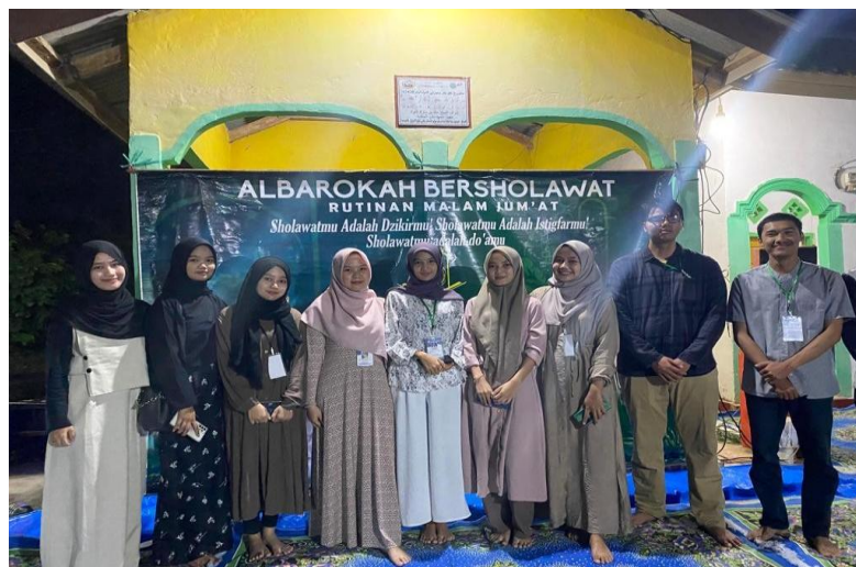
Gambar 3. Acara Pengajian Rutin Setiap Malam Jum'at