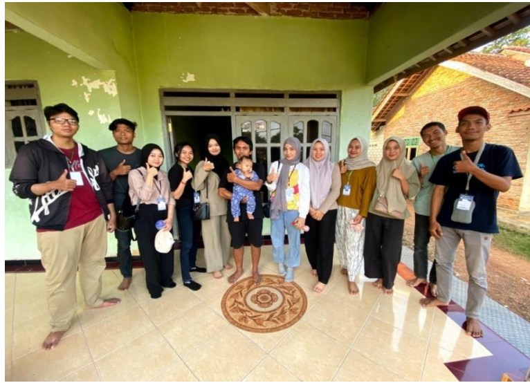
Gambar 4. Kunjungan kerumah ketua karang taruna