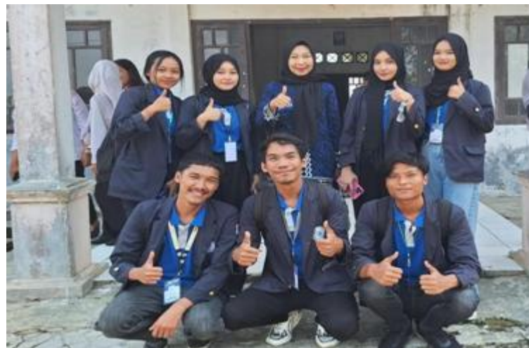
Gambar 15. Penjemputan Peserta PKPM