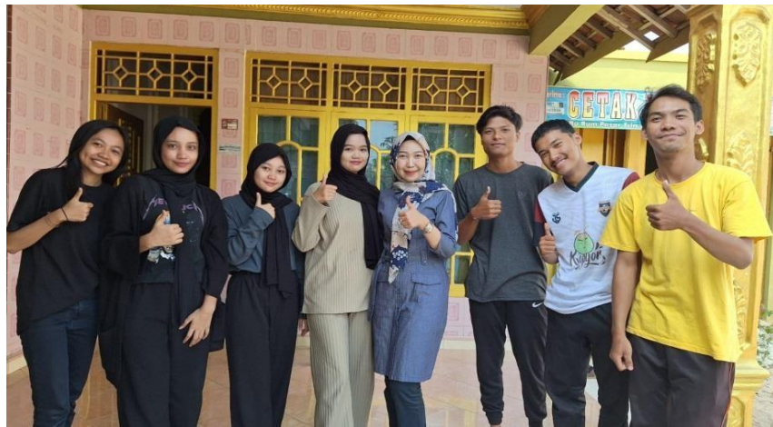
Gambar 11. Kunjungan DPL