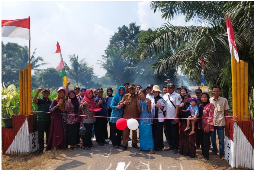
Gambar 7. Perlombaan Kebersihan Antar Dusun di Desa Trimulyo