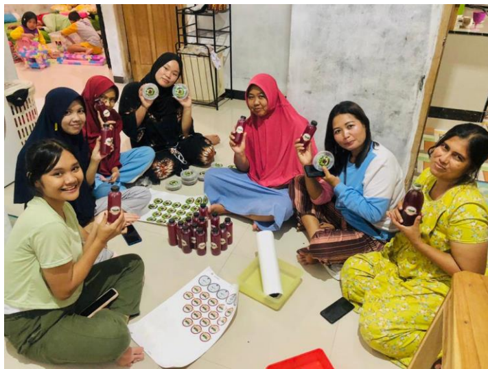
(Gambar 3 Survey UMKM Primang)