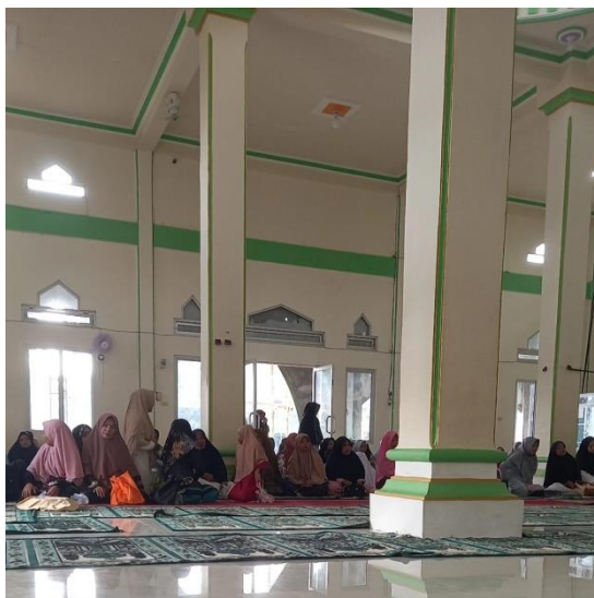
(Gambar 5 Menghadiri Pengajian)