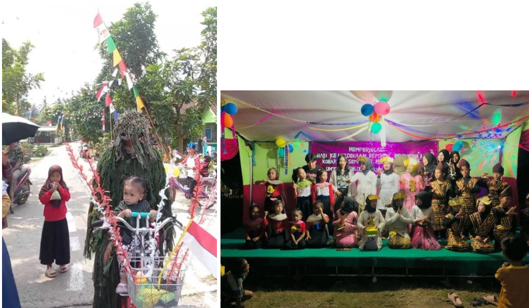
(Gambar 10 Mempersiapkan dan lomba 17 Agustus)