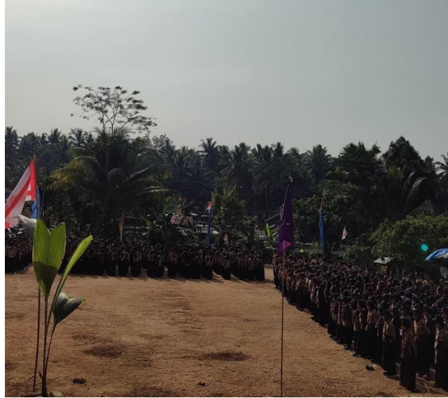
(Gambar 8 Mengikuti Upacara Hari Pramuka)