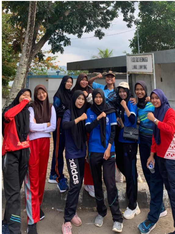
(Gambar 13 Mengikuti dan menjadi panitia jalan sehat)