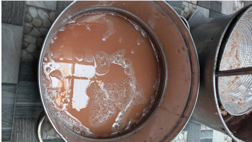
(Gambar 12 Pengolahan Mangrove)