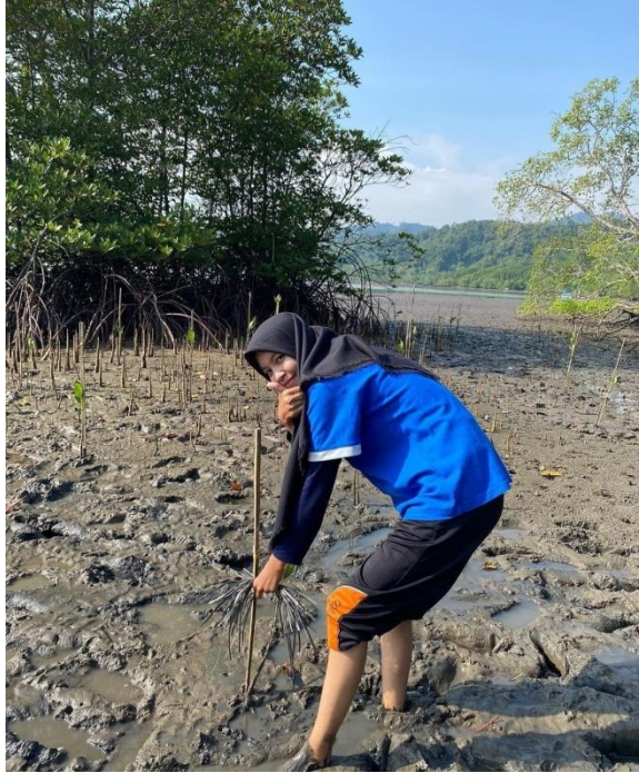
(Gambar 6 Melakukan Penanaman Mangrove)