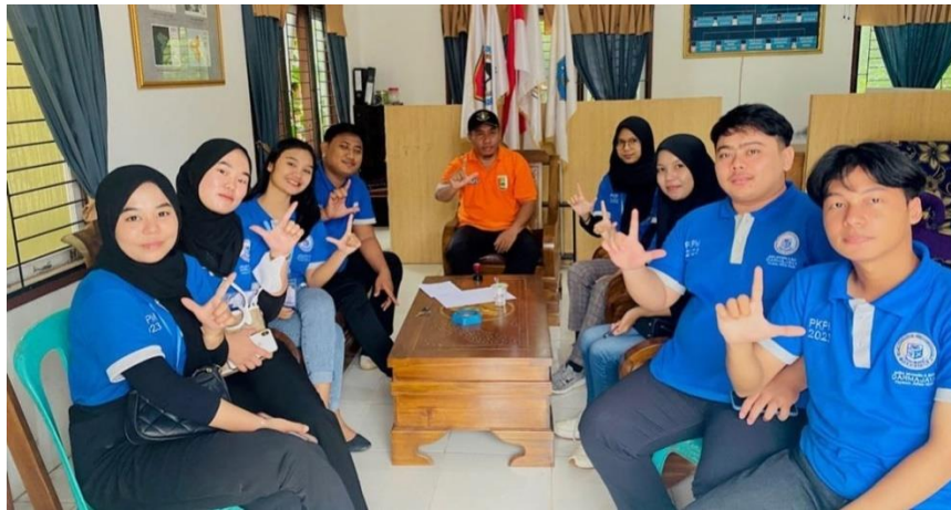
(Gambar 2 Meminta izin kepada kepala desa)