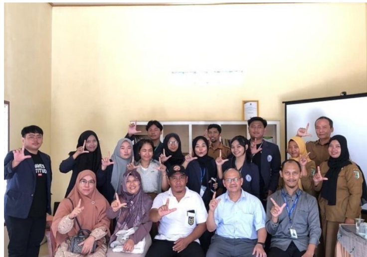
(Gambar 9 Kunjungan DPL ke Kantor Desa)