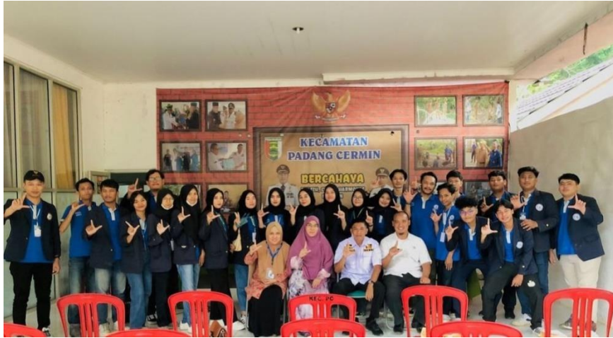
(Gambar 1 Mendatangi Kantor Kecamatan)