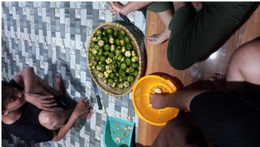
(Gambar 7 Melakukan panen Mangrove)