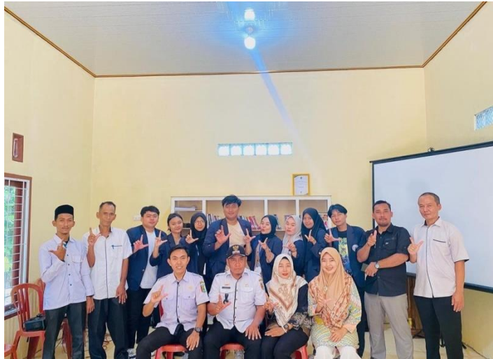
(Gambar 15 Sosialisasi)