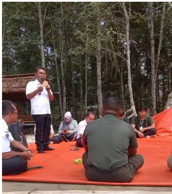
(Gambar 11 Pembubaran Panitia bersama Aparat Desa)