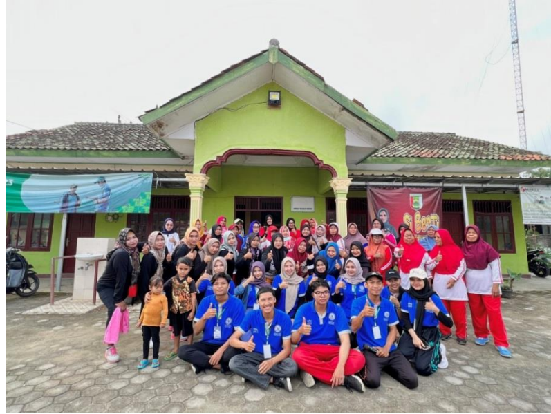
Gambar 2.4 Senam Bersama Ibu PKK