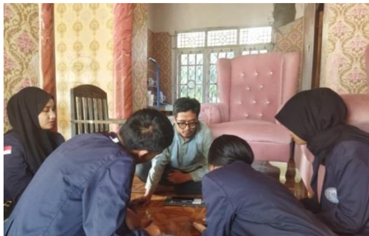
Gambar 2. 2 Pengenalan Landing Page

Menjelaskan program kerja yang akan dilakukan sebagai salah satu bentuk bantuan kepada UMKM Chio Snack yaitu Landing Page. Landing page adalah halaman khusus yang dibuat untuk kebutuhan pemasaran digital dan merupakan bagian dari website. Landing Page berfungsi mendorong pengguna untuk fokus pada satu produk agar dengan mudah melakukan transaksi website, menyediakan informasi lengkap soal web, platform, dan tombol pembelian, serta mengajak pengguna untuk melakukan aksi tertentu seperti membeli produk yang ditawarkan, dan mempelajari informasi yang diberikan.