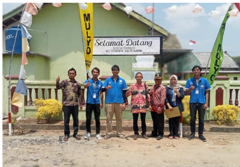
Gambar 2.8 Pemasangan Plang Selamat Datang

Membuat plang selamat datang di Desa Trimulyo, yang dipasang di balai desa, desa Trimulyo. Pembuatan plang ini dilakukan sebagai bentuk peninggalan mahasiswa PKPM yang melaksanakan kegiatan PKPM di Desa Trimulyo, selain cindremata berupa plakat.