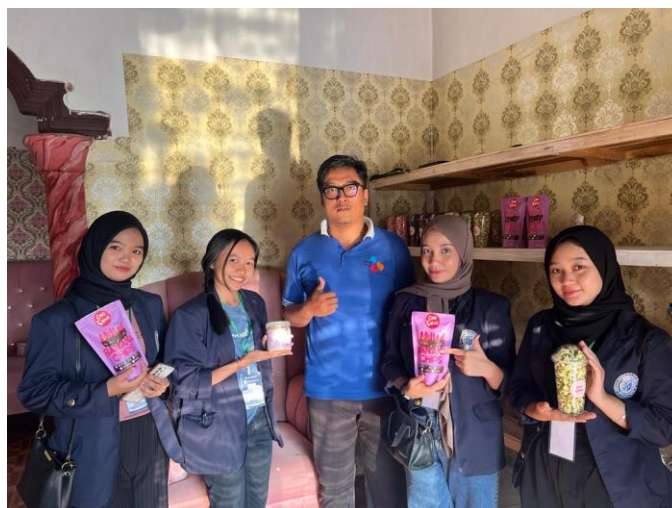
Gambar 2. 1 Sosialisai Digital Marketing

Kegiatan ini dilakukan dengan memberikan sedikit penjelasan terkait digital marketing, dan saling berbagi informasi yang dimiliki. Hal ini untuk kegiatan berbagai informasi terkait UMKM, serta berdiskusi mengenai apa saja hambatan dan permasalahan yang dihadapi selama menjalankan usaha tersebut. Sehingga dari hasil diskusi didapatkan bahwa permasalahannya yaitu kurangnya penggunaan digital marketing dan belum begitu paham mengenai akses digital marketing yang memudahkan konsumen mengakses langsung market place mereka.