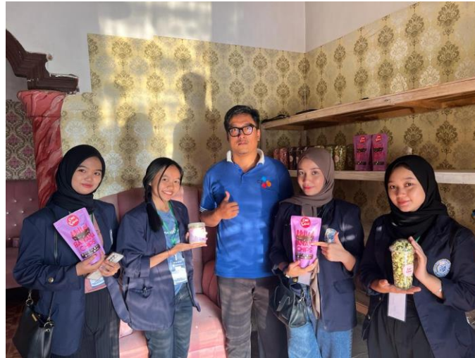
Gambar 2.7 Kunjungan ke UMKM Chio Snack