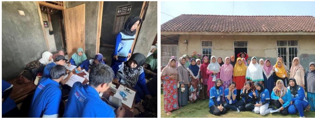
Gambar 2.6 Kegiatan Posyandu Lansia

Membantu Ibu-ibu PKK dalam mendata lansia di Dusun Ogan II. Kegiatan posyandu meliputi penimbangan berat badan, pengukuran tinggi badan, pengukuran lingkar perut, pengecekan tekanan darah serta gula darah, dan pemberian makanan tambahan seperti bubur kacang ijo.