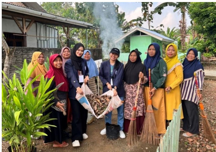
Gambar 2.5 Kegiatan Bakti Sosial

Kegiatan bakti sosial dilakukan sebagai bentuk persiapan acara HUT R1 ke-78. Kegiatan ini dilaksanakan di Balai Desa Trimulyo dimana akan menjadi tempat acara lomba akan diadakan. Bakti sosial ini dilakukan bersama ibu-ibu PKK Desa Trimulyo, yang terdiri dari bersih-bersih lingkungan balai desa, menanam ulang tanaman, dan pengecatan pot.