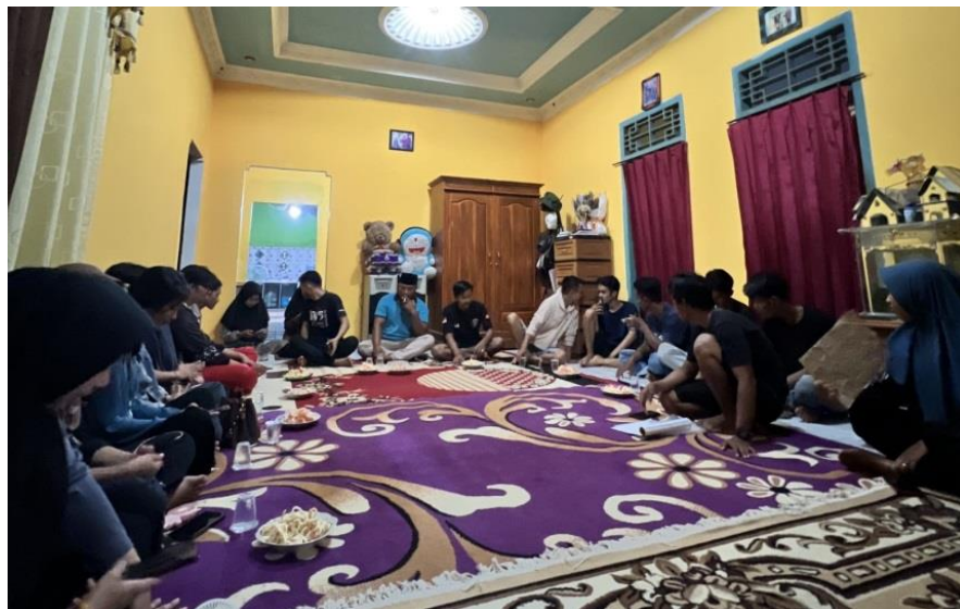
Gambar 2. Rapat Bersama Karang Taruna