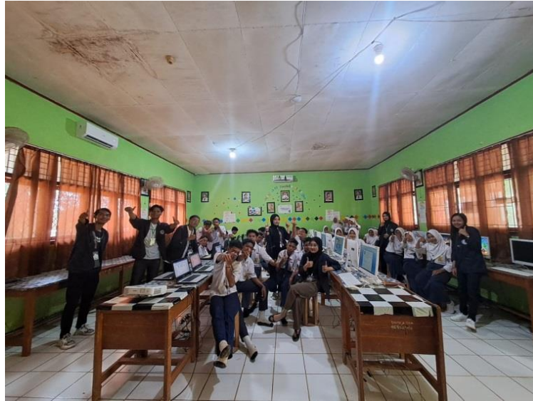
Gambar 11. Sosialisasi Pelatihan Komputer di SMP Negeri 15 Pesawaran