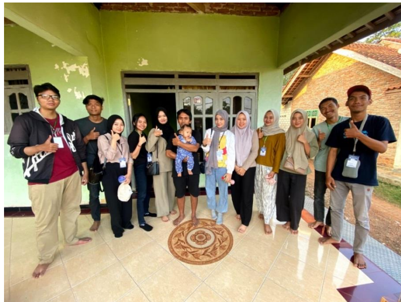
Gambar 4. Kunjungan ke rumah Ketua Karang Taruna