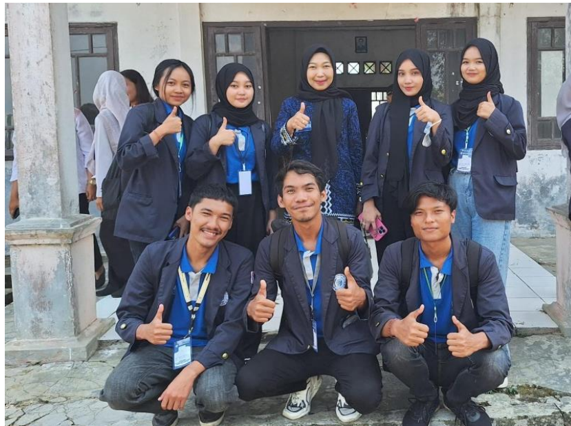
Gambar 15. Penjemputan Peserta PKPM