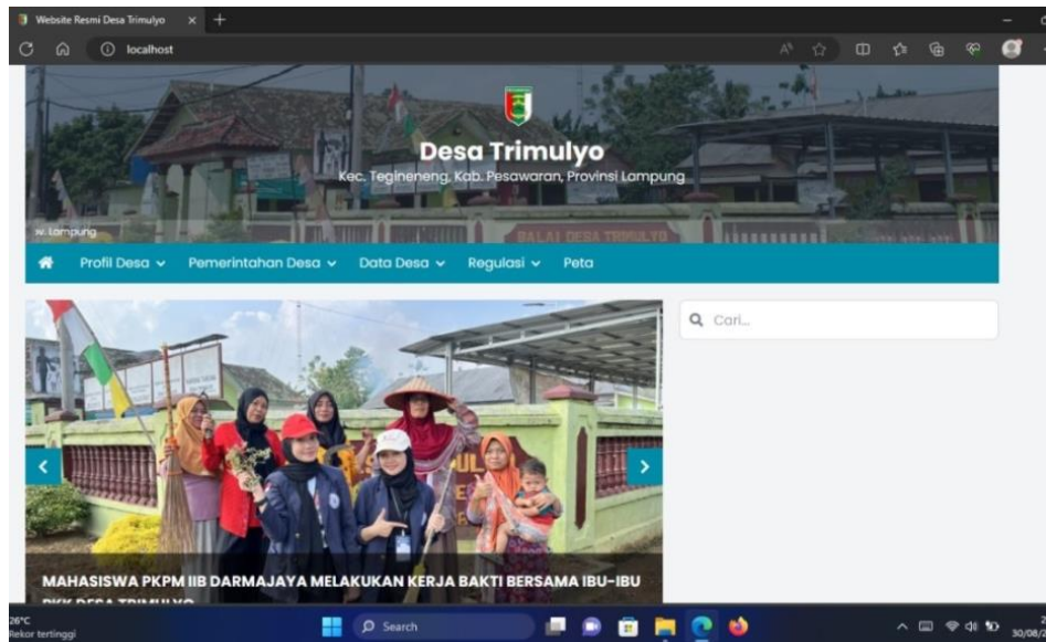
Gambar 9. Pembuatan Web Desa