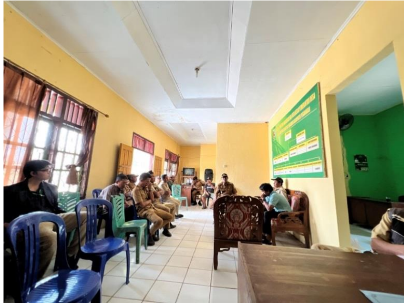
Gambar 5. Rapat Bersama Aparatur Desa