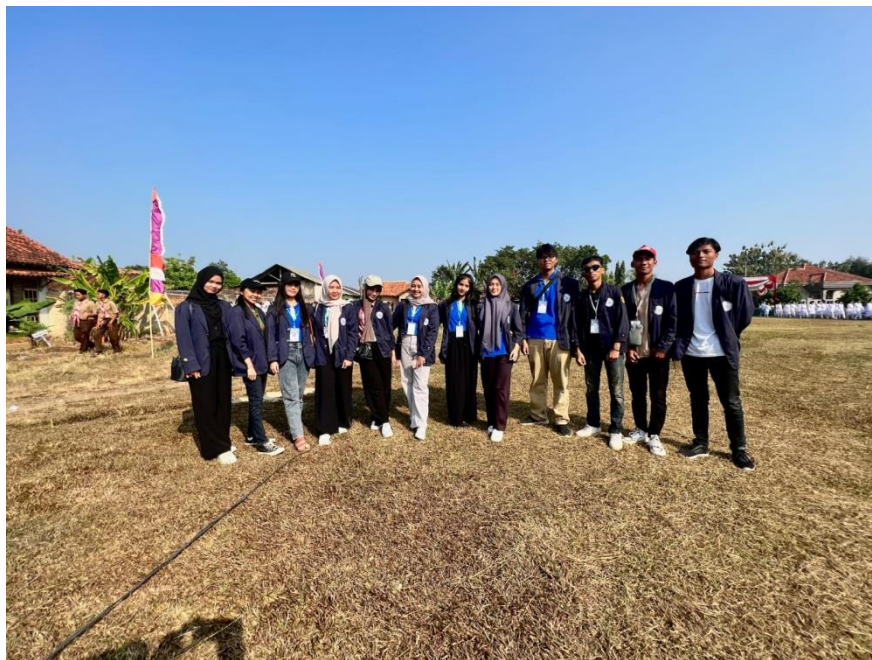
Gambar 8. Upacara 17 Agustus di Lapangan Kecamatan Tegineneng