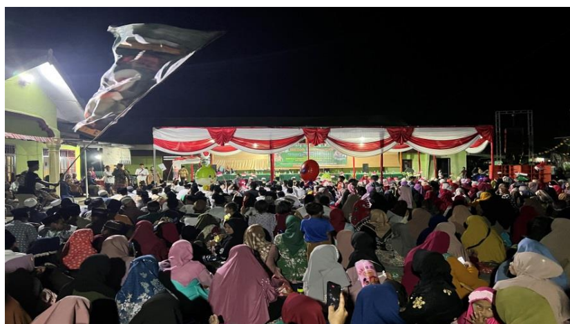
Gambar 13. Pengajian Akbar pada Malam Puncak HUT RI