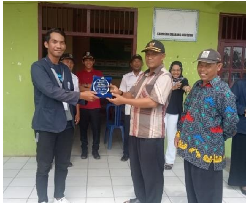
Gambar 14. Pemberian Cindramata