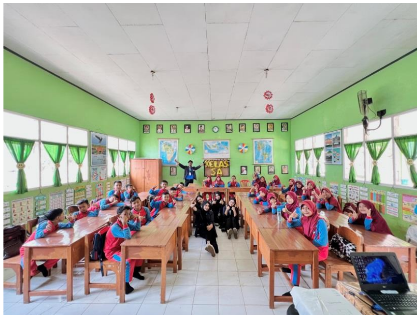
Gambar 10. Sosialisasi Edukasi Stop Bullying dan Minat Literasi di SD Negeri 10 Tegineneng