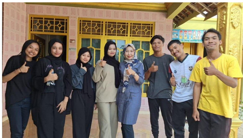
Gambar 12. Kunjungan DPL