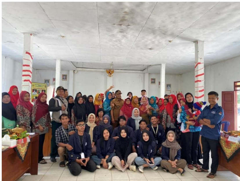
Gambar 6. Lomba Acara HUT RI ke-78