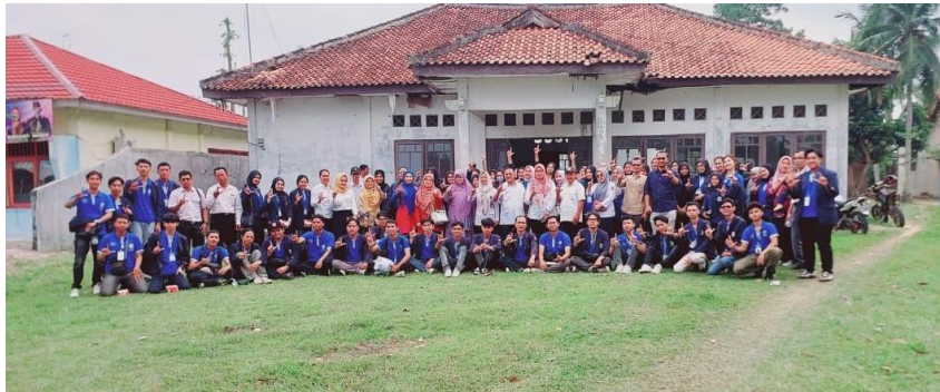
Gambar 1. Penyerahan Peserta PKPM