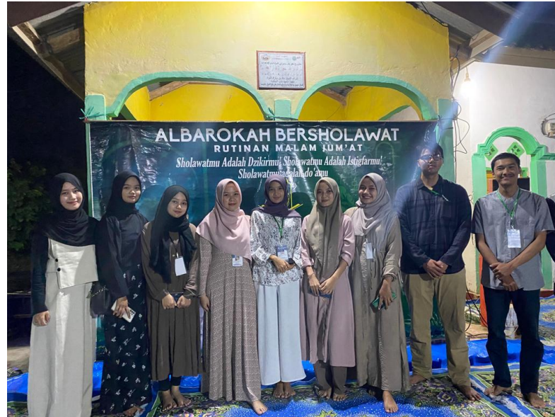
Gambar 3. Acara Pengajian Rutin Setiap Malam Jum'at