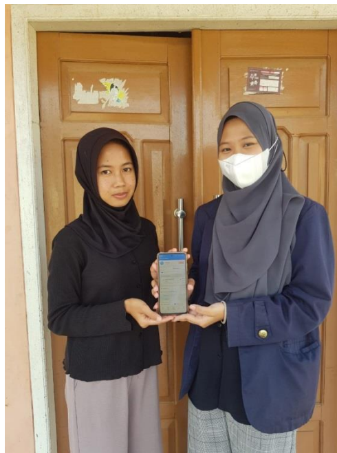
Gambar 2 2 Foto bersama pemilik UMKM