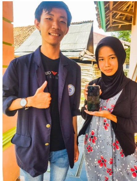
Gambar 1.2 Foto bersama dengan pemilik UMKM