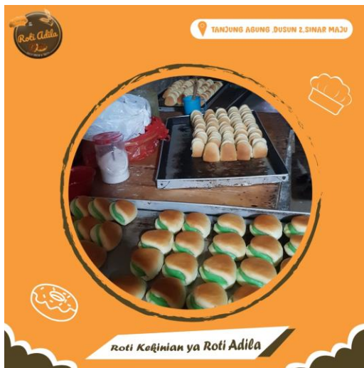
Gambar 1.1 desain feed ig Roti adila

Pengenalan dan pelatihan aplikasi Picsart kepada pemilik UMKM. Aplikasi Picsart adalah aplikasi yang bertujuan untuk merancang desain dan mengedit foto untuk keperluan public salah satunya bagi UMKM. Tujuan pembelajaran mengenai Aplikasi Picsart supaya pak M. Abas dan anaknya yaitu Adila selaku pemilik UMKM Roti Adila dapat Merancang dan bisa mengaplikasikan desain ke dalam instagram yang berkaitan dengan usahanya