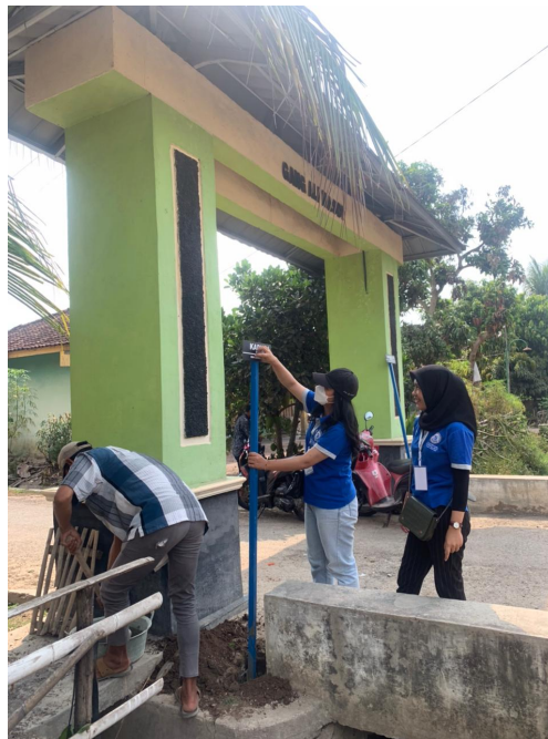
gambar 2.4 pemasangan plang

Gotong royong ini selain menjaga kebersihan dan keindahan lingkungan juga untuk menjalin silaturahmi antar warga dan juga mahasiswa PKPM. Selain gotong royong ada pula pemasangan plang.