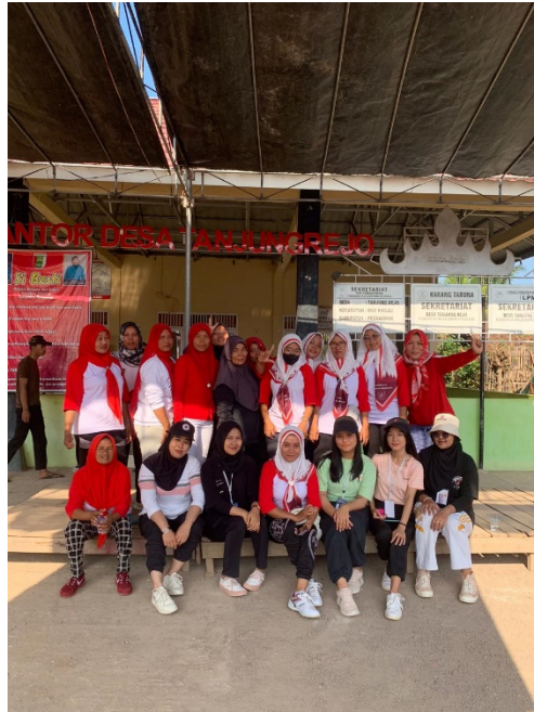
gambar 1.9 senam Bersama ibu ibu

Senam sangat bermanfaat dalam mengembangkan komponen fisik dan kemampuan gerak (motor ability). Orang - orang yang terlibat senam akan berkembang daya tahan ototnya, kekuatannya, powernya, kelenturannya, koordinasi, kelincahan, serta keseimbangan.