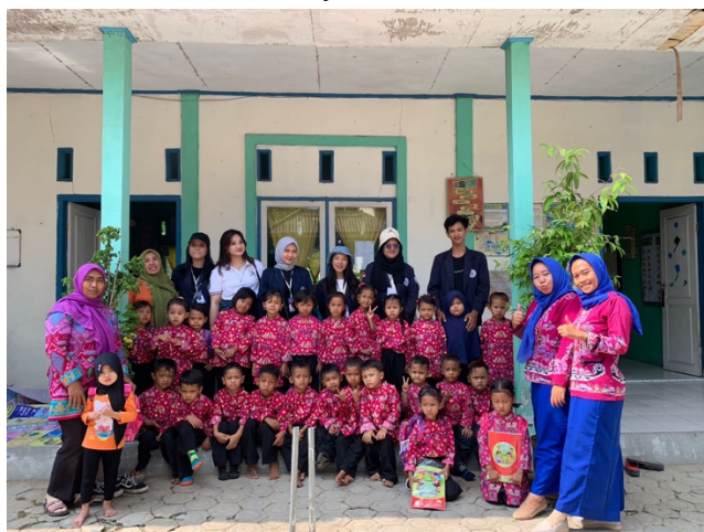
gambar 2.1 pendampingan pengajaran PAUD Al-Baraqah

Pada kegiatan ini selain menjalankan program kerja tentang pendidikan juga sebagai bentuk silaturahmi. Dalam kegiatan ini kami memberikan bantuan terhadap guru guru untuk ikut serta mengajar siswa/I Madrasah Ibtidaiyah.