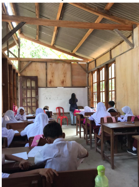
gambar 2.2 mengajar Madrasah Ibtidaiyah

Pada kegiatan ini selain menjalankan program kerja tentang pendidikan juga sebagai bentuk silaturahmi. Dalam kegiatan ini kami memberikan bantuan terhadap guru guru untuk ikut serta mengajar siswa/I Madrasah Ibtidaiyah.