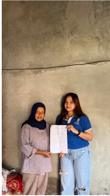
gambar 1.1 surat perizinan kerja sama dengan UMKM