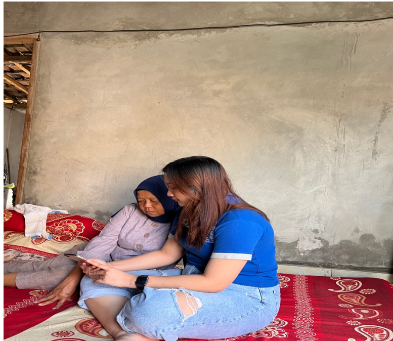
gambar 1.3 pelatihan penggunaan media sosial Instagram