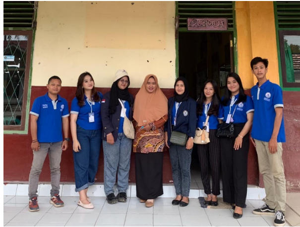
gambar 2.3 Meminta izin untuk mengajar di SDN 8 Way Khilau

Pada kegiatan ini selain menjalankan program kerja tentang pendidikan juga sebagai bentuk silaturahmi. Dalam kegiatan ini kami memberikan beberapa materi tentang kenakalan remaja, narkoba dan ikut serta dalam memberikan materi pembelajaran.