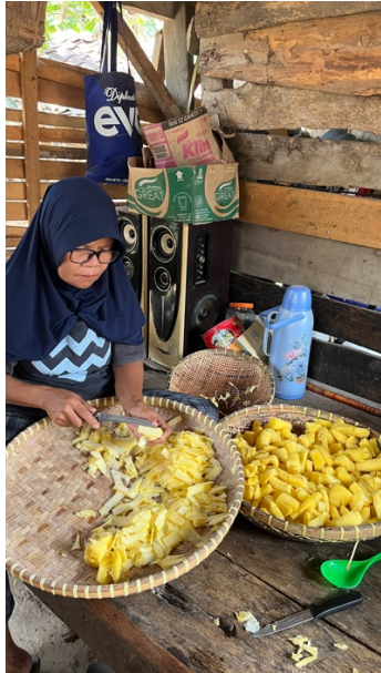
gambar 1.4 proses pembuatan keripik manggleng