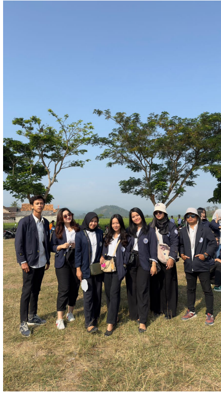
gambar 1.5 upacara Hut RI