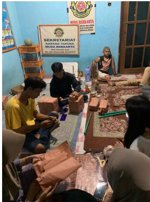
gambar 1.8 pembungkusan hadiah