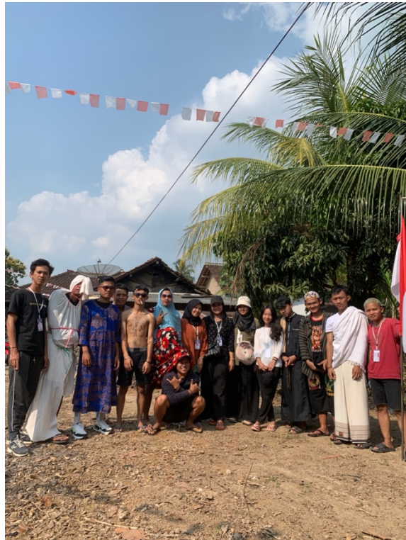
gambar 1.6 panitia perlombaan 17 agustus