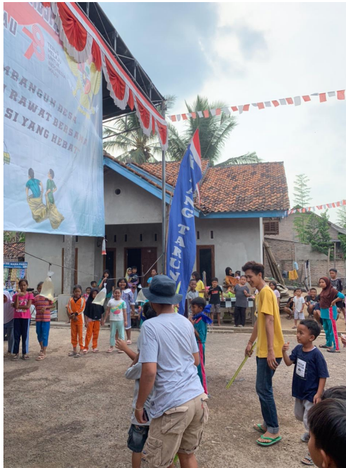
gambar 1.7 Perlombaan 17 agustus