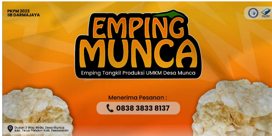
Gambar 2.8 Finalisasi Banner

Penyerahan banner kepada pihak UMKM Emping Munca yang digunakan sebagai media promosi offline bagi UMKM Emping Munca. Dapat dilihat pada gambar 2.9.