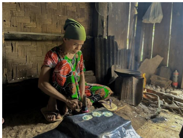
Gambar 2.1 Proses Pembuatan Emping

Survey dan kunjungan ke UMKM Emping Munca sekaligus melihat proses pembuatan emping tangkil yang berada di Dusun Way Reda, Desa Munca, Kecamatan Teluk Pandan. Kegiatan ini dilaksanakan pada Hari Kamis, 10 Agustus 2023. Dokumentasi kegiatan dapat dilihat pada gambar 2.1.