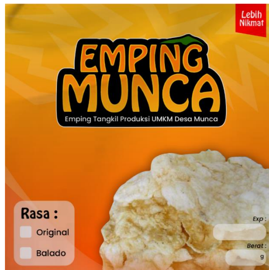
Gambar 2.5 Finalisasi Label

Finalisasi perancangan label kemasan untuk UMKM Emping Munca setelah melalui tahap asistensi kepada pemilik Usaha. Dapat dilihat pada gambar 2.5.