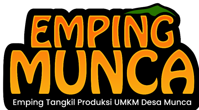
Gambar 2.3 Finalisasi Logo Terpilih

Finalisasi perancangan identitas usaha logo untuk UMKM Emping Munca setelah melalui tahap asistensi kepada pemilik Usaha. Dapat dilihat pada gambar 2.3.