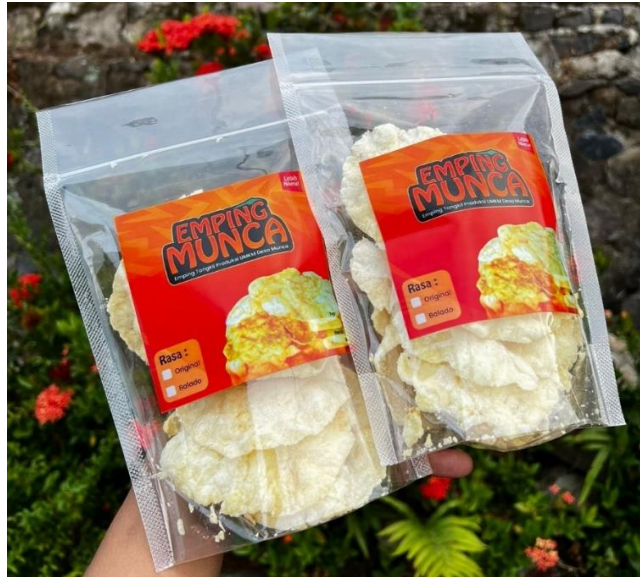
Gambar 2.6 Pengaplikasian Label pada Kemasan