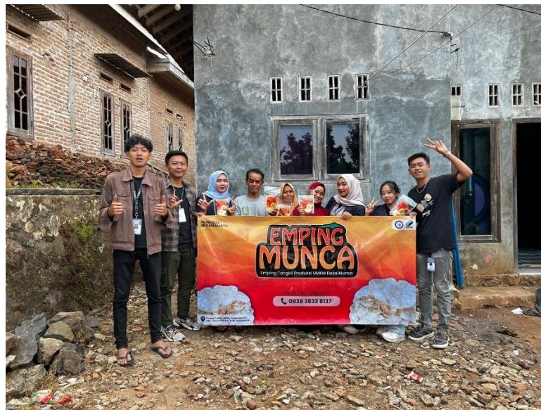
Gambar 2.9 Penyerahan Banner

Penyerahan banner kepada pihak UMKM Emping Munca yang digunakan sebagai media promosi offline bagi UMKM Emping Munca. Dapat dilihat pada gambar 2.9.