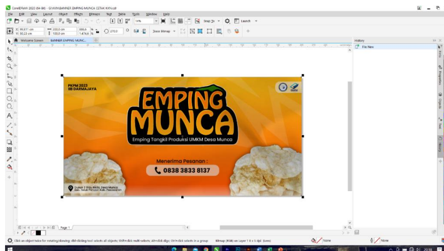
Gambar 2.7 Proses Desain Banner

Membantu merancang pembuatan desain banner yang nantinya dipasang pada bagian depan rumah produksi, sebagai media promosi offline dari produk Emping Munca. Kegiatan ini dilaksanakan pada Hari Minggu, 20 Agustus 2023. Dapat dilihat pada gambar 2.7.