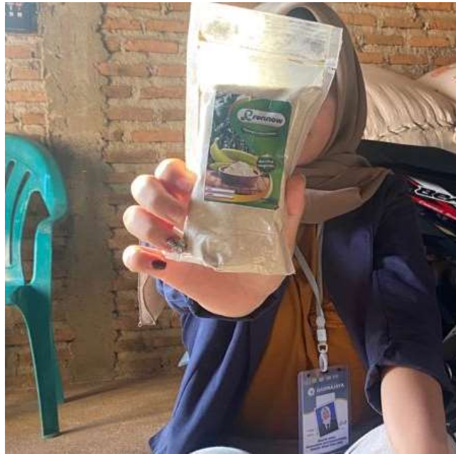
Gambar 2.11 Setelah Tepung Pisang Dikemas