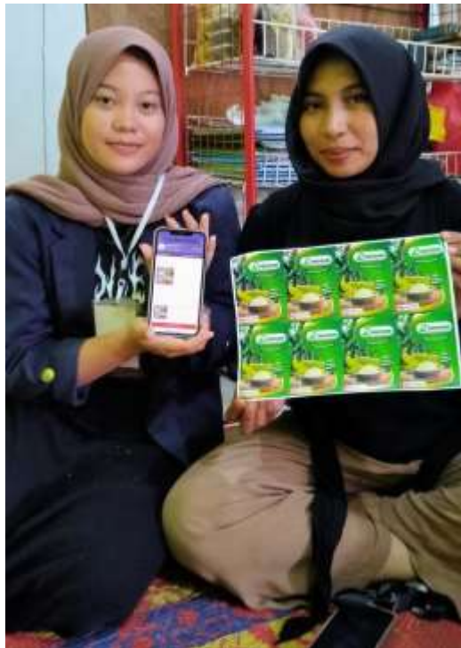
Gambar 2.4 Pendampingan Kepada Pemilik UMKM Tepung Pisang Rennow

Melakukan pendampingan pada pemilik UMKM Tepung Pisang Rennow agar bisa mengelola Sosial Media Instagram Tepung Pisang Rennow dan Marketplace Shopeenya supaya mampu menjangkau pelanggan dimana saja dan kapan saja dan membangun koneksi dengan pelanggan.