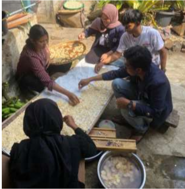
Gambar 2.7 Proses Penjemuran di Tampah Agar Kering