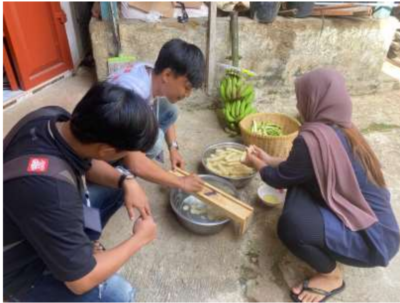
Gambar 2.5 Proses Pengupasan Kulit Pisang dan Pencucian Pisang