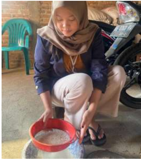
Gambar 2.9 Proses Penyaringan Agar Halus