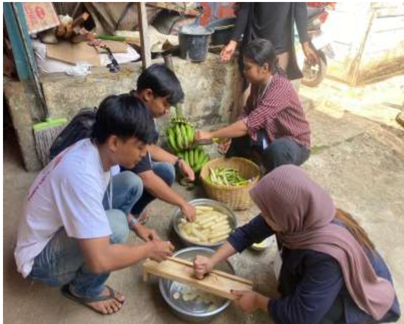
Gambar 2.6 Proses Pematangan Pisang Menjadi Tipis