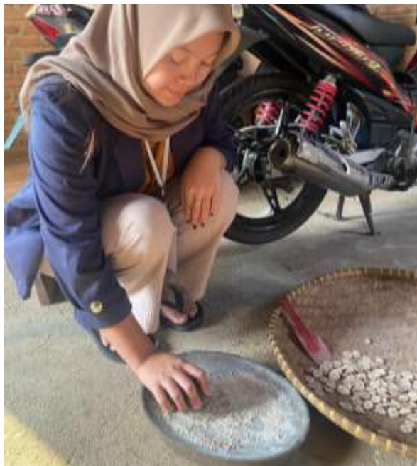
Gambar 2.8 Proses Penggilingan Pisang Kering Menjadi Tepung