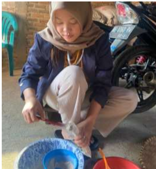
Gambar 2.10 Proses Pengemasan Tepung Pisang