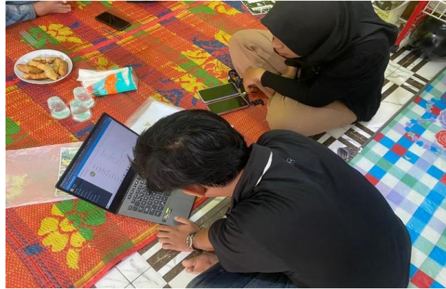
Gambar.2.3 Membantu membuat dan mempromosikan Produk melalui Simonik