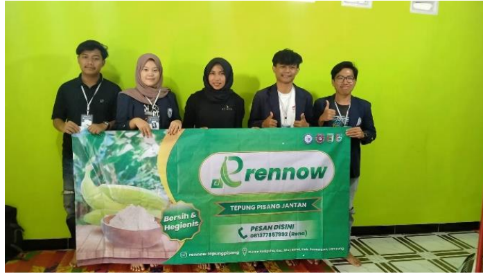
Gambar 2.5 Penyerahan banner untuk UMKM Tepung Pisang Rennow