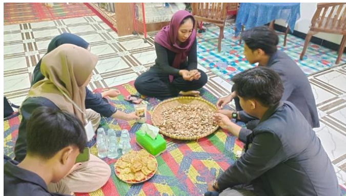
Gambar 2.2 Berdasarkan dengan pemilik UMKM Tepung pisang Rennow

Berdiskusi bagaimana strategi pemilik usaha produk tepung pisang rennow dapat dipasarkan secara online dan dapat bersaing dengan UMKM lainnya, kegiatan ini dilaksanakan pada.