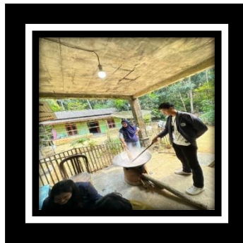
Gambar 2.12 Proses Pembuatan dodol mangrove

Produksi dodol mangrove memerlukan bahan baku buah mangrove tepung beras, gula aren dan santan kelapa, proses yang lumayan lama kurang lebih 7 jam waktu pemasakan dari pengupasan buah mangrove, perebusan santan kelapa, setelah bahan tercampur semua lalu diaduk hingga mengental dan tidak lengket dari wajan lalu diamkan selama 8 jam. setiap pembuatan dodol mangrove dapat memproduksi kurang lebih 50 bungkus dodol mangrove yang diolah dengan 1 wajan besar