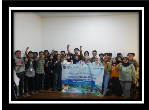
Gambar 2.16 Mengikuti Sosialisasi BCA

Mengikuti sosialisasi yang diadakan oleh BCA dan juga CECT Trisakti tentang digital marketing khusus desa wisata