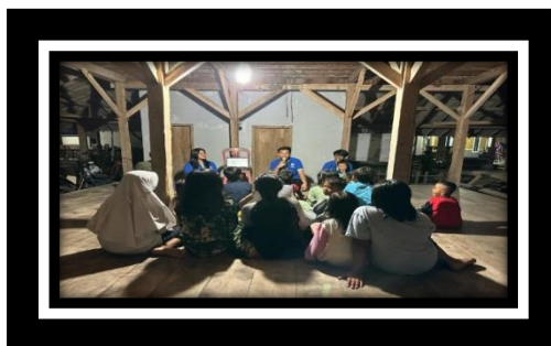
Gambar 2.5 Edukasi pentingnya menabung sejak dini

Menurut Anshori (2007:87) Tabungan adalah simpanan yang penarikannya hanya dapat dilakukan menurut syarat tertentu yang disepakati antara Nasabah dan Pihak Bank. Pentingnya menabung dan dapat membedakan antara kebutuhan dan kepentingan adalah hal terpenting yang saat ini harus dimiliki seseorang sejak sedini mungkin. Kegiatan Sosialisasi pentingnya menabung sejak dini ini bertujuan untuk memberikan pemahaman kepada anak-anak bahwa menabung dari sejak dini sangat bermanfaat bagi masa depan. Dengan terlaksananya kegiatan ini penulis berharap anak-anak paham mengenai pentingnya menabung di usia dini serta mengetahui perbedaan keinginan dan kebutuhan, sehingga mereka dapat meminimalisirkan pemakaian uang yang tidak perlu serta dapat memanfaatkan serta menggunakan uang dengan baik.