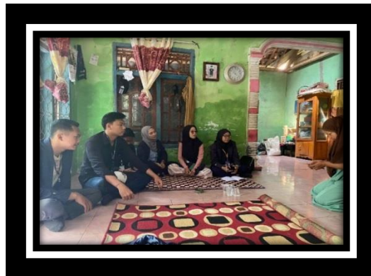
Gambar 2.7 Kunjungan Ke UMKM Dodol Mangrove

yang luas, penduduk yang ramai dan sumber daya alam yang melimpah sangat berpotensi sekali untuk masyarakat mendirikan sebuah usaha, terdapat begitu banyak UMKM yang ada di desasinar rejeki, kunjungan yang kami lakukan pada setiap UMKM yang ada di desa sinar rejeki untuk bersilaturahmi serta meminta izin untuk ikut serta dalam kegiatan UMKM.