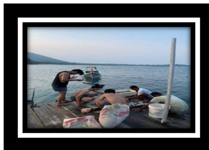
Gambar 2.15 penanaman Trumbu Karang

Membantu dalam melakukan penanaman terumbu karang di sekitar Pulau Pahawang untuk berupaya mengembalikan ekosistem laut yang sudah rusak