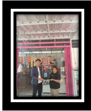
Gambar 2.2 Pelatihan Penggunaan QRIS pada UMKM SRC TIA