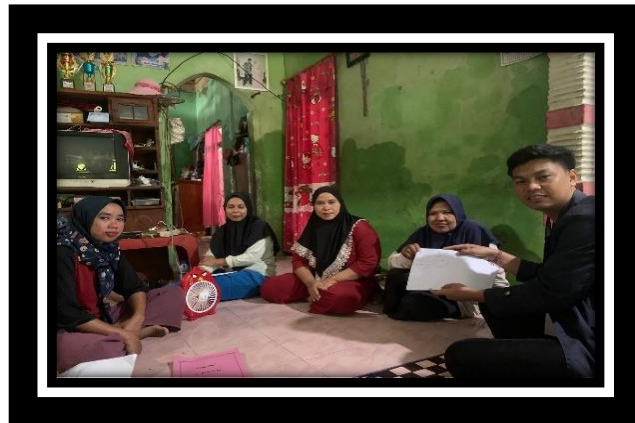
Gambar 2.6 Pelatihan Pencatatan Akutansi Tradisional