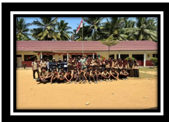
Gambar 2.11 Sosialisasi Bahaya Gajed

Literasi digital adalah pengetahuan serta kecakapan dalam memanfaatkan media digital, seperti alat komunikasi, jaringan internet dan lain sebagainya. Dengan mengedukasi pentingnya penggunaan intrnet dengan baik akan berdampak baik pada kasus Hoax dan Bullying yang ada di Indonesia yang umumnya dilakukan melalui internet hal itu terjadi karena banyak yang tidak bijak dalam menggunakan internet maka dari itu penting sekali adanya literasi digital.