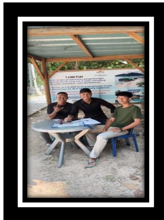
Gambar 2.17 Membantu jaga pos tiket di pulau pahawang

Sesuai Peraturan Desa No.2 Tahun 2023 mengenai tarif wisatawan masuk ke Pulau Pahawang, kami membantu aparaturnya BUMDes dalam penjagaan pos tiket wisata.