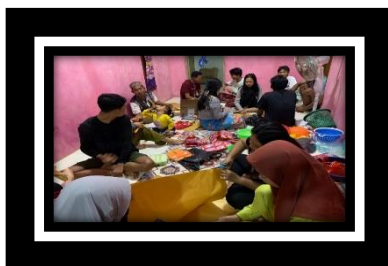
Gambar 2.10 persiapan Perlombaan HUT RI