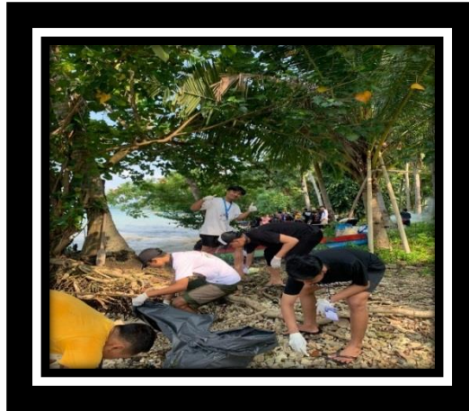
Gambar 2.18 Bersih-Bersih Pantai

Gotong royong membersihkan lingkungan dan pantai sekitar pulau pahawang dilakukan di rutin setiap minggunya bersama warga Desa Pulau Pahawang.