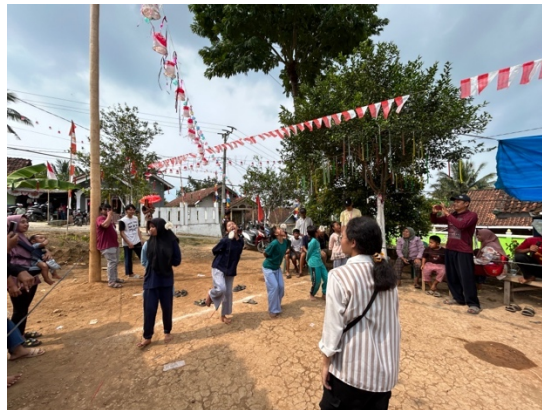
Gambar 2.7 Ikut berpartisipasi dalam kegiatan 17 Agustus

Ikut berpartisipasi dalam memeriahkan peringatan HUT RI ke-78 dengan membantu menjadi panitia dalam acara perlombaan yang diadakan oleh pemuda setempat di Dusun Wonosari maupun yang diadakan oleh perangkat desa di Balai Desa Sumber Jaya.