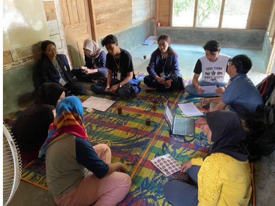
Gambar 2.2 Memberikan edukasi mengenai pemanfaatan platform e-commerce kepada UMKM Edelweis