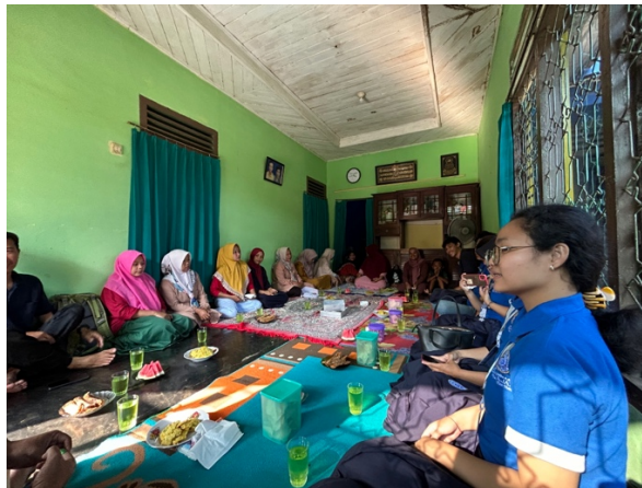
Gambar 2.1 Silaturahmi dan kunjungan ke UMKM Edelweis

Silaturahmi dan Kunjungan ke UMKM Edelweis kepada ibu-ibu pengurus guna meminta izin, bantuan dan support supaya kegiatan PKPM selama 30 hari di Desa Sumber Jaya dapat berjalan dengan baik dan lancar.