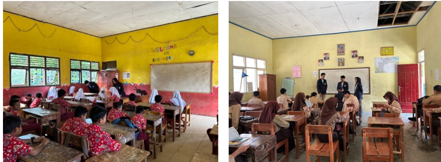
Gambar 2.6 Kegiatan mengajar di sekolah-sekolah

Kegiatan mengajar yang dilakukan di beberapa sekolah Desa Sumber Jaya merupakan salah satu bentuk implementasi pengabdian ke masyarakat dalam bidang pendidikan serta memberikan edukasi terkait pentingnya mengikuti anjuran dari pemerintah mengenai Wajib Belajar 12 tahun dan memotivasi para siswa dan siswi untuk melanjutkan pendidikan hingga ke jenjang Perguruan Tinggi.