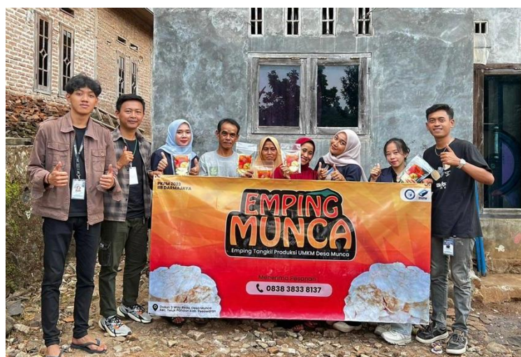
Gambar 2. 8 Penyerahan banner Emping Munca

Setelah selesai membuat desain banner proses selanjutnya adalah melakukan pencetakan banner dan menyerahkannya kepada pemilik UMKM emping munca. Adapun dokumentasi penyerahan banner dapat dilihat pada gambar 2.8