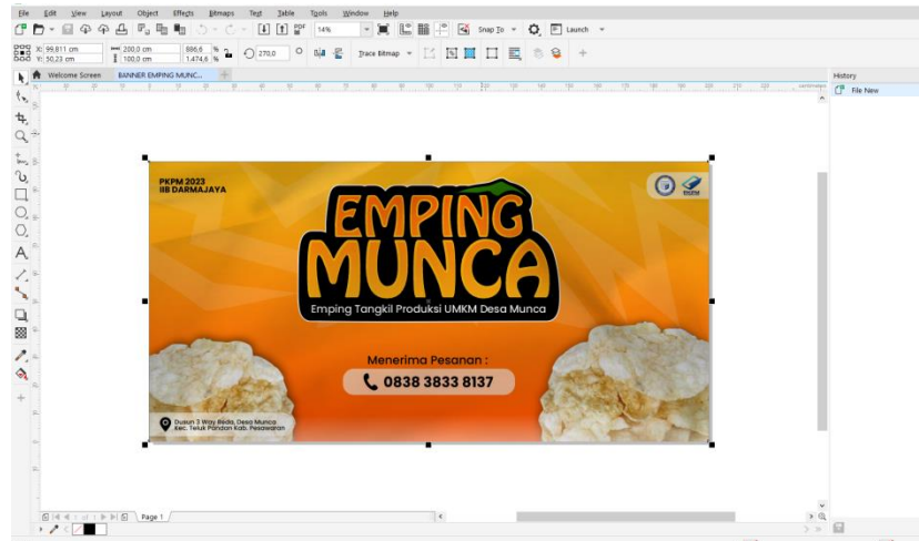
Gambar 2. 7 Desain banner Emping Munca

2.3.7 Membantu pembuatan banner untuk UMKM Emping Munca Pemasangan banner ini bertujuan untuk membantu UMKM emping munca memiliki identitas dalam kegiatan usahanya. Adapun hasil desain banner emping munca dapat dilihat pada gambar 2.7.