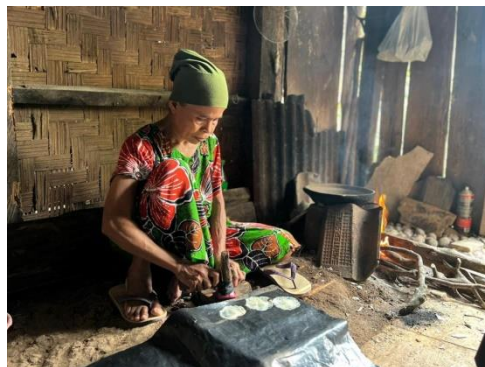
Gambar 2. 6 Proses pembuatan emping

Dalam kunjungan ini kami bertujuan untuk mengetahui bagaimana proses pembuatan dari bahan mentah tangkil diolah hingga menjadi produk emping. Adapun hasil dokumentasi dari proses pembuatan emping dapat dilihat pada gambar 2.6.