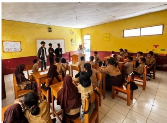
Gambar 2.4 Sosialisasi ke SDN 9 Teluk Pandan

Kegiatan sosialisasi yang kami lakukan bertujuan untuk memberi pemahaman kepada siswa dan siswi Sekolah Dasar Negeri 9 Teluk tentang bagaimana cara memiliki etika yang baik dalam kehidupan sehari hari baik di lingkungan sekolah ataupun diluar sekolah. Adapun kegiatan sosialisasi telah dilaksanakan dapat dilihat pada gambar 2.4