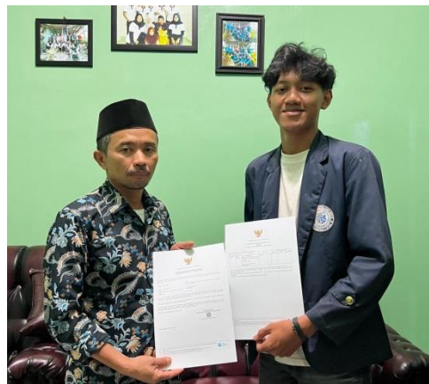
Gambar 2. 13 Penyerahan NIB

Pembuatan NIB ini bertujuan untuk membuat UMKM yang ada di Desa munca memiliki legalitas yang resmi. NIB digunakan sebagai tanda pengenal yang sah dan legalitas dalam menjalankan kegiatan usaha (Agustina, 2023). Adapun penyerahan NIB kepada UMKM di desa Munca dapat dilihat pada gambar 2.13