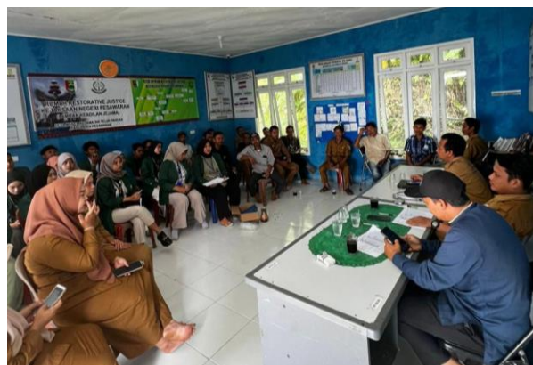
Gambar 2. 12 Rapat kepanitiaian HUT RI

Dalam kegiatan rapat dengan aparaturnya Desa yang dilaksanakan di gedung GSG Desa Munca membahas tentang kegiatan yang akan dilaksanakan dan membentuk susunan kepanitiaian dalam rangka menyambut hari kemerdekaan Indonesia yang ke 78 di Desa Munca. Adapun dokumentasi rapat kepanitiaian HUT RI ke 78 dapat dilihat pada gambar 2.12