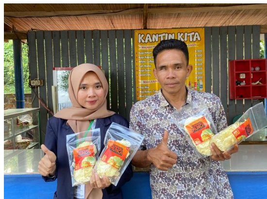
Gambar 2. 10 Pemasaran Emping Munca

Selain membantu pembuatan banner dan kemasan produk Emping Munca kami juga membatu proses pemasaran. Adapun dokumentasi proses pemasaran Emping Munca dapat dilihat pada gambar 2.10