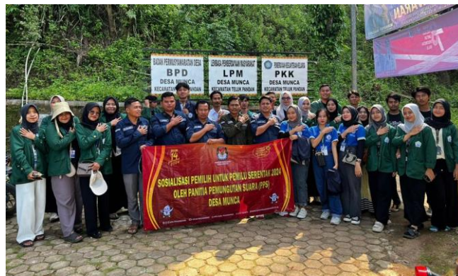
Gambar 2. 11 Kegiatan Sosialisasi PSS Munca

Kegiatan sosialisasi ini di ikuti oleh aparaturnya desa dan mahasiswa PKPM IIB DARMAJAYA dan KKN UINRIL, dalam sosialisasi ini PPS munca menjelaskan tentang tata cara memilih pada pemilu yang akan datang serta menjelaskan cara memeriksa apakah masyarakat sudah terdaftar sebagai pemilih. Adapun kegiatan sosialisasi PPS munca dapat dilihat pada gambar 2.11