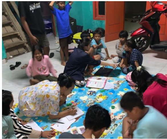
Gambar 2. 5 Bimbel Siswa Siswa SD

Kegiatan bimbel atau les yang kami lakukan selama kegiatan PKPM ini berfokus pada anak-anak yang masih duduk di bangku SD. Pada bimbel ini kami mengajarkan mata pelajaran Matematika, Bahasa Inggris dan kami juga membantu anak-anak untuk mengerjakan PR yang diberikan gurunya di sekolah. Adapun kegiatan bimbel dapat dilihat pada gambar 2.5.