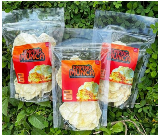
Gambar 2. 9 Kemasan Emping Munca

Membantu pemilik UMKM emping munca membuat kemasan hal ini kami lakukan karena emping munca belum memiliki kemasan yang layak, seperti yang kita ketahui kemasan menjadi faktor penting bagi sebuah produk. Adapun hasil pembuatan kemasan emping munca dapat dilihat pada gambar 2.9