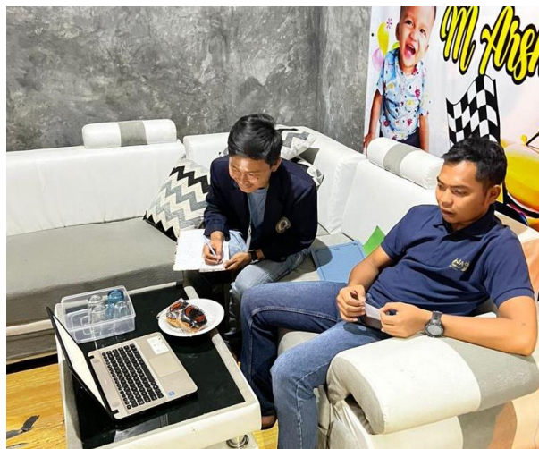
Gambar 2. 1 Mengenalkan Simonik ke UMKM

Simonik merupakan marketplace yang dapat digunakan oleh UMKM sebagai tempat untuk berjualan secara online melalui aplikasi berbasis web yang dapat menjangkau lebih banyak konsumen. Dengan mengenalkan Simonik diharapkan bisa meningkatkan kesadaran pemilik UMKM untuk memanfaatkan perkembangan teknologi di era digitalisasi yang sangat berperan penting bagi jalannya sebuah bisnis, serta diharapkan bisa membantu Usaha Mikro Kecil Menengah (UMKM) Keripik Arsha mempromosikan dan memasarkan hasil produksinya secara online untuk mengembangkan usahanya. Adapun dokumentasi dari proses mengenalkan Simonik dapat dilihat pada gambar 2.1