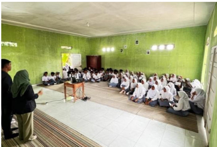
Gambar 2. 3 kegiatan sosialisasi ke MA Al-Falah Munca

mengetahui cara mencegah kenakalan remaja, tidak terjerumus, serta yang paling utama membentuk dan melahirkan remaja yang sehat mental. Adapun kegiatan sosialisasi ke MA Al-Falah dapat dilihat pada gambar 2.3