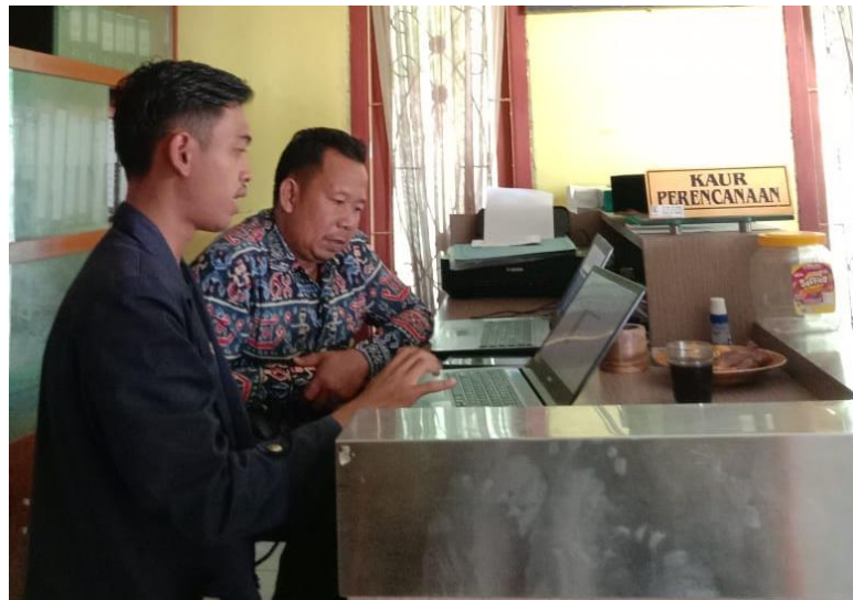
Gambar 2.3. 1 Menjelaskan isi dari User Manual Web Desa.