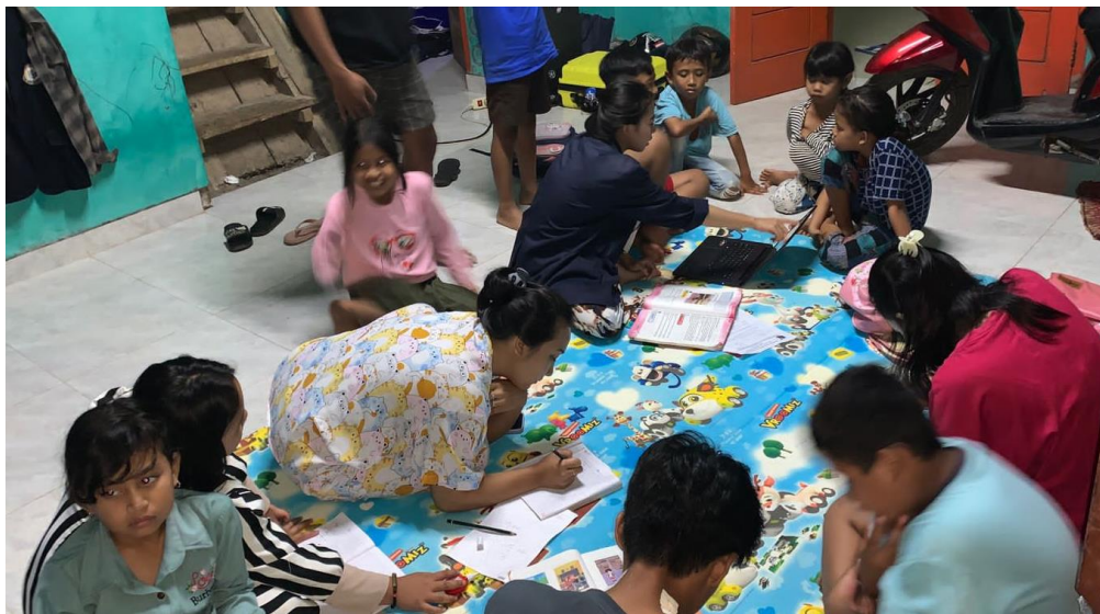
Gambar 2.3. 5 Belajar Bersama Anak-Anak yang Berada di Sekitar Posko.