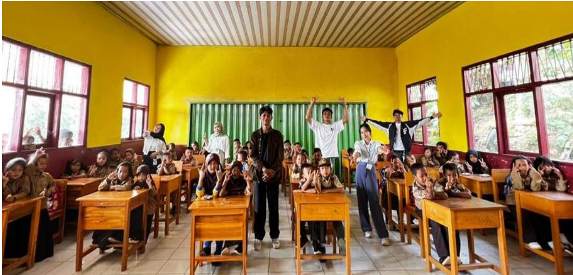
Gambar 2.3. 4 Sosialisasi ke SDN 09 Teluk Pandan.