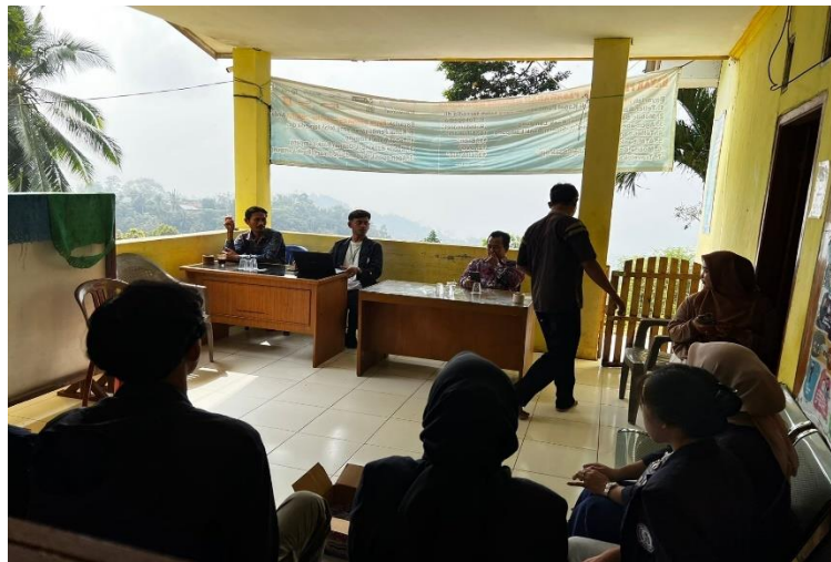
Gambar 2.3. 3 Sosialisasi Mengenai Manfaat User Manual.