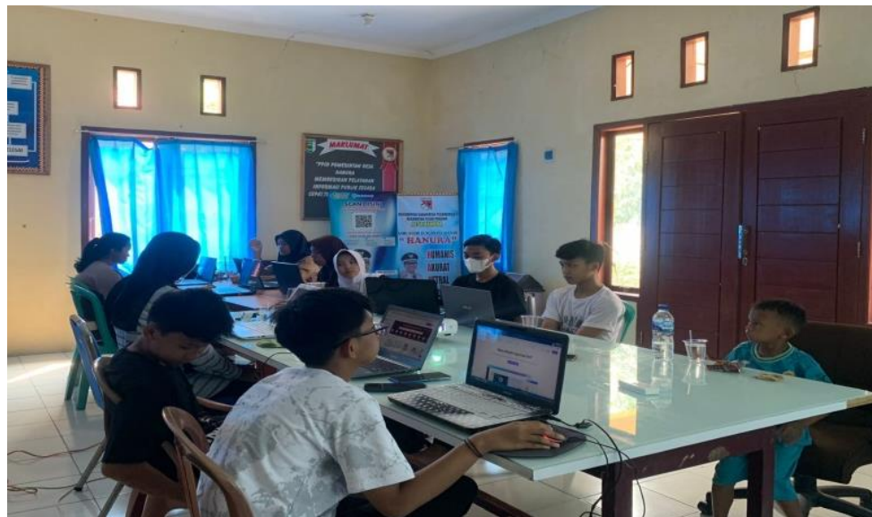
Gambar 2.3 Kegiatan Poses Belajar

Berdasarkan kegiatan yang telah dilaksanakan, dapat menghasilkan sebuah pemanfaatan teknologi untuk anak – anak Desa Hanura, dengan adanya kegiatan belajar ini anak – anak Desa Hanura dapat mengetahui aplikasi – aplikasi yang dapat digunakan untuk meningkatkan skill, kreatifitas, dan inovasi mereka.