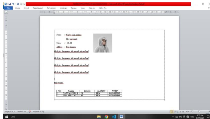
Gambar 2.3.1 Hasil Pembelajaran Materi MS. Office

Dengan adanya pembelajaran aplikasi MS. Word ini anak – anak desa Hanura dapat memahami fungsi - fungsi yang ada pada Microsoft Word seperti membuka dan menutup dokumen word. Menggunakan perintah dasar seperti Menyalin (Copy), Memotong (Cut), Menyisipkan (Paste), dan Mencetak (Print). Mampu mengganti format teks seperti ukuran font, jenis huruf, warna teks, dan penomoran. Menambahkan efek seperti cetak tebal, miring, dan garis bawah. Mengatur paragraf dan spasi. Menyimpan dan mengelola dokumen dengan baik, termasuk memberi nama file dan mengatur folder.