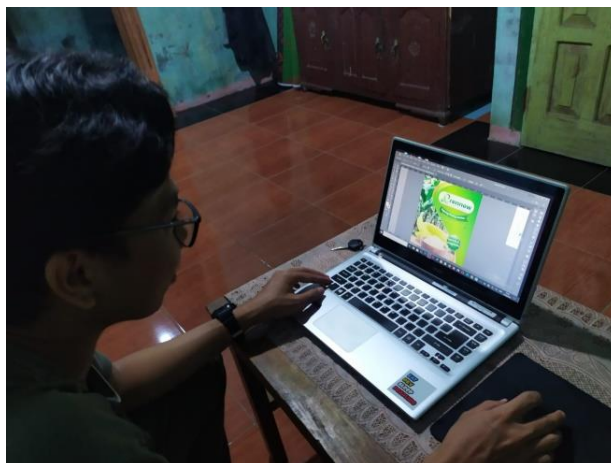
Gambar 2.4 Perancangan Desain Label Kemasan UMKM