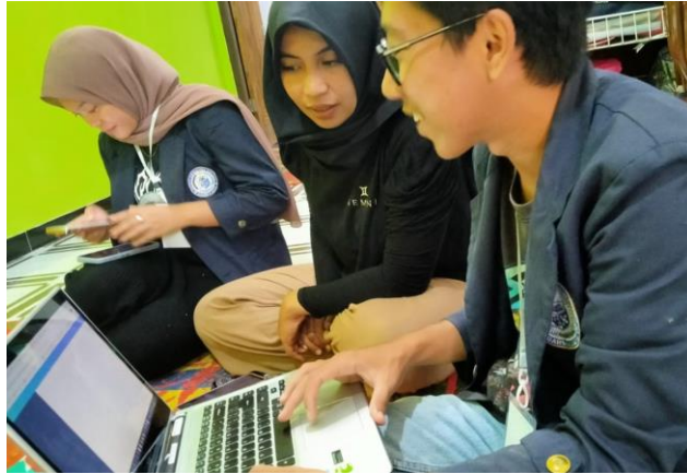
Gambar 2.12 Pelatihan Terkait Pemasangan Foto Produk Kepada Pemilik UMKM