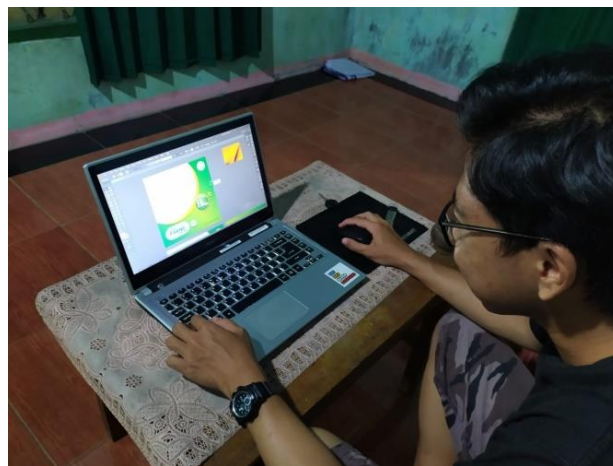
Gambar 2.7 Perancangan Desain Feed Instagram UMKM

Membantu dalam perancangan desain feed media sosial instagram UMKM yang bertujuan untuk memberikan seputar informasi pada penjualan produk yang dimulai dari harga, foto produk, jenis produk dan berat produk. Kegiatan ini dilaksanakan pada Minggu, 20 Agustus 2023, dapat dilihat pada gambar 2.7 dan 2.8.