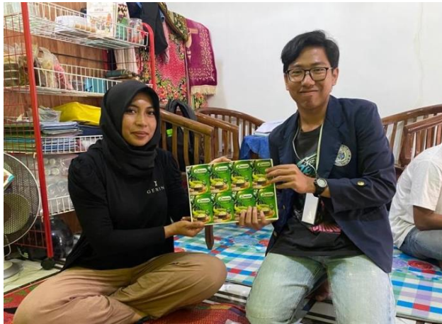
Gambar 2.6 Penyerahan Desain Label Kemasan UMKM