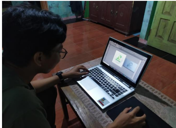
Gambar 2.2 Perancangan Desain Logo UMKM