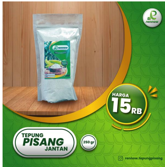
Gambar 2.8 Hasil Perancangan Desain Feed IG UMKM