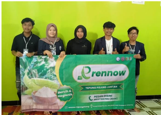
Gambar 2.11 Penyerahan Banner Sekaligus Foto Bersama Dengan Pemilik UMKM