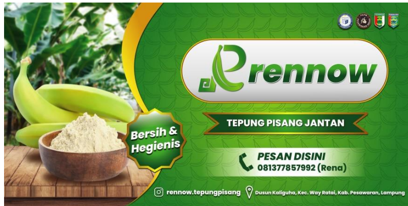
Gambar 2.10 Hasil Perancangan Desain Banner UMKM