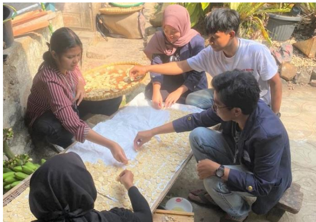
Gambar 2.13 Membantu Proses Produksi Tepung Pisang

Membantu dalam kegiatan proses pembuatan tepung pisang terutama penyusunan pisang pada nampan dan penjemuran pisang bersama anggota kelompok. Kegiatan ini dilaksanakan pada Selasa, 28 Agustus 2023, dapat dilihat pada gambar 2.12.