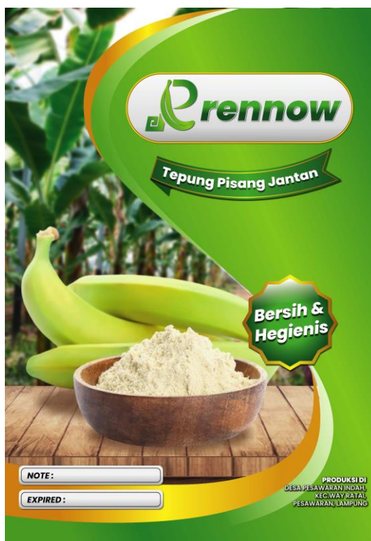
Gambar 2.5 Hasil Perancangan Desain Label Kemasan UMKM