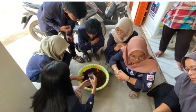
Gambar 2.5 Mengemas kopi ke dalam kemasannya