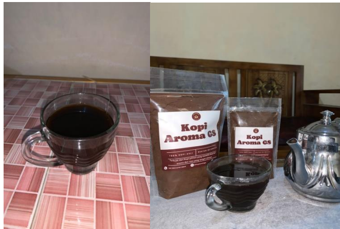
Gambar 2.12 hasil kegiatan (UMKM Kopi Aroma GS)

Berikut hasil dokumentasi dari UMKM Kopi Aroma GS