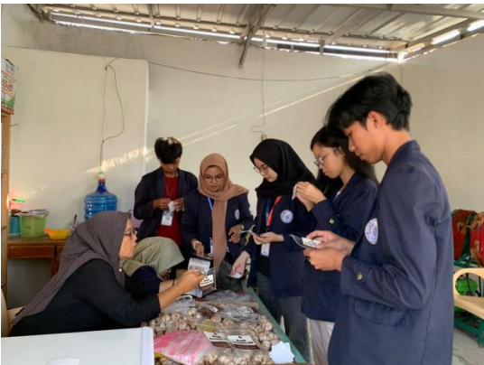
Gambar 2.6 Berbincang dan menanyakan terkait produksian nya