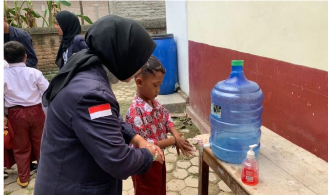
Gambar 2.10 sosialisasi mengajari anak SD N 2 Gunung Sari mencuci tangan