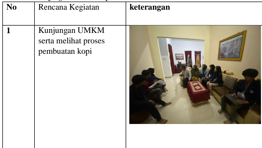
Table 2.1 Kunjungan UMKM Kopi Aroma GS