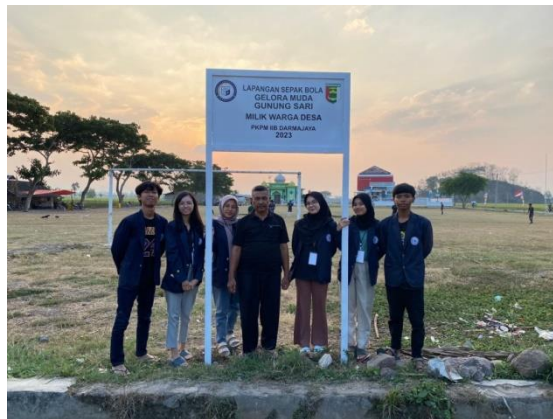
Gambar 2.8 Pemasangan plang lapangan Gunung Sari