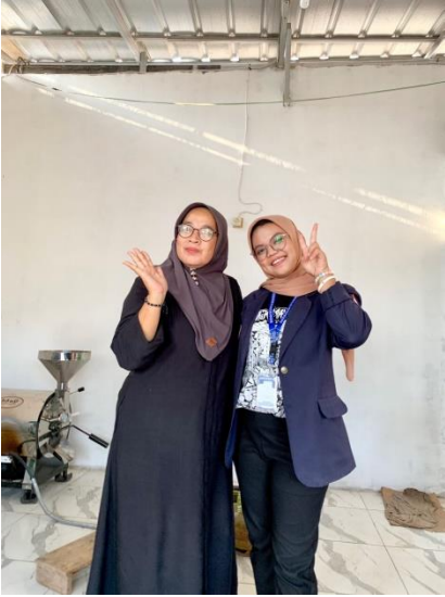
Gambar 2.4 bersama ibu pemilik UMKM Kopi Aroma GS