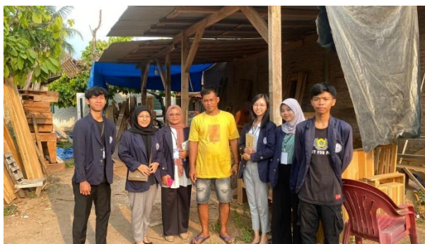
Gambar 2.9 Bersama pemilik UMKM Mebel pepi