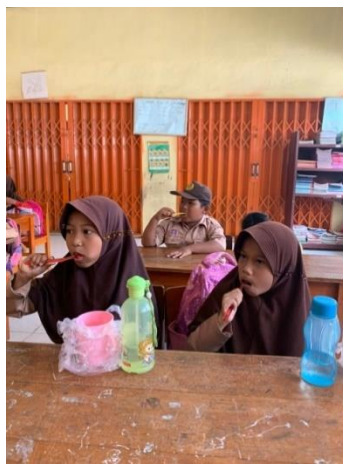
Gambar 2.11 sosialisasi mengajari anak SD N 2 Gunung Sari menyikat gigi