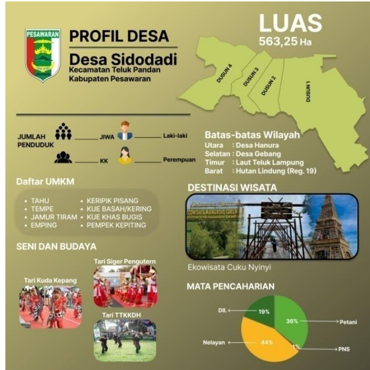
Gambar 1.1 Profil Desa