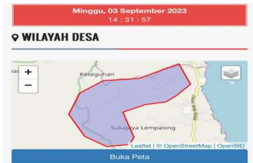
Gambar 1.1 lokasi desa munca