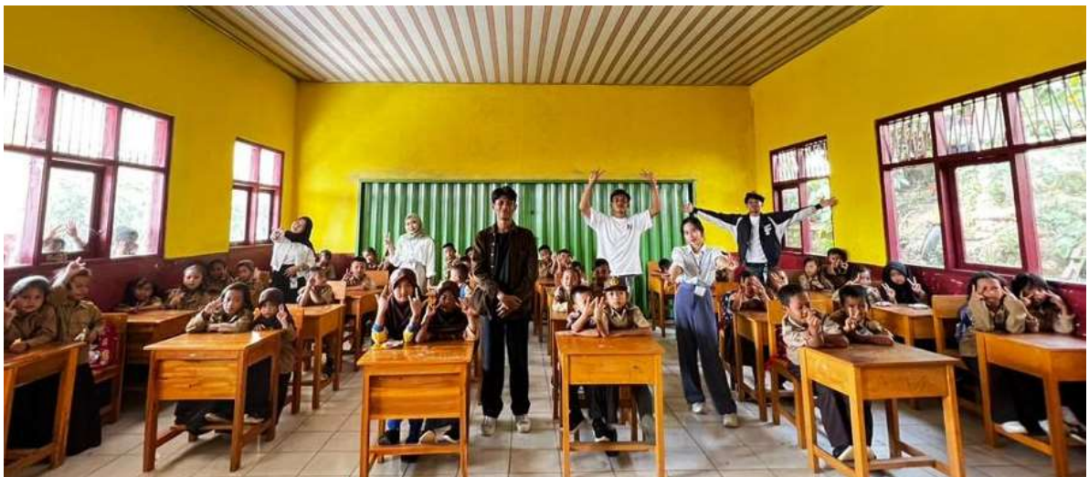
Gambar 2.6 Sosialisasi Ke SDN 9 Teluk Pandan