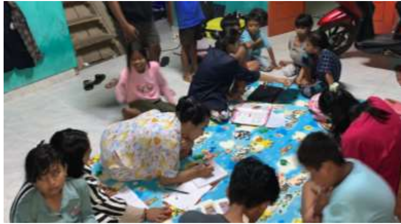
Gambar 2.7 Mengajar Les