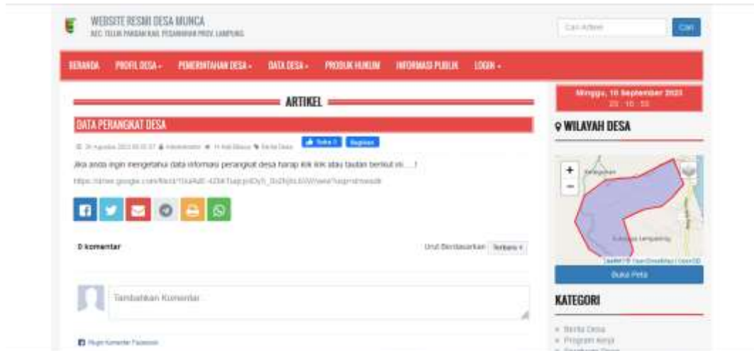
Gambar 2.3 Hasil Paperless Office