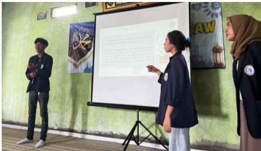
Gambar 2.4 Sosialisasi Paperless Office