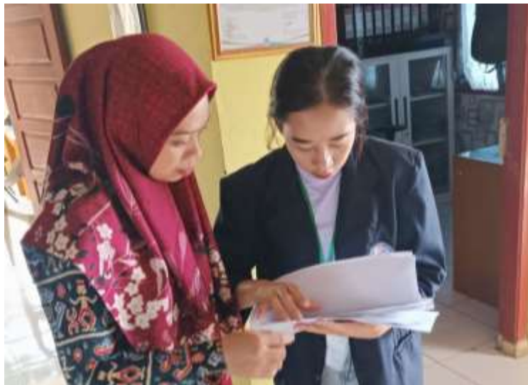
Gambar 2.1 Penyerahan Data Desa Munca