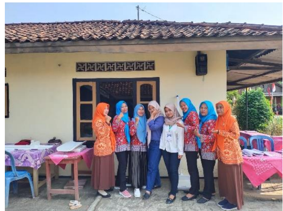
Membantu dalam kegiatan posyandu di dusun Umbul Rejo