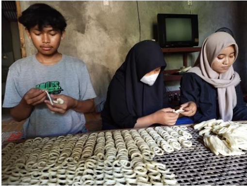
Membantu proses produksi pembuatan klanjing