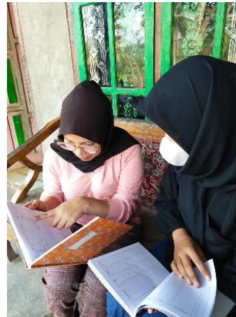
Sosialisasi pencatatan keuangan pada buku kas