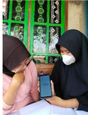
Sosialisasi pencatatan keuangan melalui digital