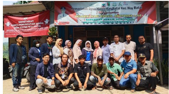
Pelepasan PKPM pada aparatur desa