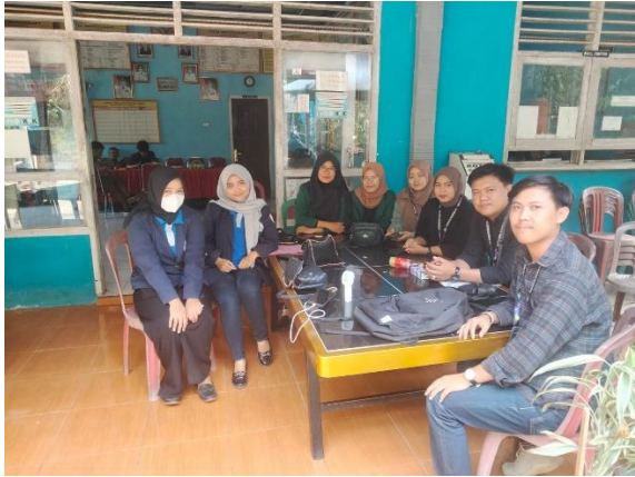
Berpartisipasi di Balai Desa Wates Way Ratai