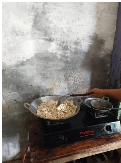
Membantu proses produksi pembuatan basreng