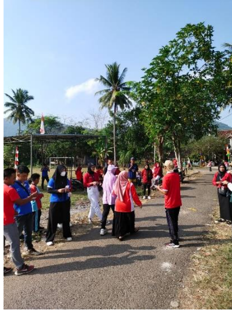
Berpartisipasi dalam kegiatan 17 agustus