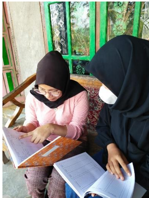
Gambar 2.2 Menjelaskan buku kas pada UMKM Selo Bites