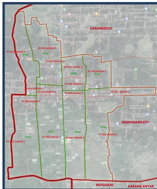
Gambar 1.1 Peta Desa Purworejo