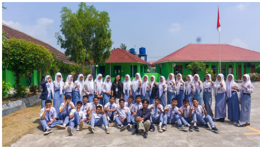
Gambar 2.5 Kegiatan Sosialisasi di SMKN 1 Negeri Katon