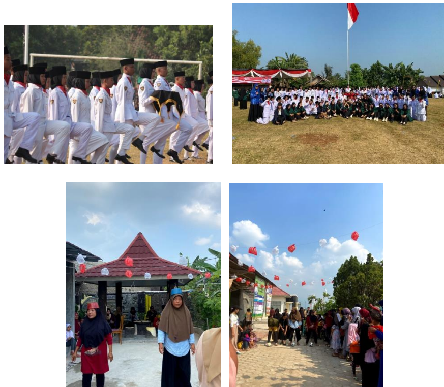
Gambar 2.1 Upacara HUT-RI Ke-78 dan Lomba Tujuh Belasan