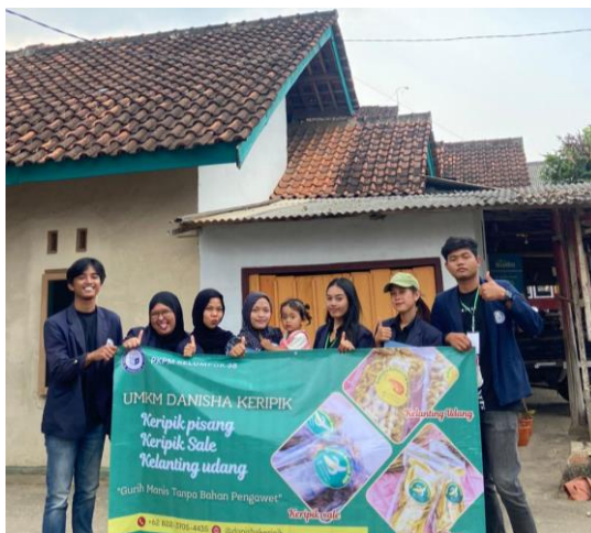
Gambar 2.11 Foto Produk Danisha Keripik dan Pemberian Banner UMKM Danisha Keripik