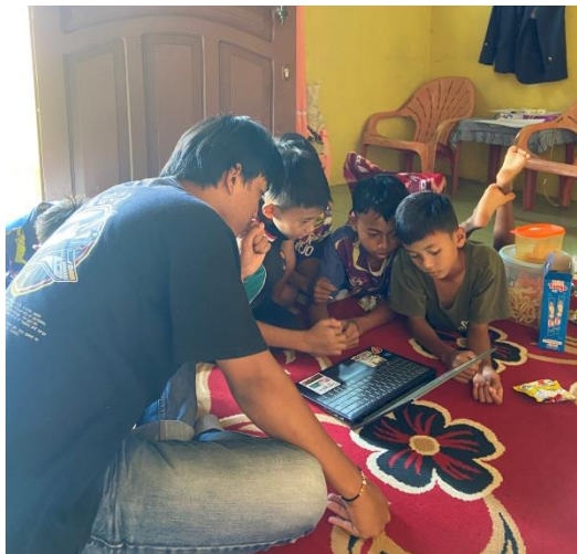
Gambar 2.4 Kegiatan Belajar Bersama Anak-Anak