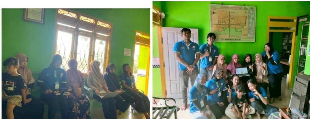
Gambar 2.12 Pelatihan SiMoniK bersama pemilik UMKM dan BUMDes

SiMoniK merupakan aplikasi yang dapat digunakan oleh pemilik UMKM untuk menjual produknya sekaligus melakukan proses monitoring terhadap produk yang dijual di SiMoniK. Dengan pelatihan ini, BUMDes pun ikut bersama untuk belajar cara penggunaan SiMoniK agar kedepannya BUMDes bisa membantu pemilik UMKM.