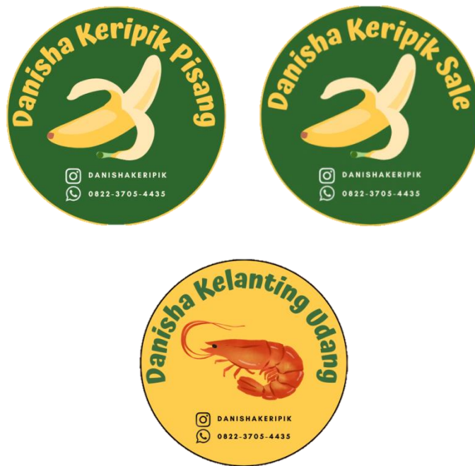
Gambar 2.1 Tampilan Logo UMKM Danisha Keripik