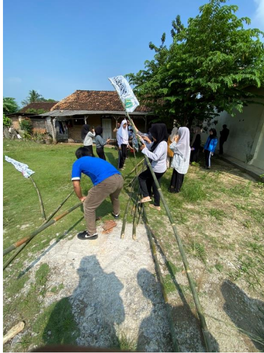
Gambar 2.7 Pemasangan Umbul-Umbul