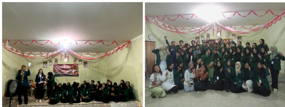
Gambar 2.2 Malam Puncak HUT-RI Ke-78 dan Perpisahan Mahasiswa KKN UIN Raden Intan Lampung