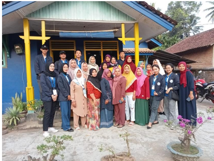
Gambar 2. 1 UMKM Edelweis

Selama PKPM berlangsung saya mengamati proses pembuatan keripik talas dari tahap awal hingga dengan tahap akhir dan juga membantu pembuatan akun aplikasi simonik terhadap UMKM Edelweis.