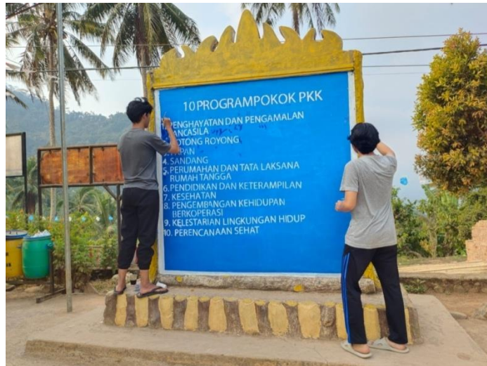
Gambar 2. 8 Pengecatan Program Pokok PKK