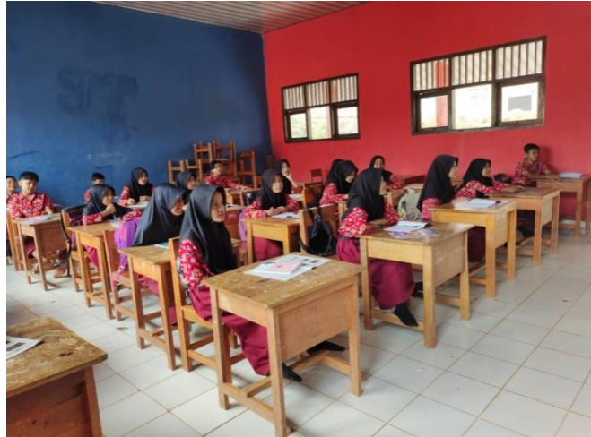
Gambar 2. 4 SMPN Satu Atap 4 Pesawaran