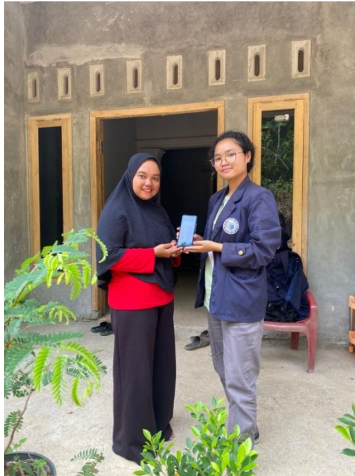
Gambar 2. 2 Penyerahan Akun Simonik