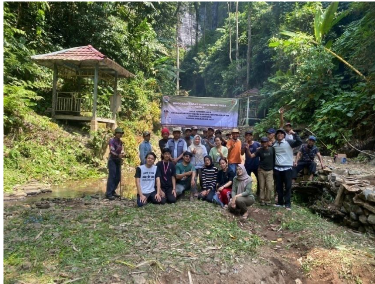
Gambar 2. 6 Dokumentasi Gotong Royong