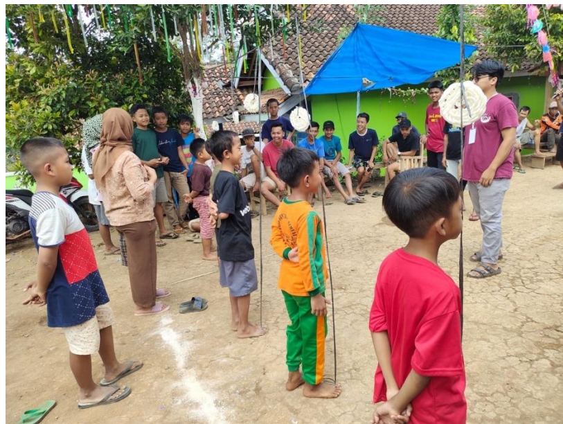
Gambar 2. 9 Kegiatan Lomba 17 an

Membantu mempersiapkan lomba-lomba di kegiatan 17 an untuk anak-anak beserta dengan pemuda-pemudi di Desa Sumber Jaya.