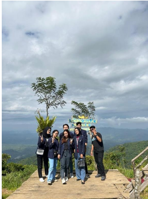
Gambar 2. 10 Wisata Bukit Kendeng