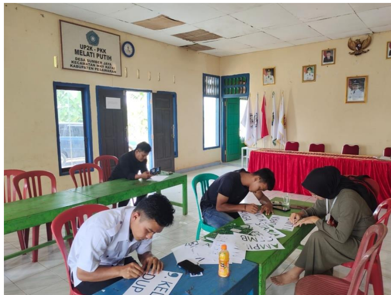
Gambar 2. 7 Dokumentasi Pemotongan Kertas

Kegiatan membantu pemotongan kertas tentang program pokok PKK yang dibantu oleh aparat desa.