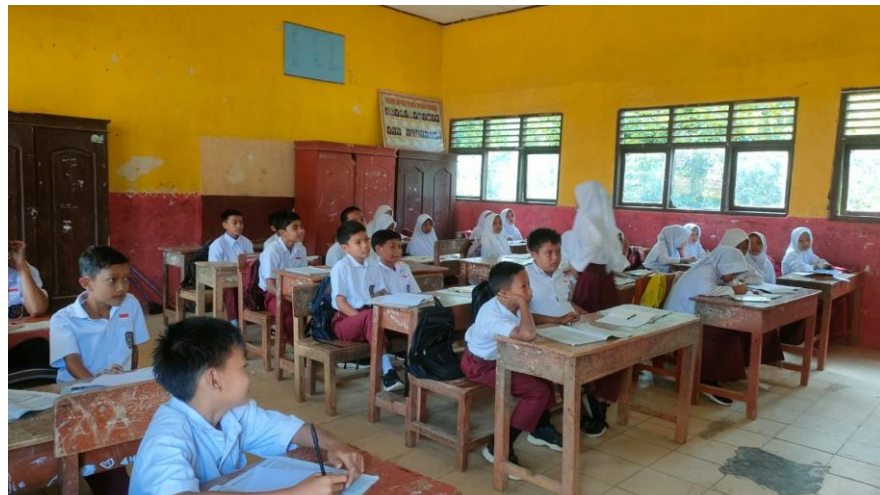
Gambar 2. 3 SDN 13 Sumber Jaya

Mengikuti kegiatan proses belajar mengajar di Sekolah Desa Sumber Jaya yakni SDN 13 Sumber Jaya dan SMPN Satu Atap 4 Pesawaran.