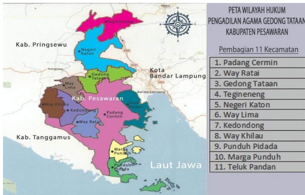
Gambar 1 Peta Kabupaten Pesawaran

Desa Mada Jaya terdiri dari Sembilan Dusun yaitu Dusun I Mada Ilir 01, Dusun II Mada Ilir 02, Dusun III Umbul Baru, Dusun IV Mada Tengah, Dusun Mada V Repong Kadu, Dusun VI Kampung Masjid, Dusun VII Kembang Tanjung, Dusun VIII Kebon Pisang, Dusun IX Bontor. Sebagian besar penduduk Desa Mada Jaya berasal dari Jawa Tengah atau Pendetang suku Sunda, sebagian lagi merupakan suku Lampung, dan Jawa. Bahasa sehari-hari yang digunakan mayoritas menggunakan Bahasa Sunda