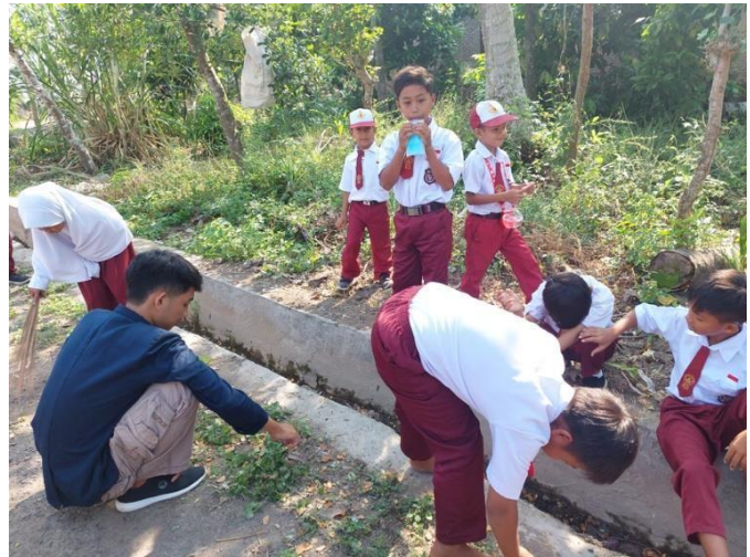
Gambar 24 Bergotong royong di SDN 9 Way Khilau