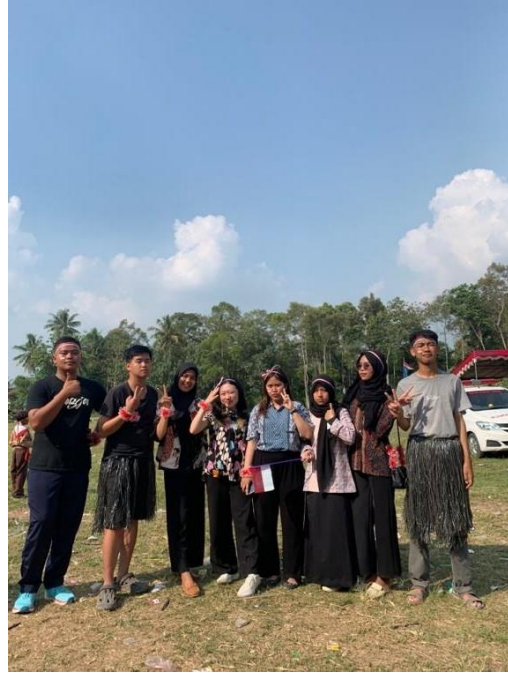
Gambar 9. Perayaan Hut RI ke 78 di Desa Mada Jaya