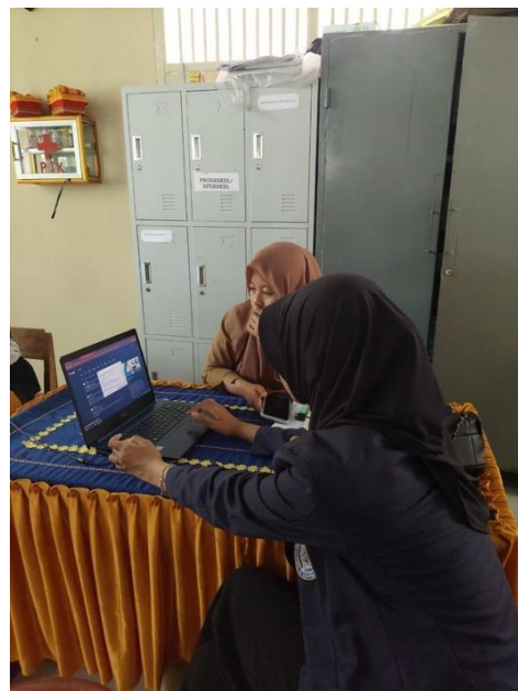
Gambar 18 Sosialisasi Mengenai Paperless di Balai Desa Mada Jaya