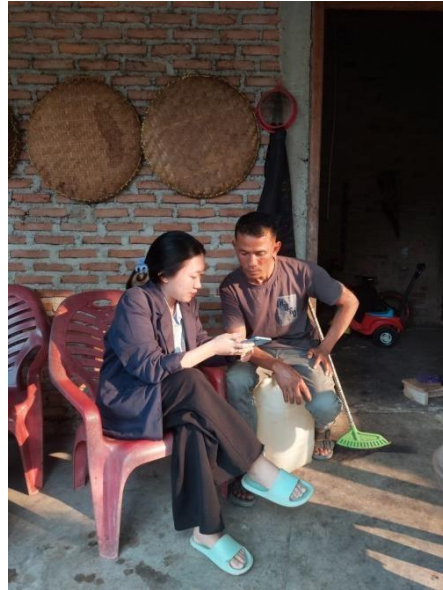
Gambar 4. Sosialisasi Penggunaan Aplikasi Buku Kas