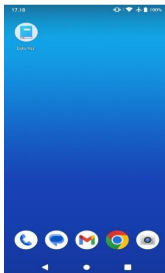
Gambar 5. Tampilan Buku Kas pada home menu