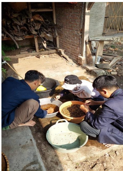
Gambar 13 Proses Pembuatan Kopi Bubuk JM