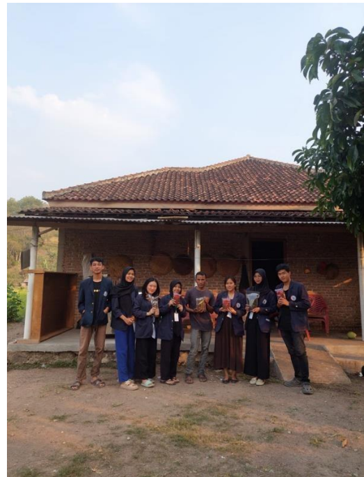
Gambar 12. Pengenalan kepada pihak UMKM Kopi Bubuk JM dan Jamur Berkah Jaya