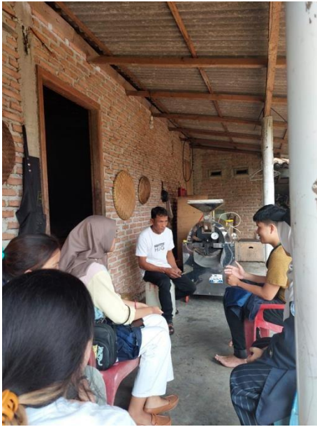
Gambar 27 Pengenalan Kopi Bubuk JM