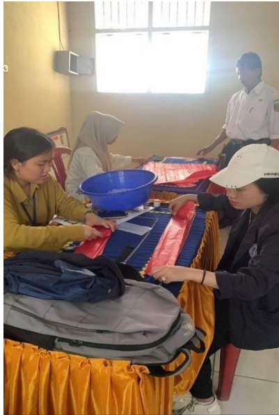
Gambar 15 Membantu Persiapan Hut RI Desa Mada Jaya