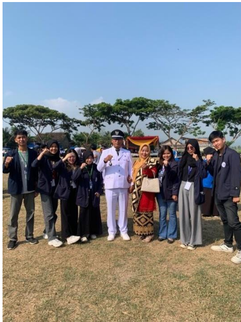
Gambar 21 Upacara 17 Agustus di Lapangan Desa Gunung Sari