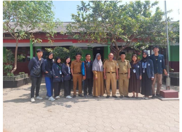
Gambar 11. Sosialisasi di SDN 9 Way Khilau Kabupaten Pesawaran