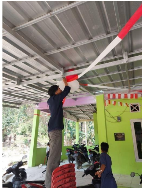
Gambar 16 Membantu Persiapan Hut RI Desa Mada Jaya