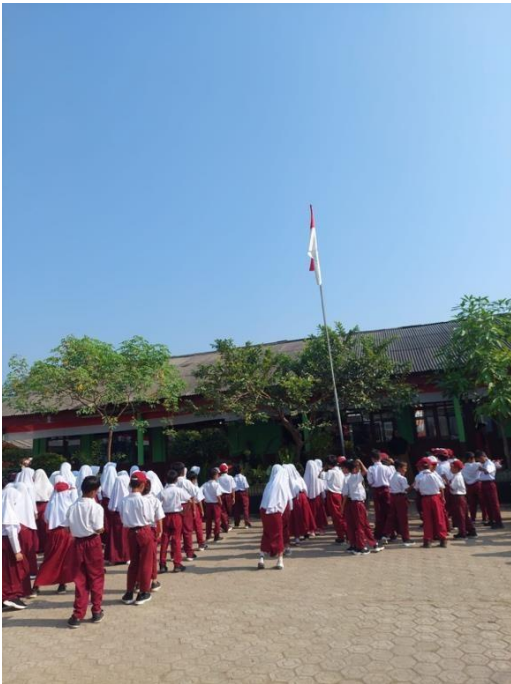
Gambar 23 Mengikuti Upacara di SDN 9 Way Khilau