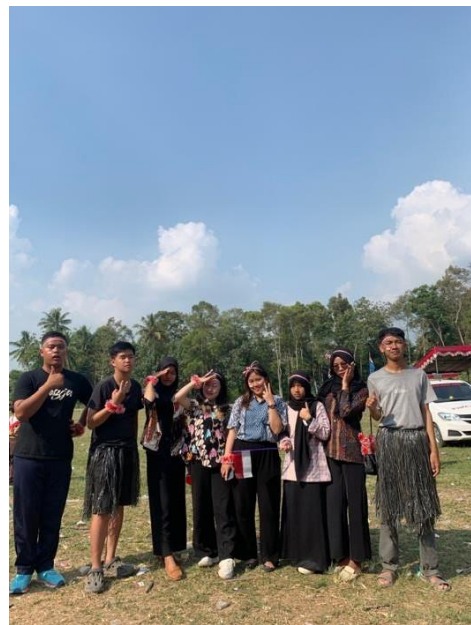
Gambar 22 Mengikuti Karnaval di Desa Mada