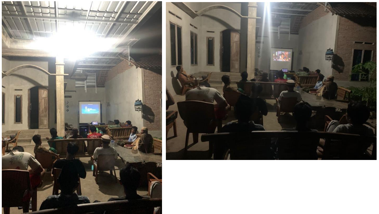
Gambar 31 Mengadakan Nonton Bola Bersama Masyarakat dan Aparat Desa Mada Jaya