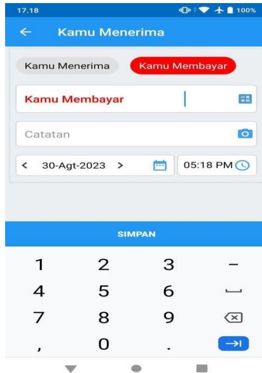
Gambar 8. Tampilan halaman pengeluaran kas pada Buku Kas