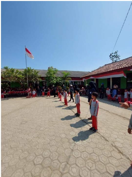
Gambar 29 Panitia 17 Agustus di SDN 9 WayKhilau