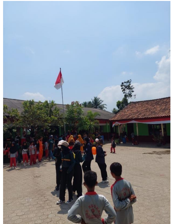
Gambar 30 Mengikuti lomba 17 agustus