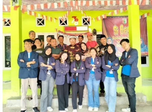
Gambar 20 Perpisahan Bersama Aparat Desa Mada Jaya