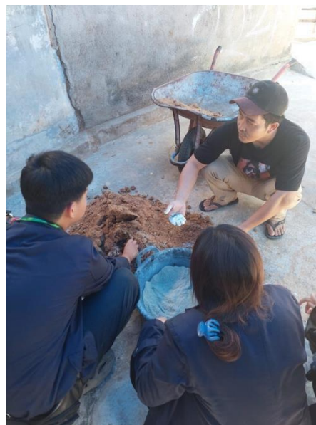
Gambar 14 Proses Pembuatan Jamur Tiram