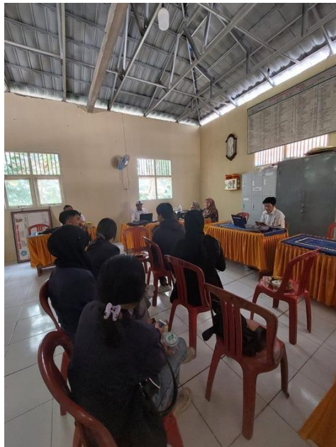
Gambar 17 Survei Tempat PKPM Desa Mada Jaya