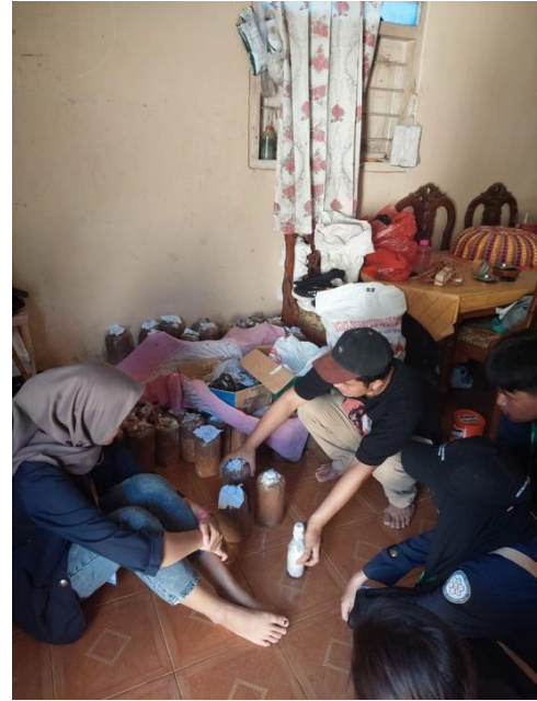
Gambar 28 Proses Pembuatan Jamur