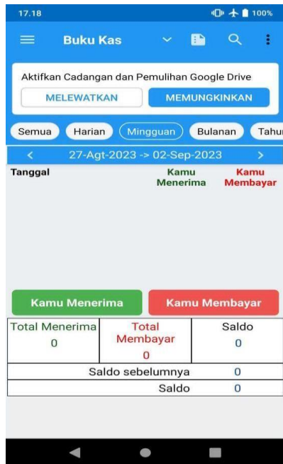
Gambar 6. Tampilan awal aplikasi Buku Kas