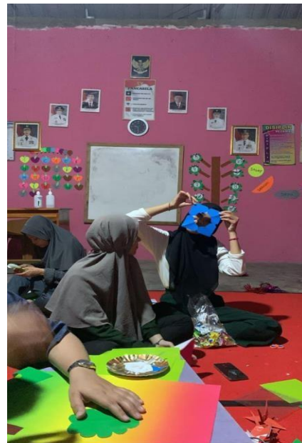
Gambar 10. Membantu Menghias Balai Desa dan Paud di Desa Mada Jaya