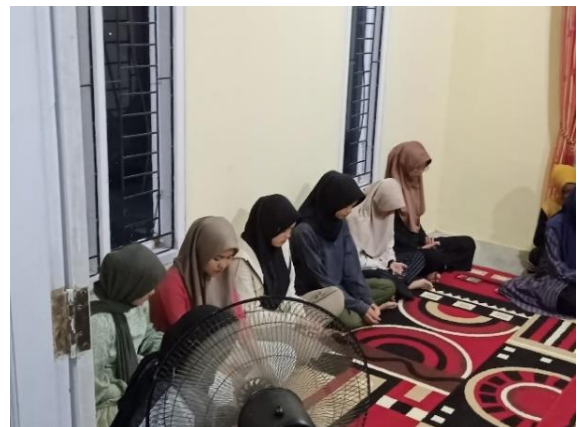
Pengajian Bersama Mahasiswa IAIN Metro