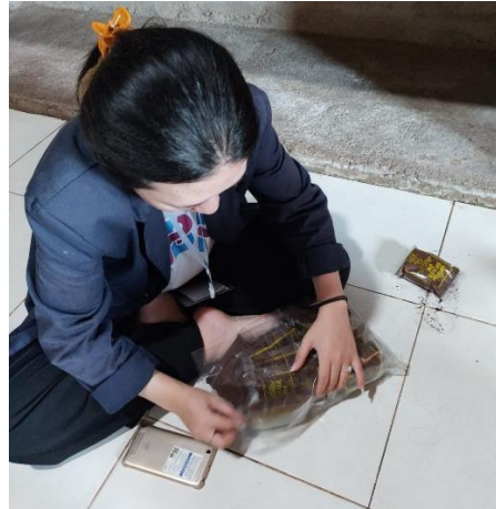
Produksi UMKM Kopi Bubuk JM