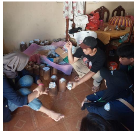
Kunjungan ke UMKM Jamur Tiram