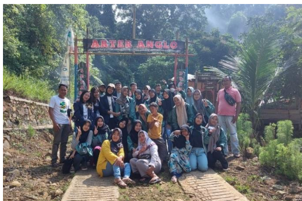
Kunjungan ke air terjun anglo di Padang Cermin, Pesawaran