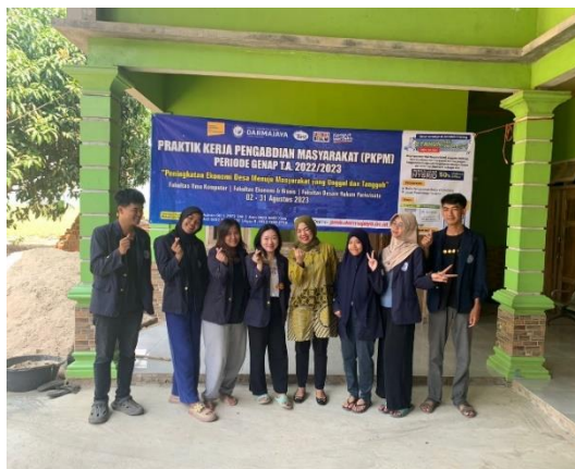
Kunjungan DPL ke Desa Mada Jaya