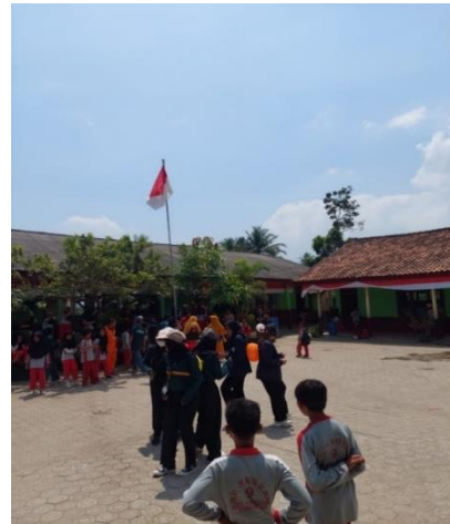
Mengikuti Lomba HUT RI ke-78 di SDN 9 Way Khilau