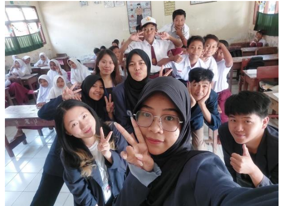
Perpisahan Bersama Bapak Ibu Kades Mada Jaya dan dengan siswa SDN 9 Way Khilau