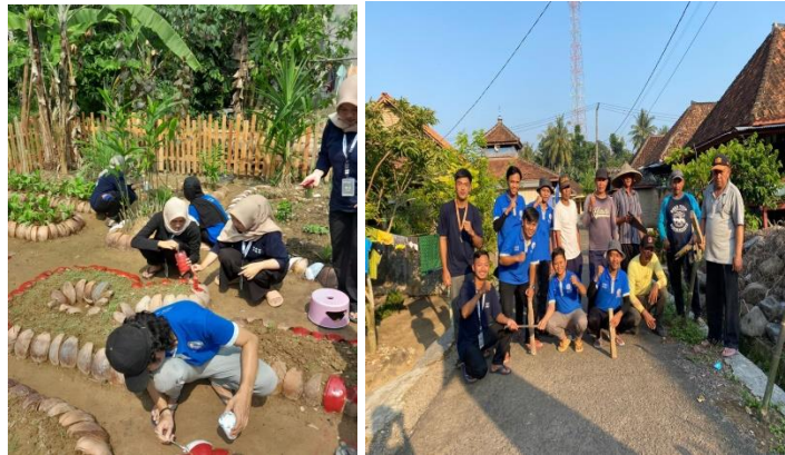
Gambar 2. 3.3.1 Gotong Royong di Kebun Toga

Dalam rangka lomba toga tingkat kecamatan yang diikuti oleh seluruh desa yang ada di Kecamatan Marga Punduh , Kabupaten Pesawaran . Kami membantu kegiatan gotong royong untuk membersihkan dan mempersiapkan plang nama tanaman di kebun tanaman obat keluarga di Desa Sukajaya yang berada di dusun Pematang Awi 1. Kegiatan gotong royong berlangsung sampai siang hari lalu di lanjutkan dengan persiapan lomba hingga sore hari.