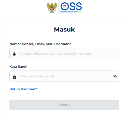
Gambar 2. 3 Login pada akun UMKM