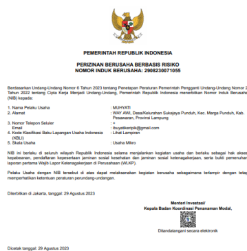
Gambar 2. 4 Nomor NIB yang Telah Terdaftar