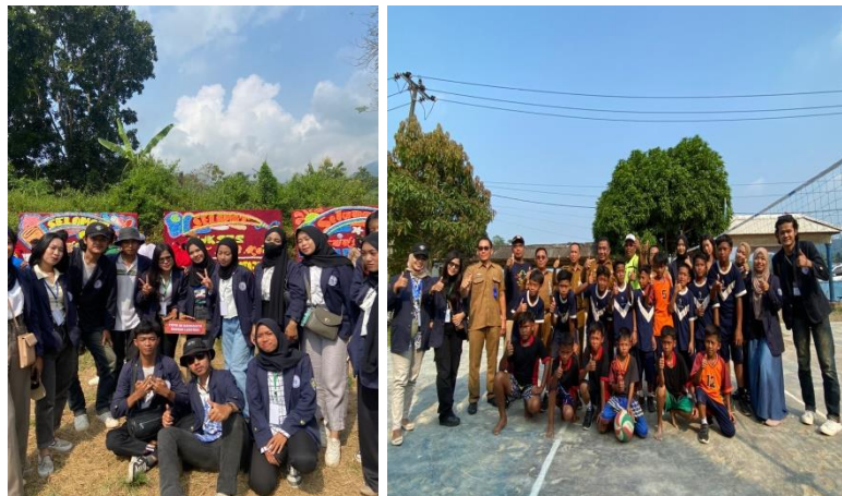
Gambar 2. 3.3.2 Upacara Peringatan HUT RI dan perlombaan di SDN 2 Marga Punduh

Pada pelaksanaan PKPM Kali ini bertepatan dengan hari Kemerdekaan Indonesia yang selalu diperingati setiap tahunnya pada tanggal 17 Agustus. Seluruh warga di Desa Sukajaya menyambut dan memeriahkan hari tersebut. Kami ikut serta dalam seluruh kegiatan desa selama hari kemerdekaan. Seperti membantu latihan paskibra desa, membantu pengawasan penampilan siswa siswi SDN 2 Marga Punduh dalam rangka memeriahkan kemerdekaan Indonesia, menjadi paduan suara bersama ibu-ibu di desa, menjadi panitia lomba di desa dan dusun Giri Rejo, Serta mengadakan acara perayaan kemerdekaan setelah upacara pengibaran bendera dilakukan. Lomba yang kami selenggarakan dikhususkan untuk anak-anak dan bapak-bapak yang berdomisili di Desa Sukajaya.