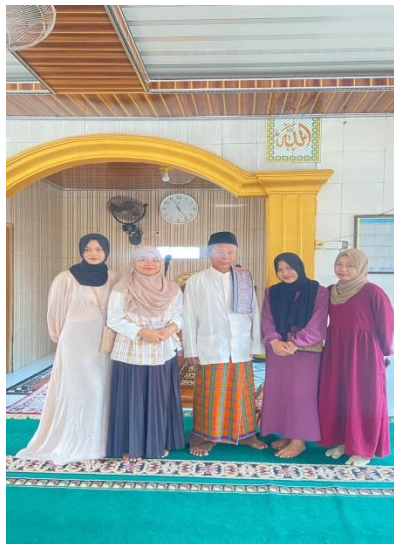
Gambar 2. 3.3.3 Pengajian Rutin

Pengajian rutin yang dilaksanakan didesa Sukajaya yakni dilaksanakan setiap malam jumat untuk di dusun Way Awi, dan setiap hari sabtu pengajian di laksanakan di dusun Sukajaya Induk 1. Untuk hal tersebut kami aktif mengikuti kegiatan rutin pengajian guna untuk mempertambah pengetahuan tentang agama dan dalam mempererat tali silahturahmi terhadap warga desa Sukajaya.