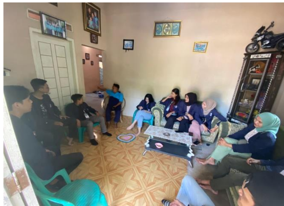
Gambar 2. 3.2 Pelatihan Pembuatan Legalitas Usaha

Pendaftaran NIB (Nomor Induk Berusaha) ini sudah disetujui oleh pemilik UMKM sehingga pembuatan legalitas dapat terselesaikan dengan baik.