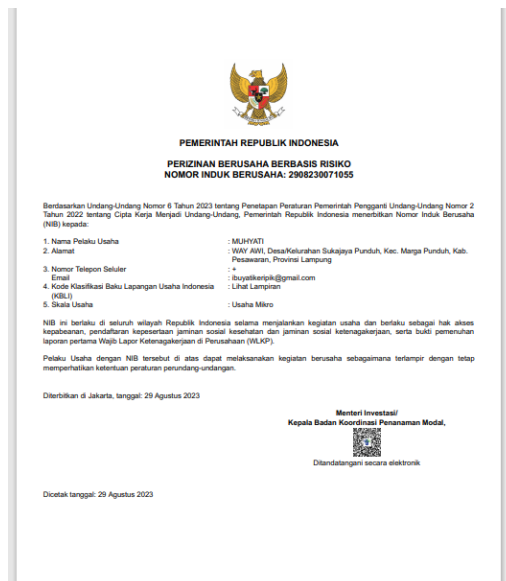
Gambar 2. 3.2 NIB UMKM