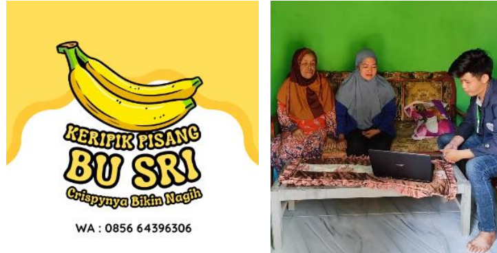
Gambar 2. 1 Pembuatan Branding & Logo Pada UMKM Keripik Pisang 2.3.2 Pembuatan Banner