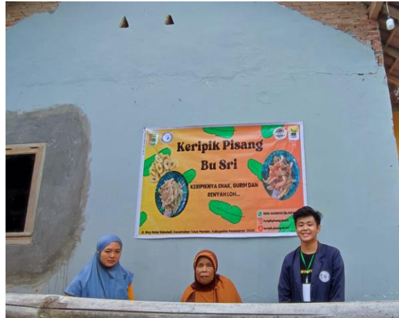
Gambar 2. 2 Pemasangan Banner di Tempat UMKM

percetakan banner. Kemudian setelah banner jadi saya dan Mbah Emi kemudian menentukan tempat yang pas untuk pemasangan banner tersebut. Ketika banner sudah dipasang maka konsumen dapat mudah mengetahui informasi atau mengetahui tempat UMKM tersebut.