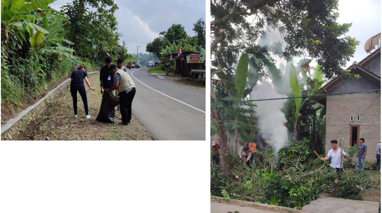
Gambar 2. 7 Melakukan Gotong Royong di Dusun 1 Desa Sidodadi

daun-daun kering yang berserakan hingga pohon yang mengganggu aktivitas di dusun 1.