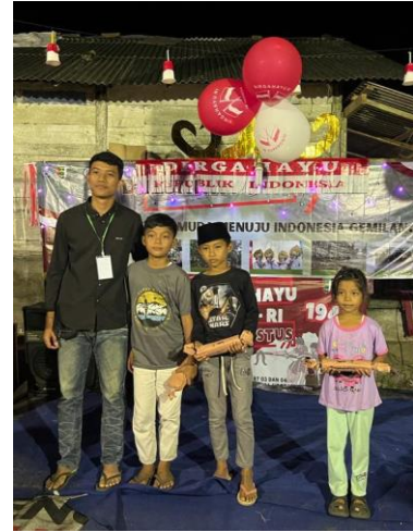
Gambar 2. 8 Melakukan Upacara 17 Agustus dan Pemberian Hadiah Kepada Peserta