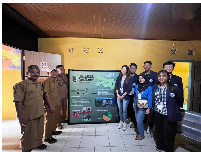
Gambar 2. 4 Gambaran Profil Desa dan Pemasangan Profil Desa di Kantor Balai Desa