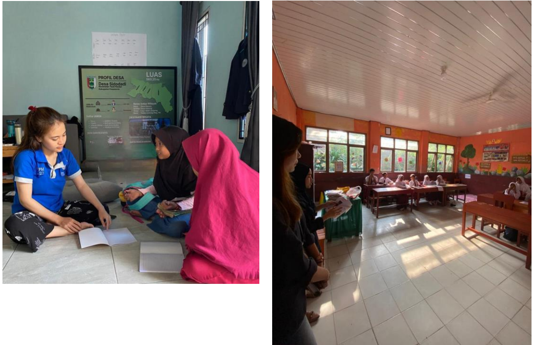
Gambar 2. 6 Melakukan Mengajar di Sd 5 Teluk Pandan dan Posko Darmajaya

Kegiatan ini melakukan bimbingan belajar bersama di posko dan kegiatan juga sudah terlaksana pada setiap hari sabtu pukul 16.00 WIB, mereka yang datang keposko untuk melakukan belajar dan mengerjakan tugas-tugas yang diberikan dari sekolah.