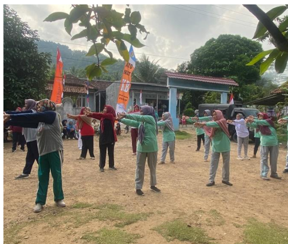
Gambar 2. 5 Melakukan Kegiatan Senam Lansia Bersama Ibu-Ibu di Desa Sidodadi

Kegiatan ini sudah terealisasi dan dilakukan secara rutin setiap hari minggu pada pukul 08.00 WIB. Kegiatan dilakukan untuk mengajak para ibu-ibu desa Sidodadi untuk senam bersama, kegiatan ini juga tidak hanya usia muda tetapi banyak juga yang lanjut usia mengikuti senam ini. Mereka melakukannya dengan senang dan penuh semangat pada saat pagi hari.