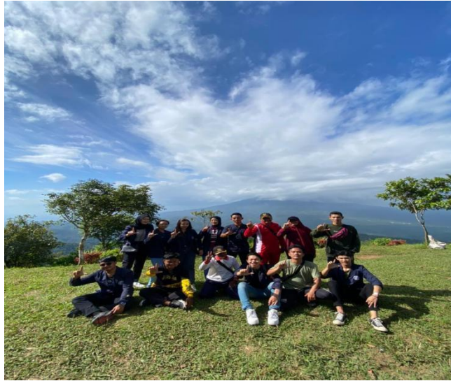
Survei lokasi PKPM