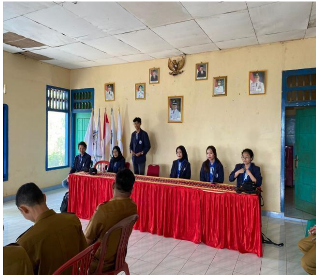
Perkenalan dengan perangkat desa sumber jaya