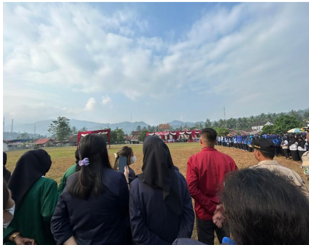
Kegiatan mengikuti upacara 17 agustus dilapangan umbul kluwih