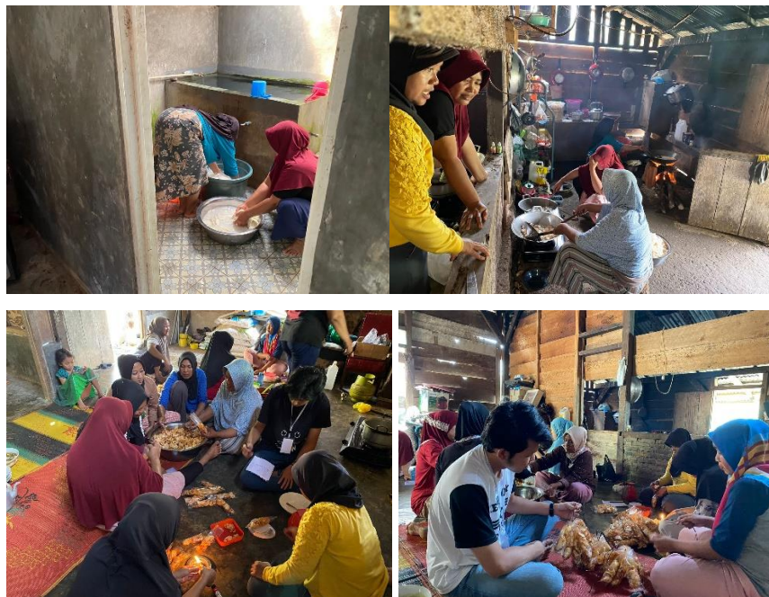
Gambar 2. 6 Proses Pembuatan Keripik Talas

Kami bisa melihat bagaimana kelompok ini secara kreatif mengolah talas, produk pertanian lokal yang kaya nutrisi, menjadi keripik yang lezat dan bernilai ekonomi. Proses ini tidak hanya mencakup pengupasan dan pemotongan talas, tetapi juga tahapan pengolahan, penggorengan, hingga pengepakan.