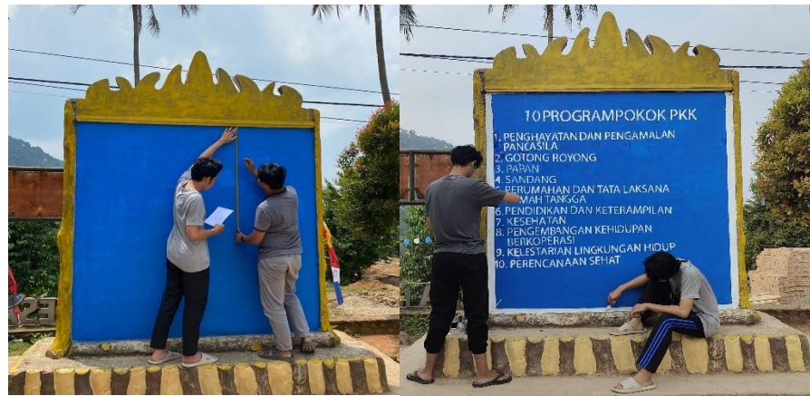
Gambar 2. 7 Kerja Bakti Menulis 10 Program PKK

Kegiatan kerja bakti menulis 10 Program PKK di Kantor Desa Sumber Jaya menjadi langkah awal dalam mewujudkan transparansi dan komunikasi yang lebih baik antara pemerintah desa dan masyarakat. Dengan belum adanya tulisan di tembok balai desa tersebut, kegiatan ini bertujuan untuk memberikan informasi yang jelas dan mudah diakses tentang program-program PKK yang tengah dilaksanakan di desa ini.