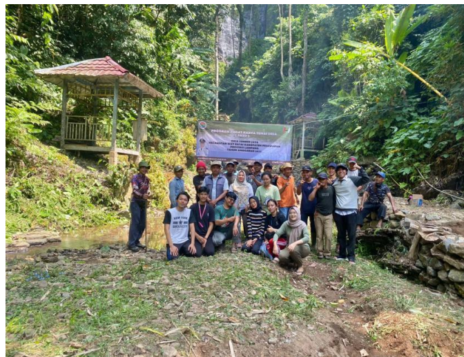
Kegiatan gotong royong air terjun ciupang