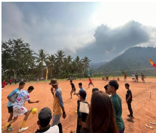
Kegiatan menjadi panitia lomba 17 an di balai desa sumber jaya