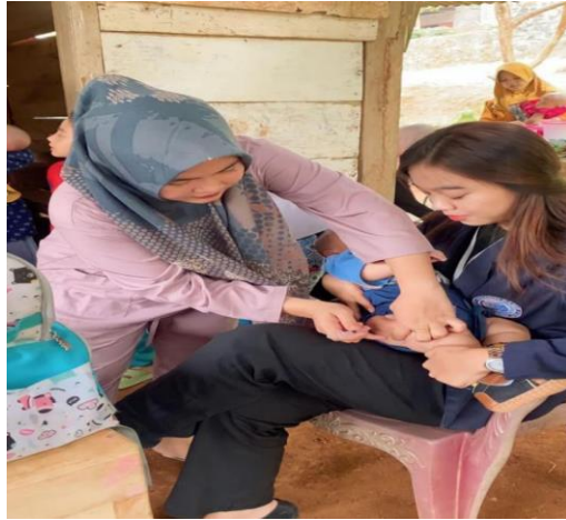
Posyandu rutin balita & lansia di dusun ceringin asri