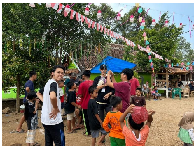
Kegiatan panitia lomba 17 agustus