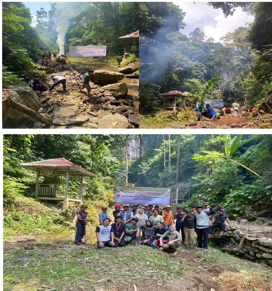
Gambar 2. 4 Kegiatan Gotong Royong Air Terjun Ciupang

Pada tanggal 9 Agustus, sebuah kegiatan gotong royong yang menggugah semangat kebersamaan dan tanggung jawab lingkungan digelar di Desa Sumber Jaya. Acara ini merupakan upaya kolaboratif antara warga desa, pemerintah lokal, dan mahasiswa PKPM untuk membersihkan dan merawat lingkungan sekitar air terjun Ciupang. Air terjun Ciupang, yang menjadi salah satu aset alam yang berharga bagi desa ini, memegang peran penting dalam ekosistem lokal dan juga sebagai objek wisata alam yang menarik. Namun, keberlanjutan keindahan air terjun ini memerlukan perawatan dan pemeliharaan yang teratur.