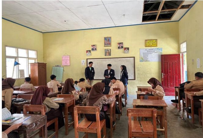
Kegiatan mengajar di SMPN Satu atap 10 pesawaran