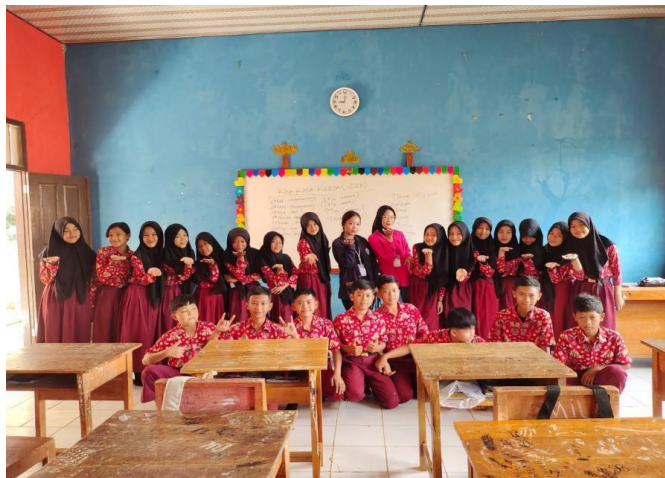
Kegiatan mengajar di SMPN Satu Atap 4 Pesawaran