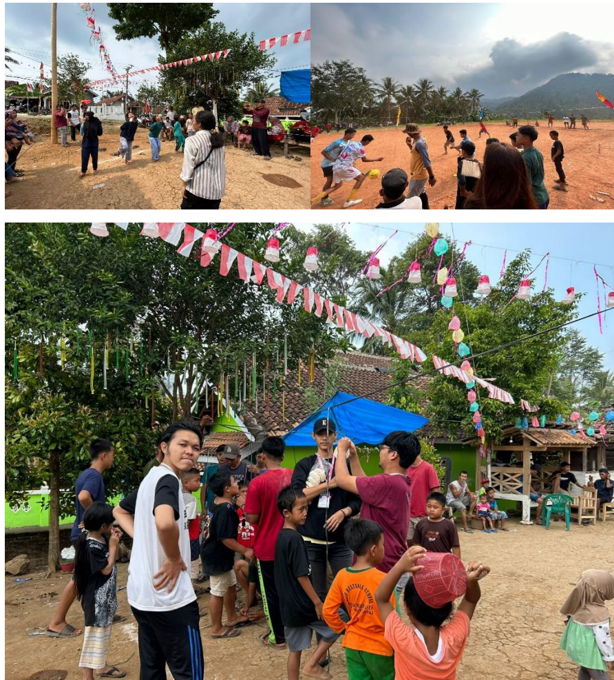
Gambar 2. 5 Kegiatan Panitia Lomba HUT-RI

Lomba ini dilakukan supaya menjadi kesempatan untuk semua masyarakat dapat bersosialisasi dan melatih Kerjasama dengan Karang Taruna Gerakan Pemuda Sejahtera (GPS) maupun Mahasiswa PKPM. Lomba ini dilaksanakan agar memeriahkan HUT-RI yang Ke-78.