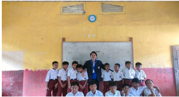
Kegiatan mengajar di SDN 13 Sumber Jaya