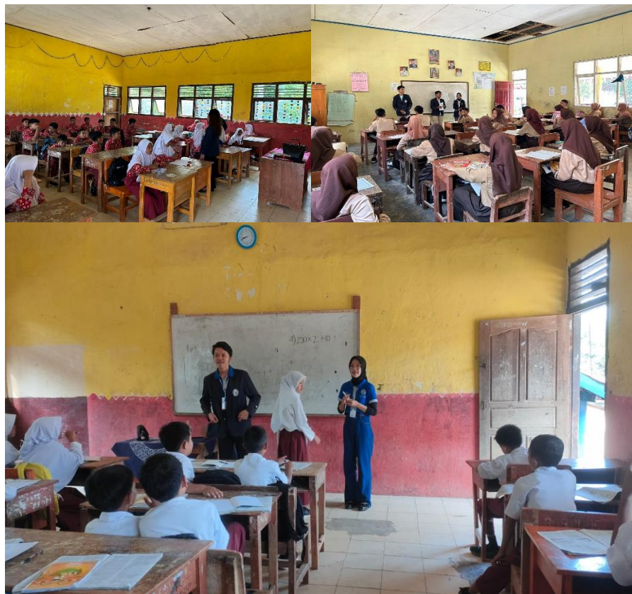
Gambar 2. 3 Mengajar Dan Sosialisasi Mengenai Wajibnya Pendidikan 12 Tahun

Kegiatan mengajar dan sosialisasi mengenai wajibnya belajar 12 tahun di tingkat Sekolah Dasar (SD) dan Sekolah Menengah Pertama (SMP) adalah sebuah upaya proaktif yang bertujuan untuk meningkatkan pemahaman, kesadaran siswa dan siswi tentang pentingnya wajib belajar 12 tahun. Kurangnya minat dari sebagian masyarakat Desa Sumber Jaya untuk melanjutkan pendidikan ke jenjang Sekolah Menengah Atas (SMA) telah menjadi perhatian utama, mengakibatkan tantangan dalam meningkatkan tingkat partisipasi pendidikan tinggi di Desa Sumber Jaya