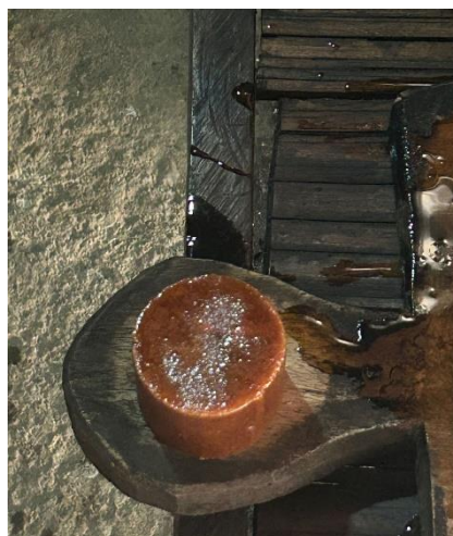
Gambar 2. 2 Pembuatan Gula Aren