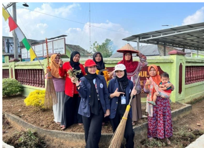
Gambar 2.4 Bakti Sosial di Balai Desa Trimulyo

Melaksanakan kegiatan bersih-bersih di Balai Desa (Bakti Sosial). Kegiatan bakti sosial dilakukan sebagai bentuk persiapan acara HUT R1 ke-78. Kegiatan ini dilaksanakan di Balai Desa Trimulyo dimana akan menjadi tempat acara lomba akan diadakan. Baktisocial ini dilakukan bersama ibu-ibu PKK Desa Trimulyo, yang terdiri dari bersih-bersih lingkungan balai desa, menanam ulanganaman, dan pengecetan pot.