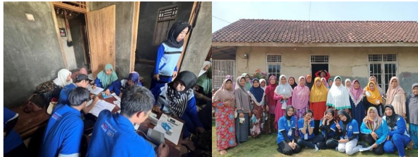
Gambar 2.5 Kunjungan ke Posyandu Lansia

Membantu Ibu-ibu PKK dalam mendata lansia di Dusun Ogan II. Kegiatan posyandu meliputi penimbangan berat badan, pengukuran tinggi badan, pengukuran lingkar perut, pengecekan tekanan darah serta gula darah, dan pemberian makanan tambahan seperti bubur kacang hijau.