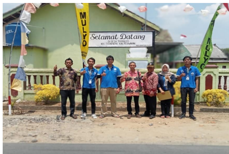
Gambar 2.6 Pemasangan Plang Selamat Datang

Membuat plang selamat datang di Desa Trimulyo, yang dipasang di balai desa, desa Trimulyo. Pembuatan plang ini dilakukan sebagai bentuk peninggalan mahasiswa PKPM yang melaksanakan kegiatan PKPM di Desa Trimulyo, selain cindremata berupa plakat.