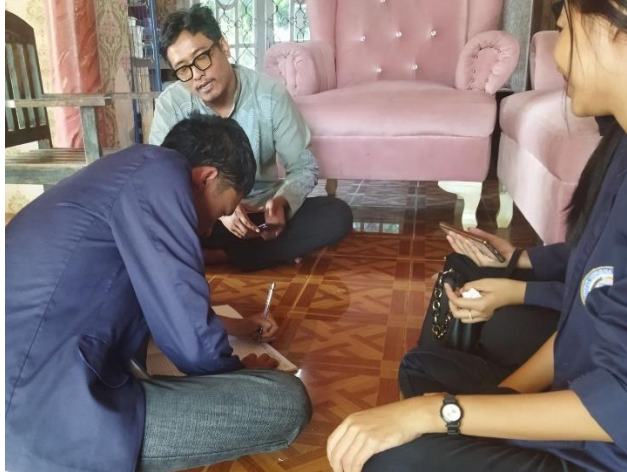
Gambar 2.3 Pelatihan Buku Kas