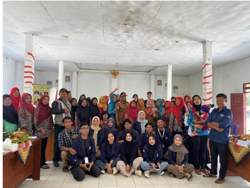
Lomba Tumpeng Antar Dusun Dalam Acara HUT RI ke-78