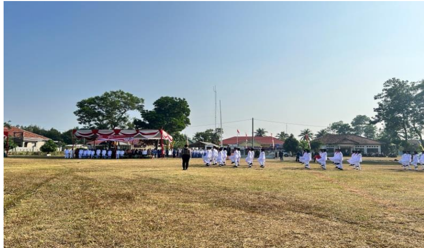
Upacara Memperingati HUT RI Di Lapangan Kecamatan Tegineneng