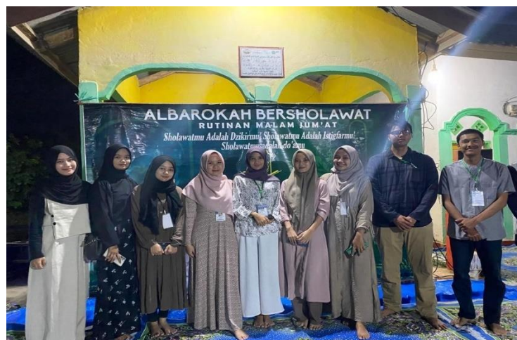
Acara Pengajian Rutin Setiap Malam Jum'at