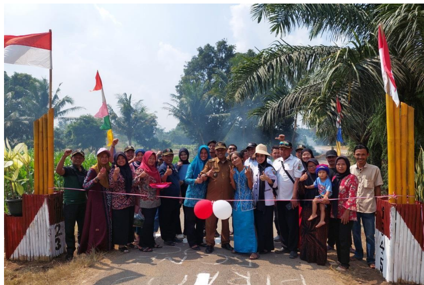
Perlombaan Kebersihan Antar Dusun di Desa Trimulyo