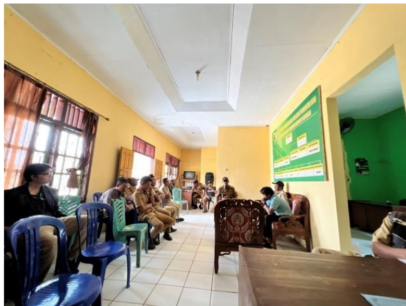
Rapat Bersama Aparatur Desa