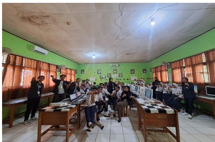
Sosialisasi Pelatihan Komputer di SMP Negeri 15 Pesawaran