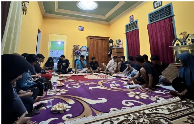
Rapat Bersama Karang Taruna