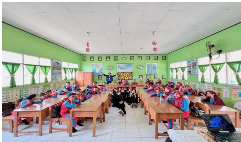
Sosialisasi Stop Bullying Sejak Dini Di SDN 10 Tegineneng