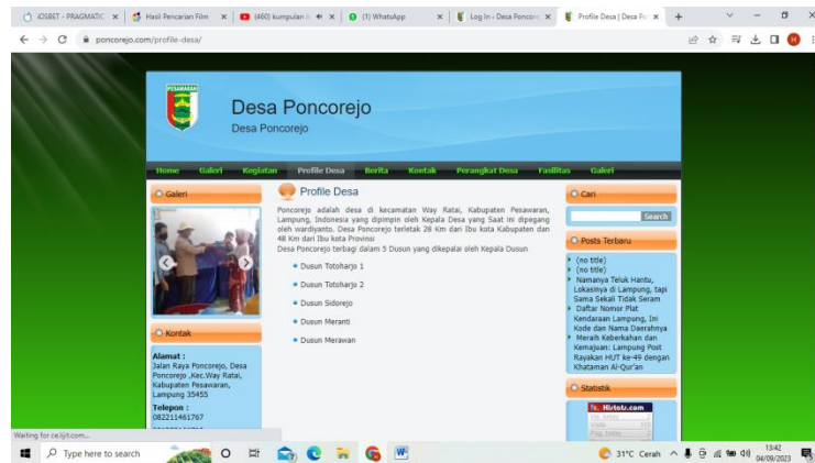
Gambar 2.6 Halaman Profil Desa

Halaman Profil Desa berisikan tentang Profil Desa Poncorejo.