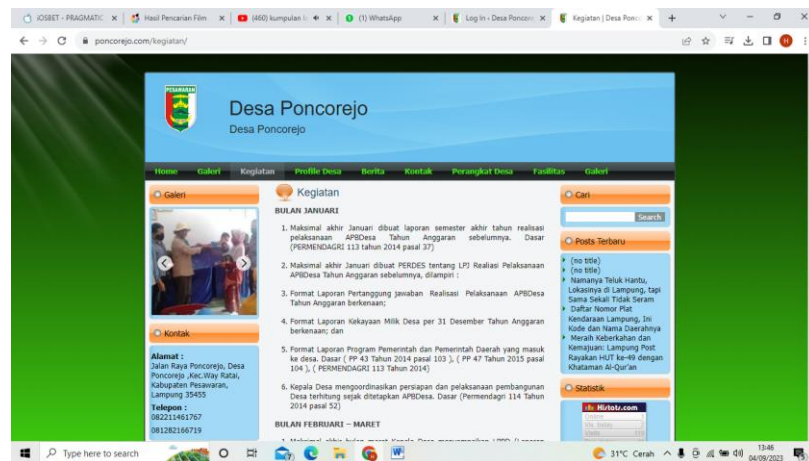
Gambar 2.7 Halaman kegiatan

Halaman kegiatan merupakan halaman yang di penuh dengan informasi kegiatan yang ada di Desa Poncorejo.