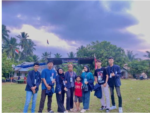
Gambar 2.2 Partisipasi Tournamen Sepak Bola