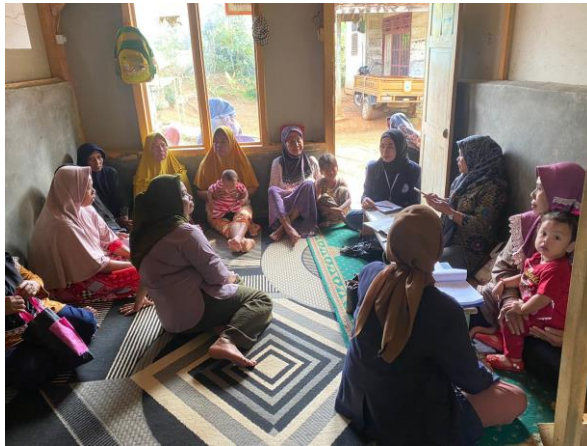
Gambar 2.11 Posyandu Balita