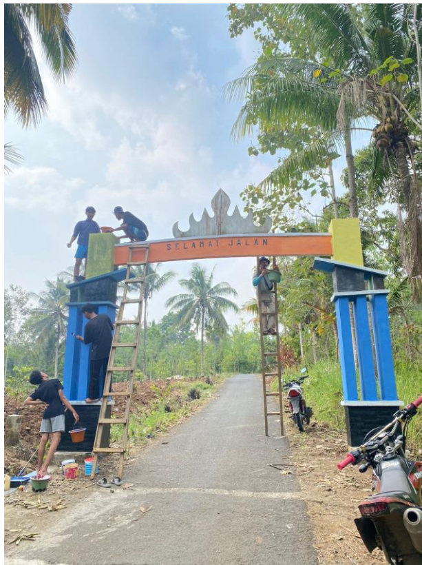
Gambar 2.12 Pengecatan Gapura

Melakukan pengecatan di setiap Tugu Selamat Datang di Desa Poncorejo dan pengecatan Tugu Belimbing yang digunakan sebagai tugu Ikon Desa.