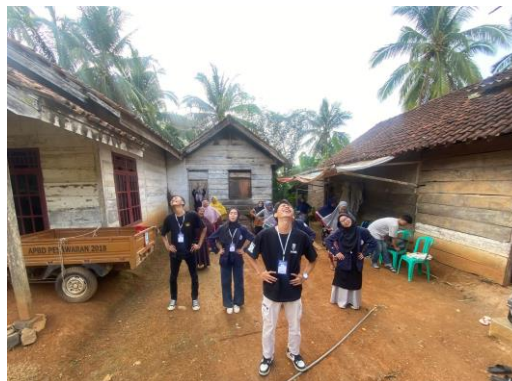
Gambar 2.10 Senam Lansia Dengan Para Ibu Lansia

Mengikuti kegiatan Posyandu rutin yang diadakan setiap hari Rabu dan Sabtu. Posyandu tidak hanya untuk Balita saja melainkan juga untuk para Lansia.