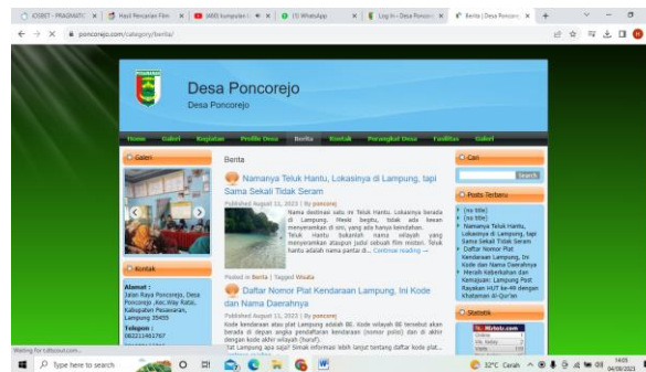
Gambar 2.9 Halaman Berita

Halaman berita berisikan tentang seluruh berita yang terkait dengan desa.