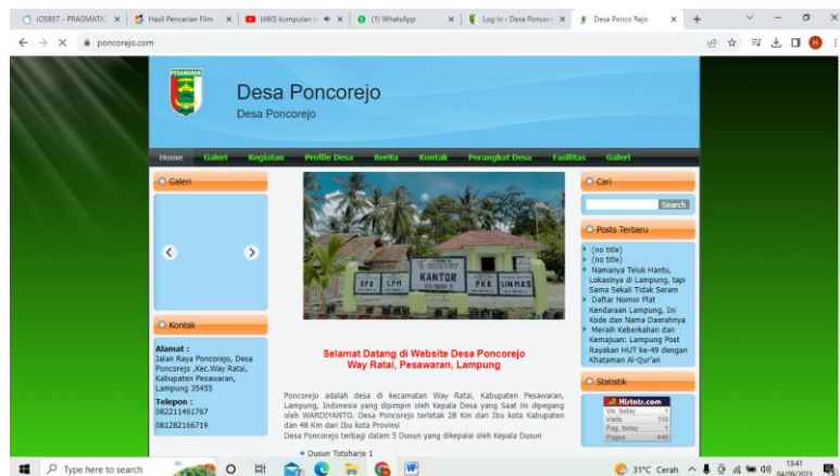
Gambar 2.5 Halaman menu utama

Halaman Menu Utama atau halaman awal pada Website, halaman yang pertama kali muncul ketika pengunjung mengakses web tersebut.