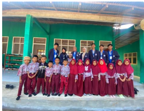
Gambar 2.3 Sosialisai MI AN-NIDA

Sosialisasi Sekaligus menjadi guru pengganti di MI AN-NIDA Desa Poncorejo.