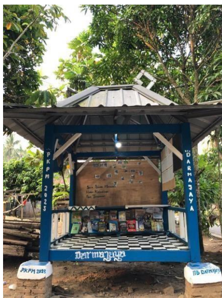
Gambar 2.19 Taman Baca

Kegiatan pengecatan gardu dan keberadaan Taman Baca ini diharapkan menjadi sarana atau media edukasi bagi anak-anak maupun orang tua dalam mengembangkan diri. Dan sebagai bentuk apresiasi untuk Desa dan kenang-kenangan dari Mahasiswa PKPM.