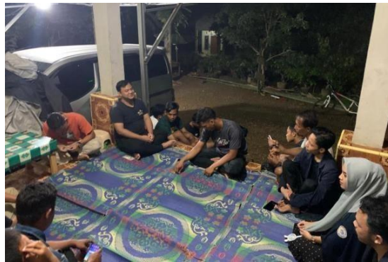
Gambar 2.11 Rapat HUT RI

Kegiatan ini memperingati hari Pramuka ke-62 dilapangan kecamatan Padang Cermin yang dihadiri oleh seluruh Mahasiswa PKPM dan KKN sekecamatan Padang Cermin.