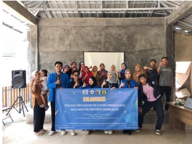
Gambar 2.17 Kegiatan kolaborasi sosialisasi bersama kkn melayu serumpun Kegiatan ini dilakukan untuk mengedukasi warga dengan ilmu pengetahuan dan teknologi guna memajukan kesejahteraan warga desa Trimulyo.