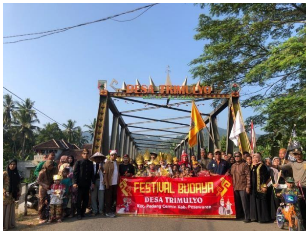
Gambar 2.16 Festival Budaya Nusantara

Kegiatan lomba Tanaman Obat Keluarga (TOGA) ini diselenggarakan dengan tujuan guna memanfaatkan lahan dilingkungan perkarangan rumah dengan membuat taman tanaman obat-obatan bagi keluarga. Kegiatan tersebut merupakan hal yang positif dan perlu dikembangkan oleh para ibu dan keluarga di Desa Trimulyo.