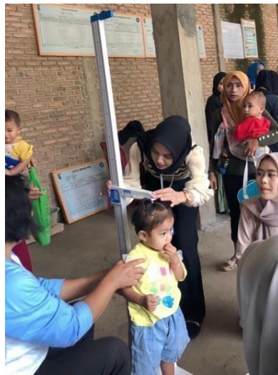
Gambar 2.7 Mengikuti posyandu

Meminta izin ke kepala desa untuk melakukan kegiatan di Desa Trimulyo. Kegiatan ini sekaligus rangkaian awal kegiatan kami pada PKPM Darmajaya periode 2 Agustus – 31 Agustus 2023.