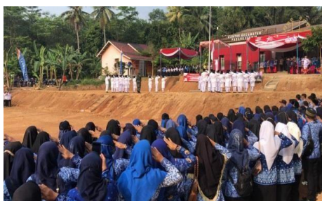
Gambar 2.12 Upacara HUT RI ke-78

Kegiatan Diskusi dengan pemuda karang taruna yaitu perkenalan kami Mahasiswa/I PKPM yang akan membantu menjadi panitia acara Hut RI Ke78 di Desa Trimulyo.