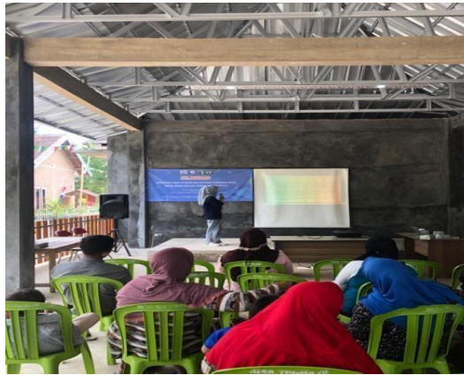
Gambar 2.5 Sosialisasi Aplikasi Keuangan Digital

Kegiatan ini bertujuan untuk meningkatkan kesejahteraan pelaku UMKM secara berkesinambungan. Melalui layanan-layanan Transaksi Digital. Dengan memperkenalkan Aplikasi Stroberi Kasir yang merupakan aplikasi Point Of Sales (POS) atau aplikasi manajemen kasir yang bermanfaat bagi Usaha Mandiri yaitu mampu mengembangkan bisnis. Aplikasi ini juga berfungsi mencatat transaksi, pengelolaan persediaan dan mendukung tata kelola dan administrasi usaha. Dengan diperkenalkannya aplikasi Stroberi Kasir mempermudah UMKM mencatat transaksi, pengeluaran, serta pemasukan sehingga lebih praktis dan efisien tanpa perlu kertas ataupun alat tulis.