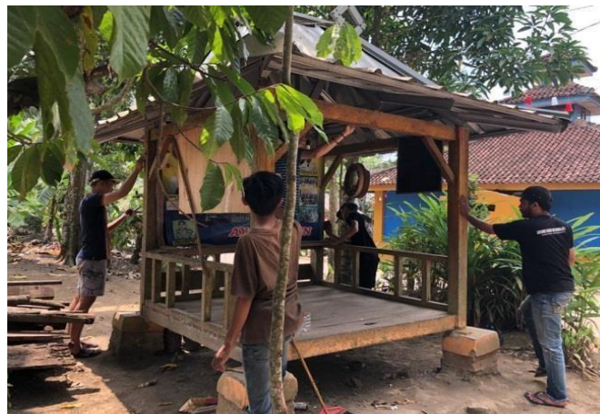
Gambar 2.18 Pengecetan Gardu