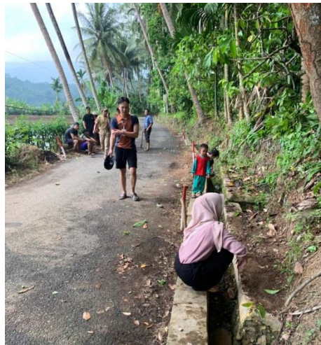
Gambar 2.14 Gotong Royong selokan

Turut serta menjadi panitia 17 Agustus di Desa Trimulyo. Mahasiswa PKPM ikut serta dalam pemberian ide lomba dan mengikuti perlombaan yang ada.