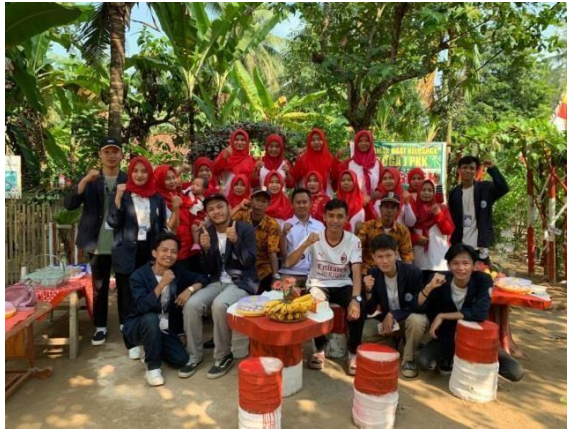
Gambar 2.15 Mengikuti Lomba penilaian Toga

Kegiatan lomba Tanaman Obat Keluarga (TOGA) ini diselenggarakan dengan tujuan guna memanfaatkan lahan dilingkungan perkarangan rumah dengan membuat taman tanaman obat-obatan bagi keluarga. Kegiatan tersebut merupakan hal yang positif dan perlu dikembangkan oleh para ibu dan keluarga di Desa Trimulyo.