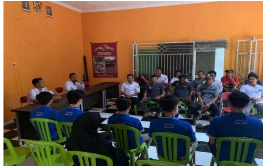
Gambar 2.6 Meminta Izin Kades untuk melakukan giat di Desa

Meminta izin ke kepala desa untuk melakukan kegiatan di Desa Trimulyo. Kegiatan ini sekaligus rangkaian awal kegiatan kami pada PKPM Darmajaya periode 2 Agustus – 31 Agustus 2023.