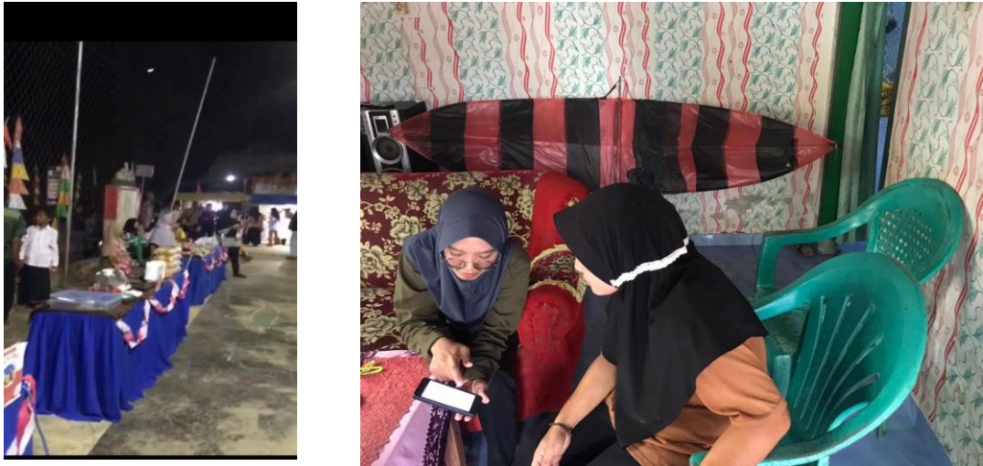
Gambar 1.4 Bazar Malam Puncak dan Pengelolaan pemasaran secara online