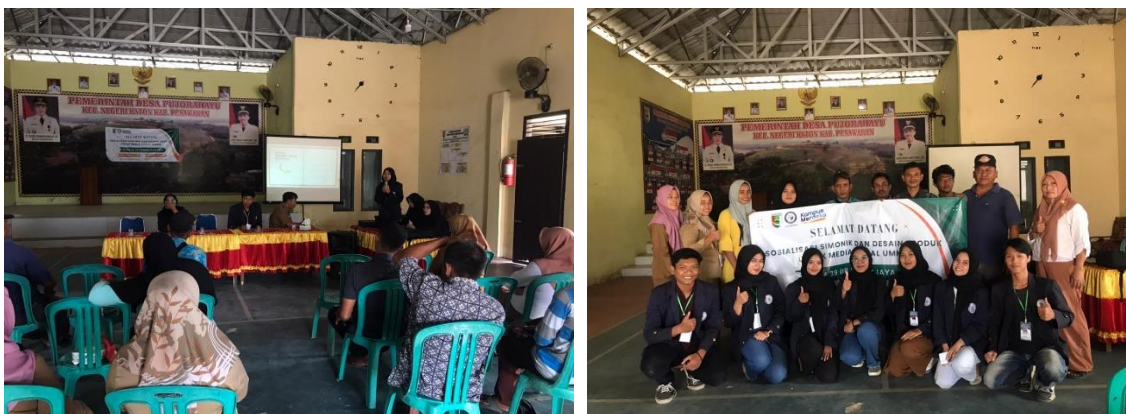
Gambar 1.6 Sosialisasi dan Pelatihan SiMonik dan Desain produk untuk media sosial

SiMonik merupakan system monitoring dan evaluasi pelayanan Publik adalah wadah bagi pelaku usaha mikro kecil dan menengah untuk memperkenalkan produk-produk yang mereka ciptakan dengan inovasi-inovasi baru yang membangkitkan semangat bagi pelaku usaha untuk terus berkembang dan maju. SiMonik sama halnya dengan E-commerce pada umumnya, namun saat ini walaupun era perkembangan zaman semakin meningkat banyak juga yang mengangkrakannya, dengan begitu upaya terus untuk membantu memajukan UMKM yang ada kita dapat memaksimalkan SiMonik dalam meningkatkan proses penjualan maupun promosi produk. Sehingga ini dapat dijadikan sebagai salah satu bentuk strategi pemasaran UMKM yang ada di Pesawaran terkhusus UMKM yang ada di Desa Pujorahayu Memberikan tempat bagi pemilik UMKM agar mudah menjul dan mempromosikan produk-produk yang dimiliki ke jaringan yang lebih luas.