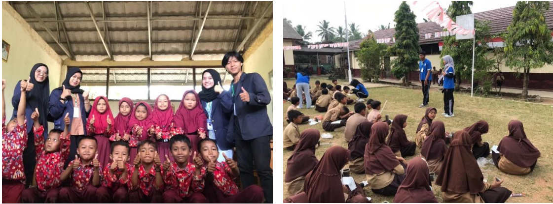
Gambar 1.3 Sosialisasi menabung dan Outing class SD N 06 Negeri Katon

Mengajarkan kepada anak sekolah mengenai literasi, numerasi, observasi, dan presentasi melalui praktik penanaman biji kacang hijau dengan 2 media (Tissue dan tanah).