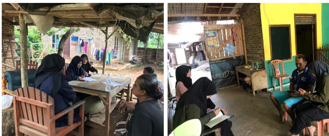
Gambar 1.2 Survei UMKM yang ada di Desa Pujorahayu

Mensurvei tempat UMKM yang dilaksanakan oleh PKPM Darmajaya. Tujuan mengadakan survei ini adalah untuk penyusunan masalah pelaku usaha UMKM yang menjadi kendala yang di hadapi oleh para pemilik usaha mikro kecil dan menengah yang ada di Desa Pujorahayu.