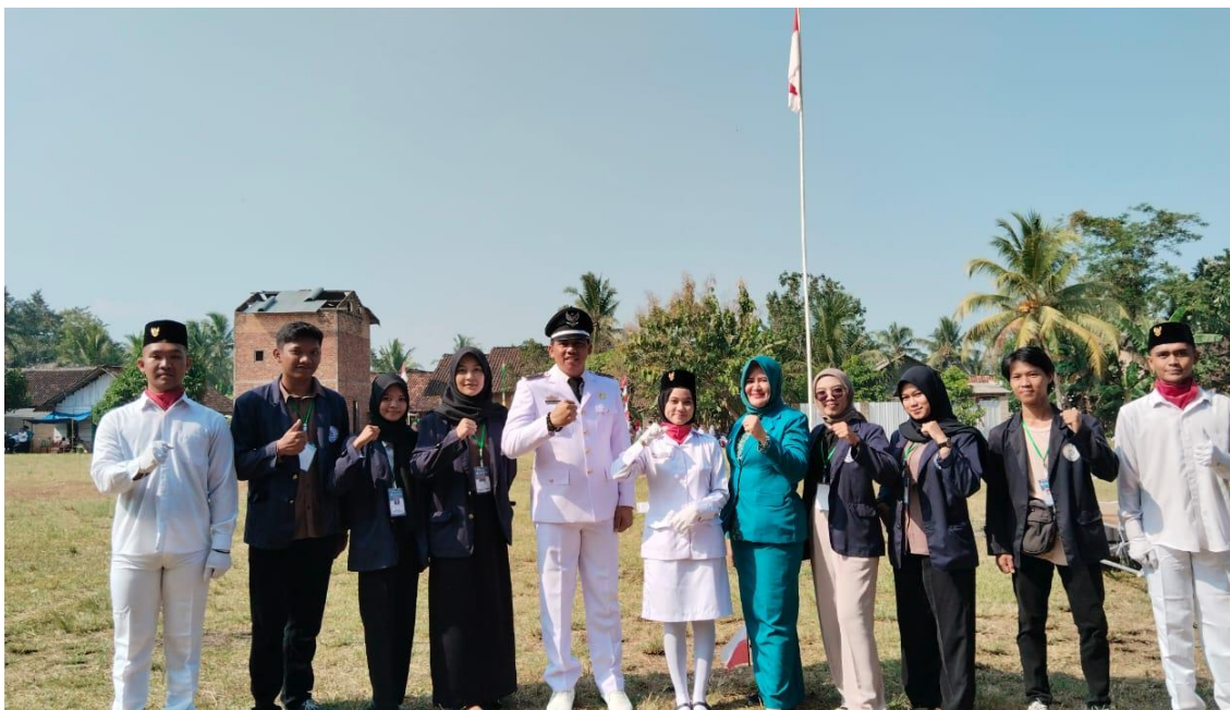
Gambar 1.5 Foto bersama dengan Kepala Desa Pujorahayu dan pengibar bendera

Memperingati hari sakral nya Indonesia, mengadakan upacara di lapangan Desa Pujorahayu sebagai peringatan detik -detik proklamasi kemerdekaan Indonesia dengan pengibaran sang saka merah putih serta lomba-lomba yang di adakan oleh Desa. Upacara ini sebagai pengingat kepada masyarakat dan generasi baru akan perjuangan para pahlawan yang telah gugur.