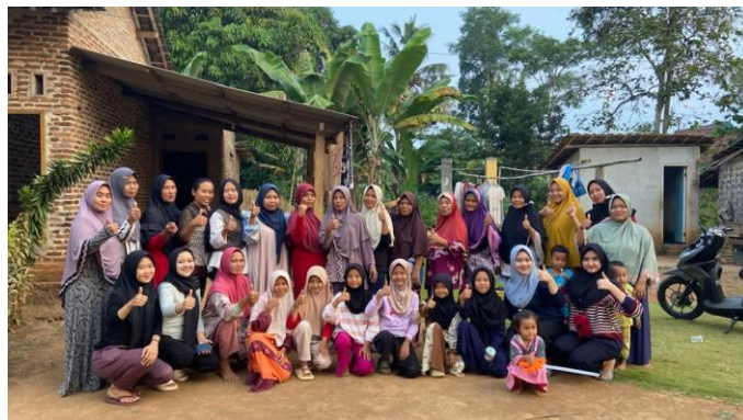
Gambar 2.21 Kegiatan Senam Bersama

Selain kegiatan rutin jumat berkah, terutama di Dusun Kamulyan terdapat kegiatan senam bersama ibu-ibu dan anak-anak yang dilakukan setiap sore yang bertempat di rumah Bapak RT setempat. Kegiatan ini bertujuan untuk mempererat rasa kebersamaan antar tetangga sekaligus latihan untuk perlombaan senam di tingkat Desa Kalirejo.