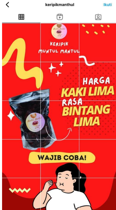
Gambar 2.11 Instagram UMKM