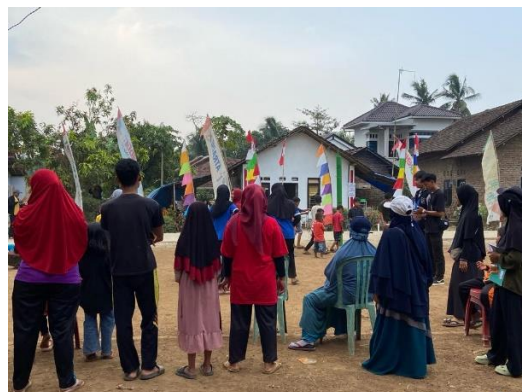
Gambar 2.19 Kegiatan Perlombaan Di Dusun