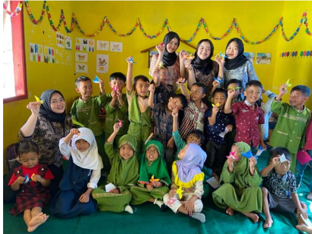
Gambar 2.15 Kegiatan Belajar Bersama Paud Ar-Rahman