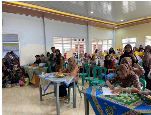
Gambar 2.18 Kegiatan Perlombaan Di Desa

Selain peringatan 17 Agustus di rayakan di tingkat Desa Kalirejo, seluruh dusun yang ada di desa juga ikut merayakannya masing-masing. Khususnya di Dusun Kamulyan tempat kami tinggal. Banyak sekali perlombaan yang diadakan mulai dari senam, paduan suara, adzan, tahfidz dan lainnya. Perwakilan dari kami juga berkesempatan untuk mewakili cabang perlombaan untuk menjadi juri.