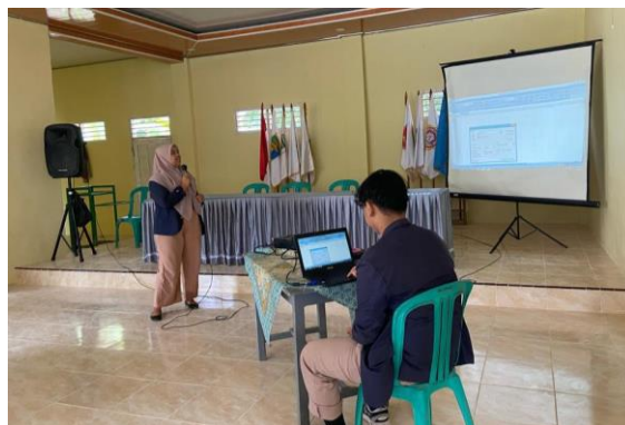
Gambar 2.13 Kegiatan Pelatihan Pengaplikasian Microsoft Excel

Dalam rangka meningkatkan pengetahuan masyarakat di bidang ekonomi dan teknologi. Salah satu pelatihan yang dibuat yaitu Pengaplikasian Microsoft Excel. Pelatihan ini untuk meningkatkan pengetahuan masyarakat di bidang teknologi dan dilakukan dengan cara praktik agar masyarakat dapat langsung mengerti. Pelatihan dilakukan di Balai Desa Kalirejo yang dihadiri oleh aparaturnya dan masyarakat setempat.