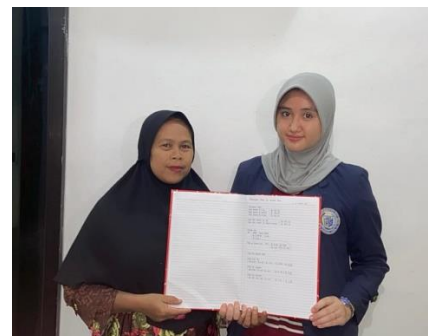
Gambar 2.5 Kegiatan Pembukuan Kas Gambar 2.6 Kegiatan Perhitungan Harga