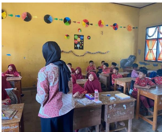
Gambar 2.16 Kegiatan Belajar Bersama SDN Kalirejo

Tidak hanya belajar bersama di Paud. Belajar bersama juga dilakukan di SDN Kalirejo dengan mendapatkan kesempatan untuk mengajar di kelas satu dan kelas lima. Di kelas dua kami mengikuti proses pembelajaran dan mengajar berhitung sederhana dan di kelas lima kami mengajar Bahasa Inggris yaitu cara perkenalan dan pengungkapan melalui surat. Serta di hari lainnya kami membuat kreativitas untuk menjadi kenang-kenangan SDN kalirejo dari PKPM IIB Darmajaya 2023 Kelompok 36 dengan meramaikan menulis cita-cita pada sticky note yang ditempel di sterofom.