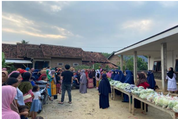
Gambar 2.20 Kegiatan Jumat Berkah

Desa Kalirejo memiliki kegiatan rutin yaitu Jumat Berkah yang diadakan setiap minggu pada jumat sore. Kegiatan ini setiap minggunya berpindah tempat dari dusun yang satu hingga dusun lainnya atau berjumlah tujuh dusun yang ada di Desa Kalirejo secara bergantian. Jumat berkah ini dilakukan dengan membagikan sayuran dan bahan baku makanan secara gratis dan merata.