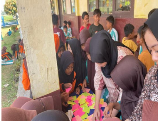
Gambar 2.17 Kegiatan Membuat Kreativitas Bersama SDN Kalirejo