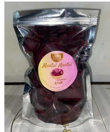
Gambar 2.8 Kemasan