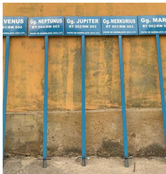
Gambar 2.23 Kenang-Kenangan Plang Gang

Plang gang ini dipersembahkan untuk Dusun Kamulyan, dimana tempat kami tinggal. Dusun ini memberikan kesan yang sangat baik sehingga juga kegiatan PKPM kelompok 37 dapat terlaksana semua tanpa suatu kendala apapun.