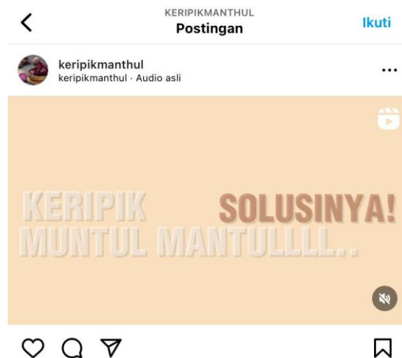
Gambar 2.10 Iklan Produk di Instagram

Di era digital saat ini, perkembangan teknologi sangat berpengaruh pada seluruh kegiatan. Salah satunya yaitu pemasaran. Oleh karena itu pemasaran produk yang efektif untuk dilakukan yaitu dengan memanfaatkan sosial media . Pemasaran yang kami buat yaitu dengan content marketing dalam bentuk iklan yang ditayangkan di aplikasi instagram @keripikmanthul.