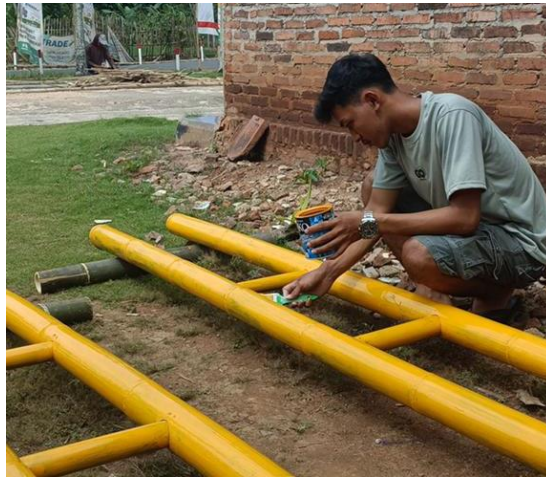
Gambar 2.22 Kegiatan Gotong Royong Membuat Gapura

Kegiatan gotong royong ini biasanya dilakukan di hari libur, sabtu atau minggu meliputi membersihkan balai desa, jalanan di dusun serta balai dusun.