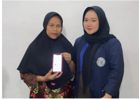
Gambar 2.4 Kegiatan Pendaftaran pada Web SiMonik