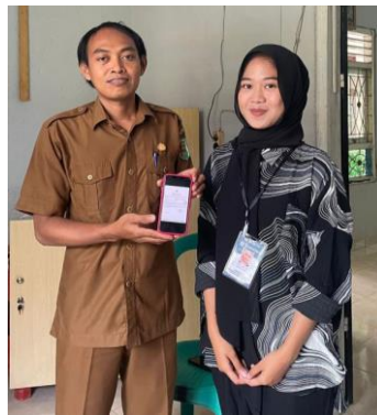
Gambar 2.3 Kegiatan Pembuatan Surat izin Usaha UMKM Perikanan