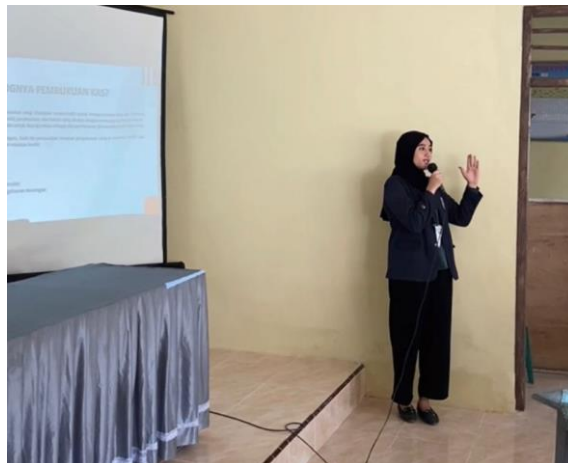
Gambar 2.14 Kegiatan Pelatihan Mengoptimalkan Pembukuan Kas dan laporan Keuangan

Pelatihan ini untuk mendukung peningkatan pengetahuan masyarakat di bidang ekonomi. Telah diketahui bahwa keuangan adalah faktor terpenting dalam mengoptimalkan laba dalam usaha serta menstabilkan pemasukkan dan pengeluaran agar terus seimbang ( Balance ). Pelatihan dilakukan di Balai Desa Kalirejo, dihadiri oleh aparaturnya desa dan masyarakat. Pelatihan ini diadakan salah satunya karena ada permintaan dari aparaturnya desa agar seluruh masyarakat yang berkepentingan dapat mengetahui pembukuan kas yang benar serta memahami kegunaan pembuatan laporan keuangan dalam berusaha untuk memaksimalkan ekonomi.