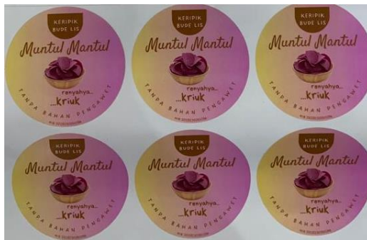
Gambar 2.7 Merk, Logo dan Stiker

Selain keuangan, faktor lainnya adalah kemasan. Kemasan sebagai daya Tarik dan ketahanan produk. Sebelumnya UMKM ini belum memiliki nama brand tersendiri, kemasan, stiker produk. Kemasan, banner, logo dan stiker di desain sesuai dengan produk yang ingin di branding yaitu Ubi Ungu.