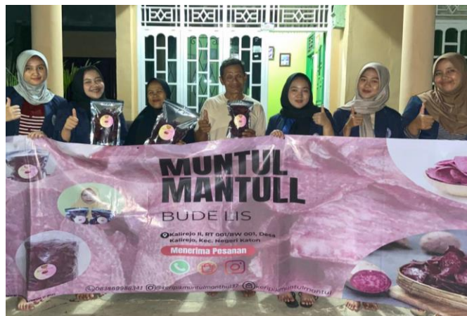
Gambar 2.9 Banner UMKM Keripik Muntul Mantul Bude Lis