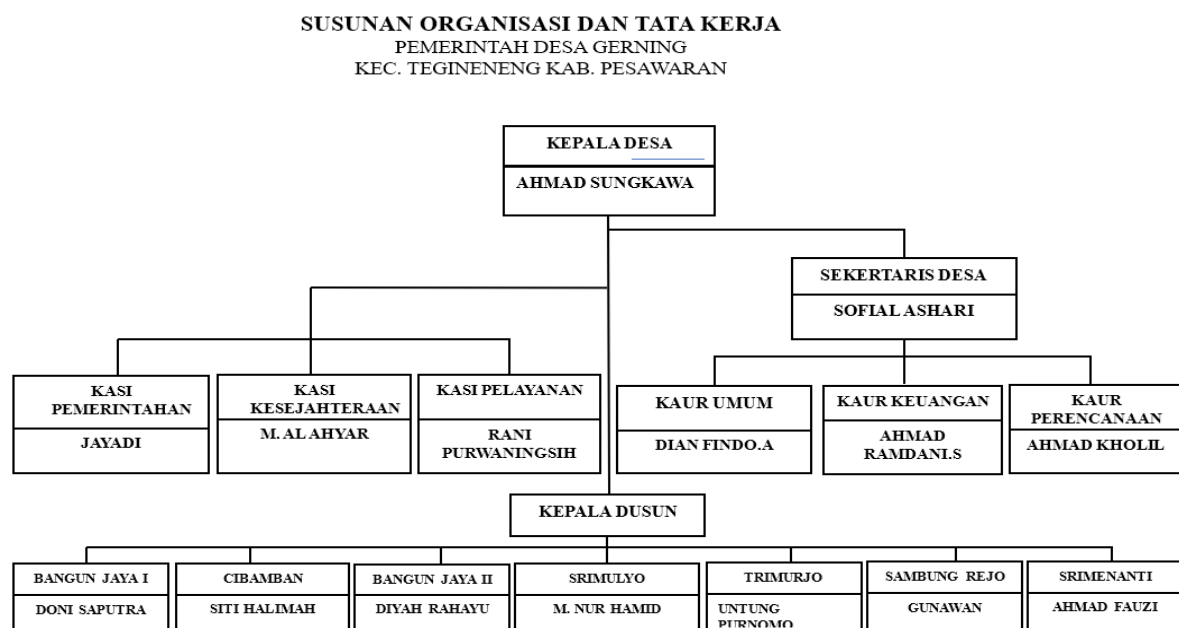
Gambar 1. 2 Susunan Organisasi dan Tata Kerja Pemerintah Desa Gerning

Untuk pelaku UMKM yang berkembang di desa Gerning masih sedikit. Untuk fasilitas yang ada di desa terdapat 8 masjid, 12 mushola, 1 balai desa, 1 fasilitas kesehatan, sekolah (TK, SD, SMP, SMA), dan fasilitas lainnya. Sedangkan untuk usaha yang dilakukan masyarakat di desa Gerning yaitu banyak membuka warung seperti warung sembako. Jika di lihat lagi maka masyarakat sangat membutuhkan pengetahuan mengenai UMKM dan pengarahan yang lebih baik agar pendapatan dan kreatifitas masyarakat meningkat.