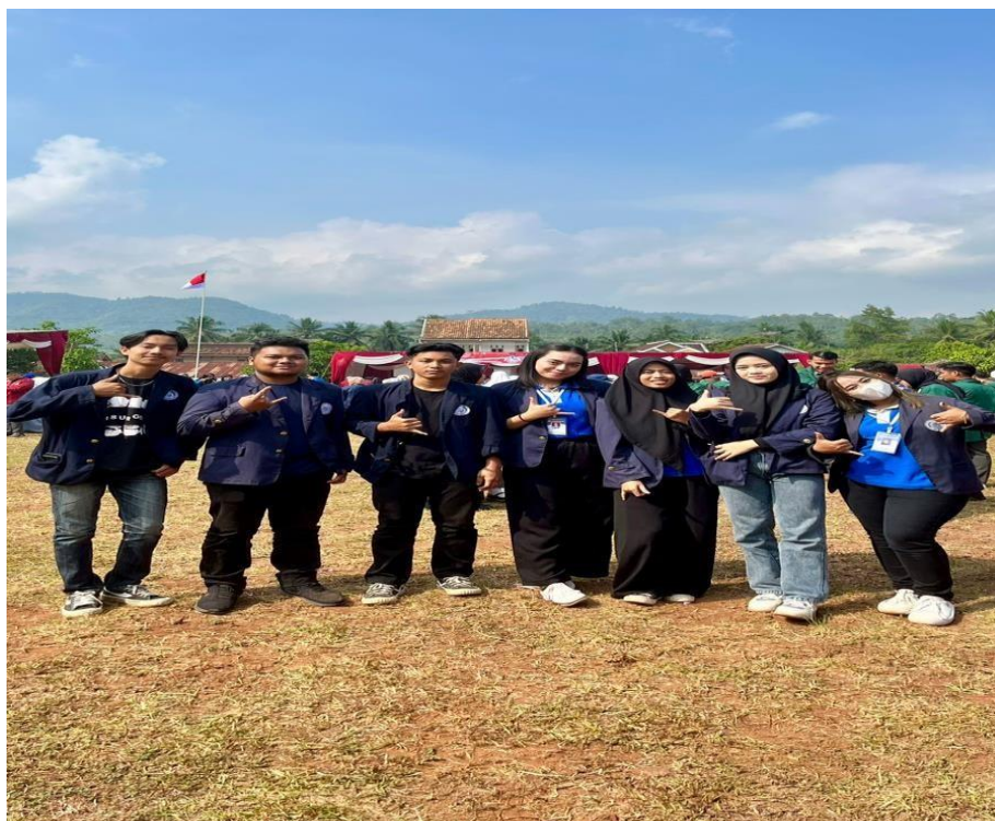
Gambar 3. Memperingati HUT RI ke 78