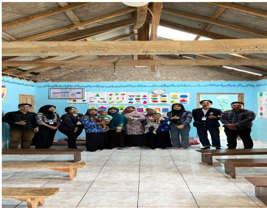
Gambar 6. Kunjungan ke Paud Nurul Falah