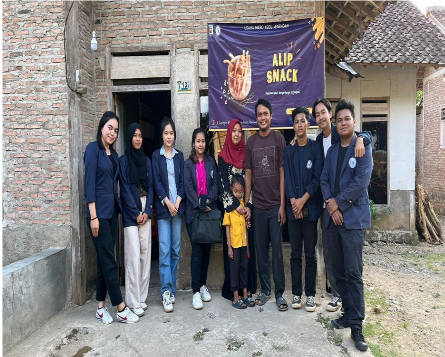
Gambar 7. Kunjungan ke UMKM Alip Snack