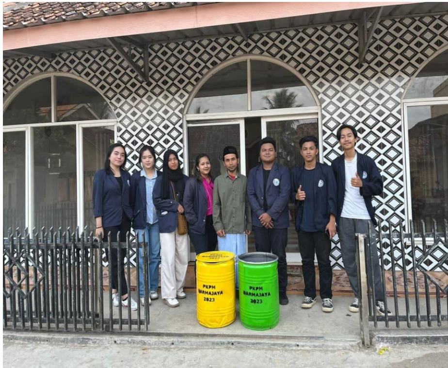
Gambar 11. Pemberian Tong Sampah di Msjid Desa Ceringin Asri