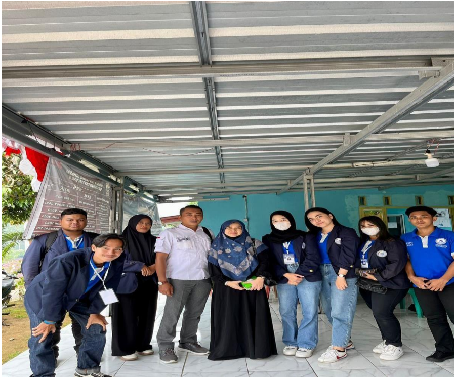
Gambar 1. Pendampingan DPL di Kecamatan