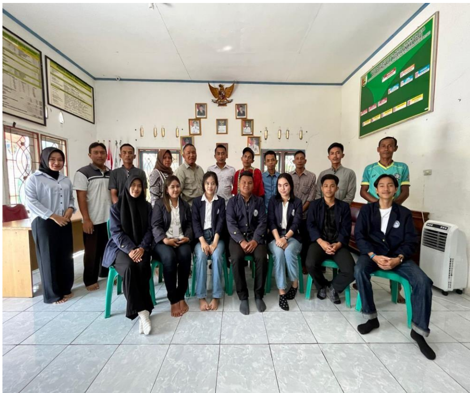
Gambar 14. Perpisahan Bersama Warga Desa Ceringin Asri