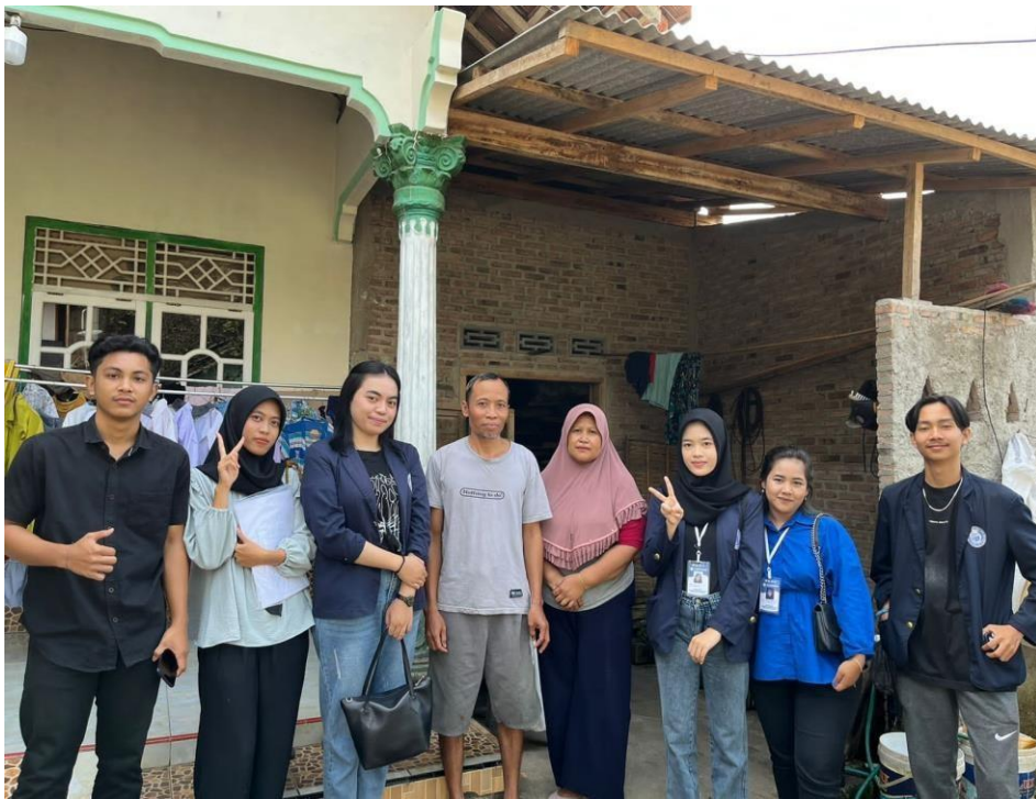
Gambar 10 . Kunjungan ke UMKM Oncom