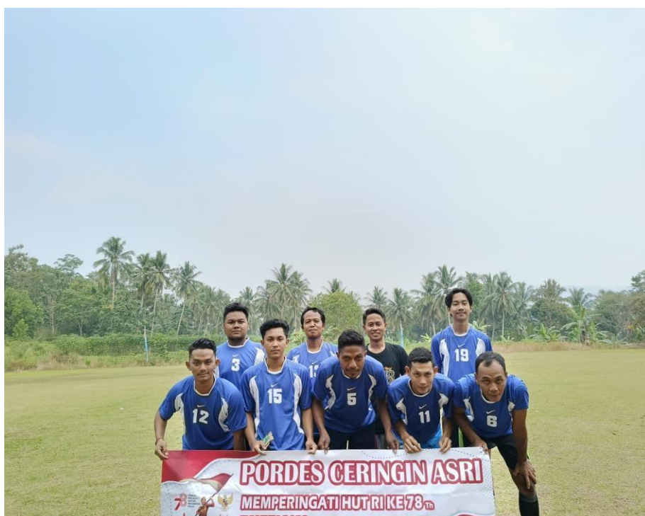
Gambar 4. Mengikuti PORDES di Desa Ceringin Asri