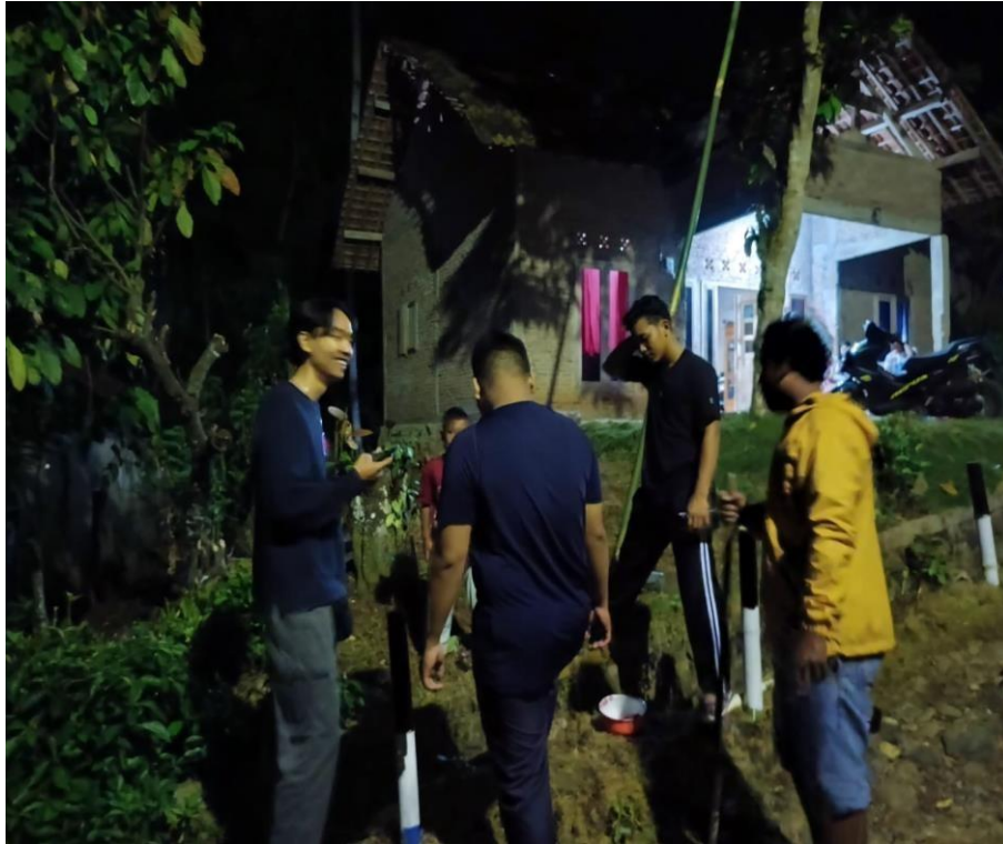
Gambar 5. Gotong Royong Bersama Warga Ceringin Asri