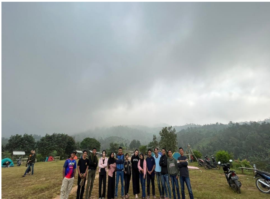
Gambar 12. Ngecamp Bareng Pemuda Ceringin Asri