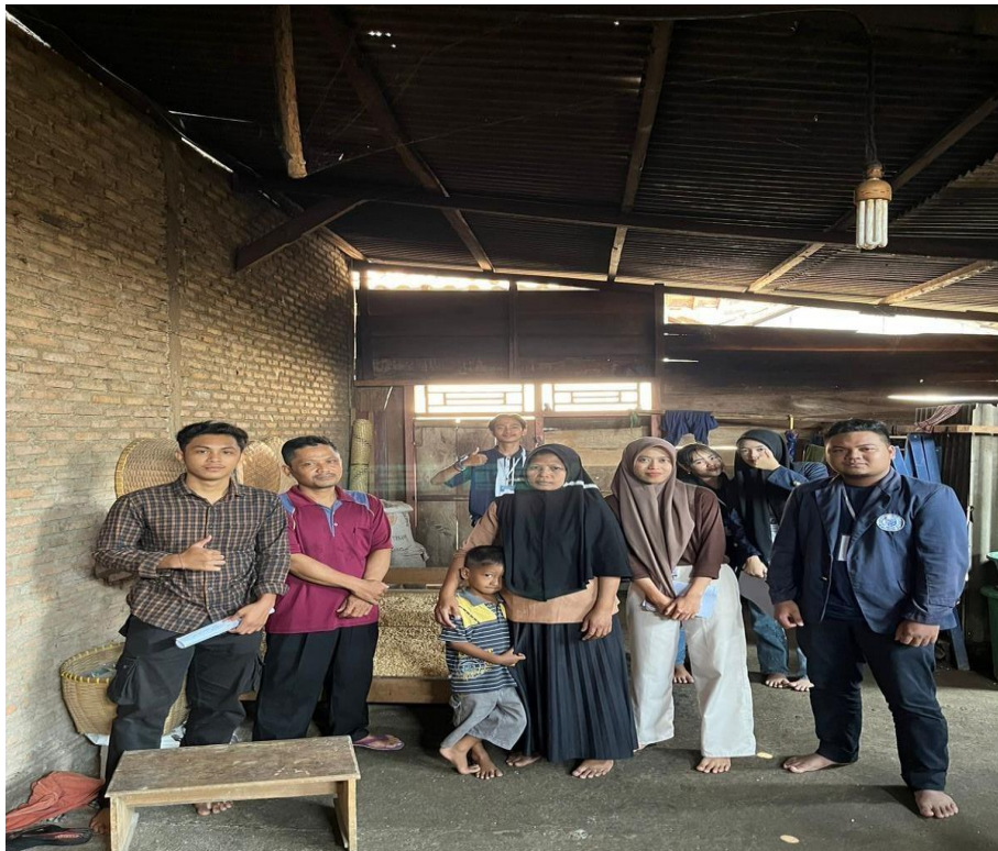
Gambar 8 . Kunjungan ke UMKM Tempe