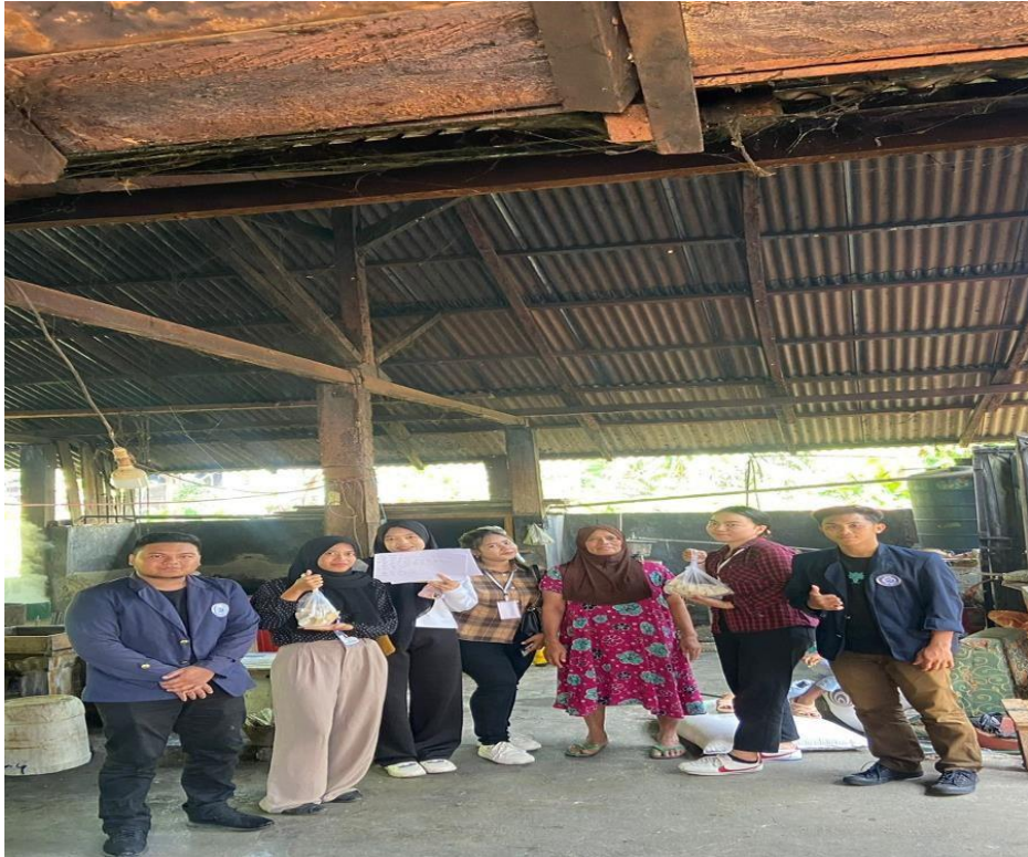
Gambar 9. Kunjungan ke UMKM Tahu