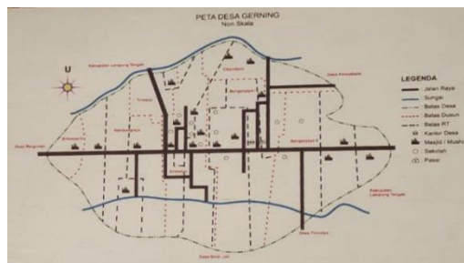
Gambar 1. 1 Peta Lokasi PKPM

Tujuan diadakannya PKPM IIB DARMAJAYA adalah untuk membantu meningkatkan ekonomi menuju masyarakat yang unggul dan tangguh. Dalam pelaksanaannya, Desa Gerning merupakan salah satu desa yang menjadi wilayah Praktik Kerja Pengabdian Masyarakat IIB DARMAJAYA yang berada di Kecamatan Tegineneng Kabupaten Pesawaran dengan luas wilayah yakni 1.629,00 Ha. Desa ini juga terdiri dari berbagai suku diantaranya Sunda, Jawa, dan Ogan yang mayoritas mata pencaharian penduduknya adalah petani.