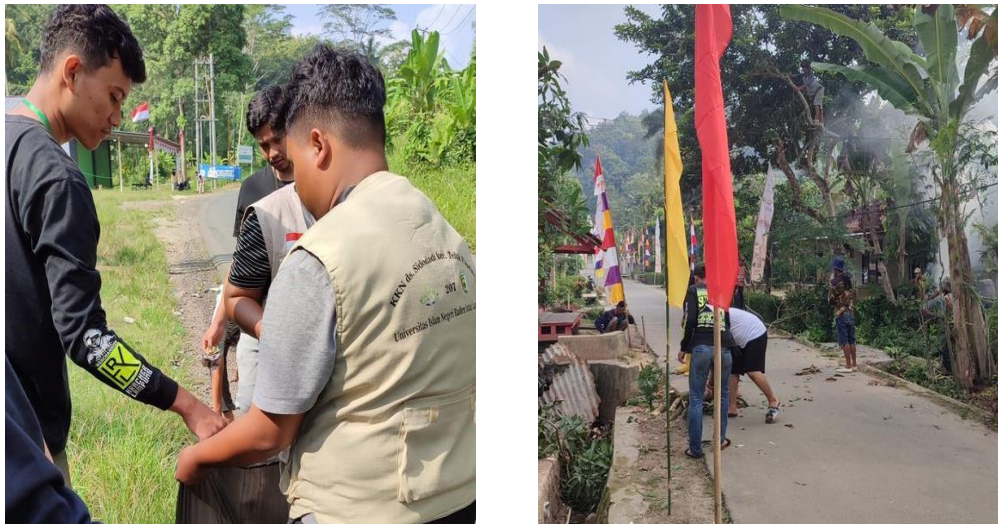
Gambar 3 Kegiatan Memperingati HUT RI ke - 78