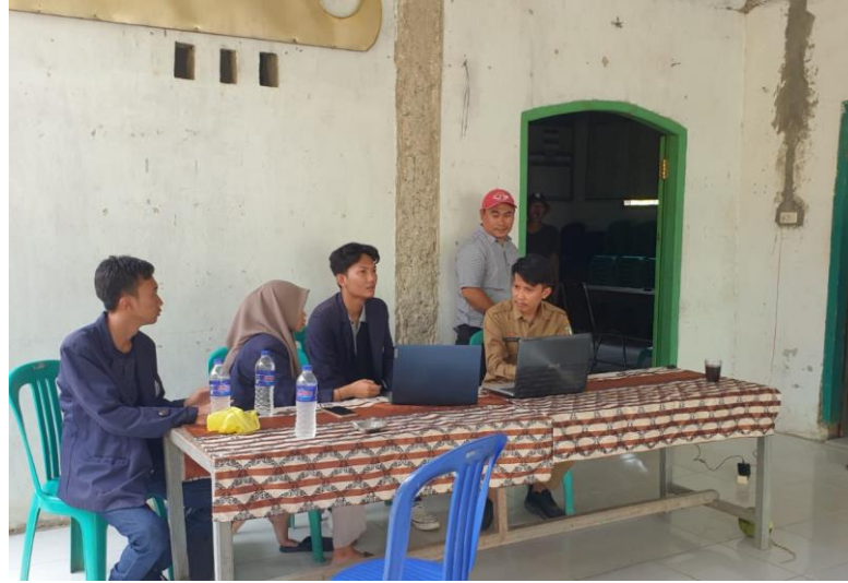
Gambar 2.2 Membantu Aparatur Desa Mengarsipkan Dokumen