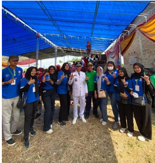
Gambar 2.16 Mengikuti Kegiatan Acara Jalan Sehat