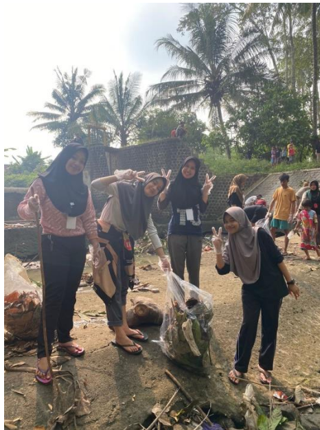
Gambar 2.13 Mengikuti Kegiatan Pembersihan Sampah Sungai