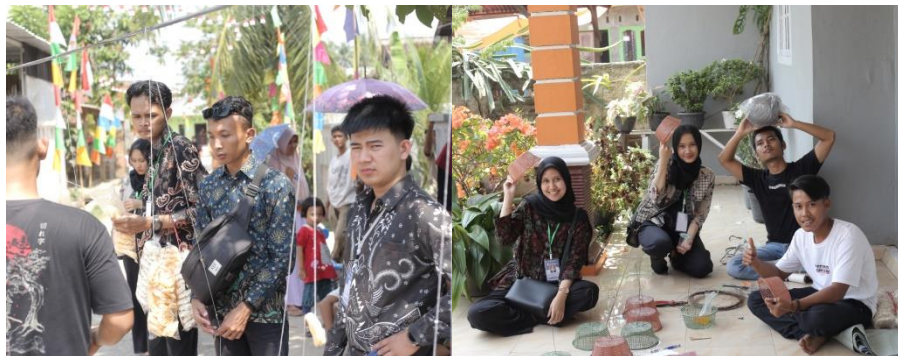
Gambar 2.17 Menjadi Panitia Perlombaan 17 Agustus