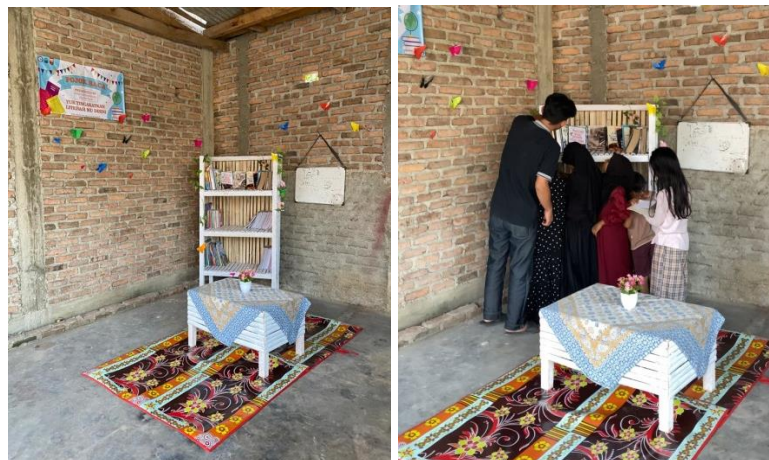
Gambar 2.10 Hasil Pembuatan Pojok Baca