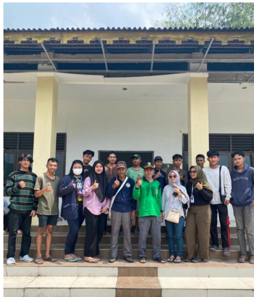
Gambar 2.15 Gotong Royong Membersihkan Balai Adat