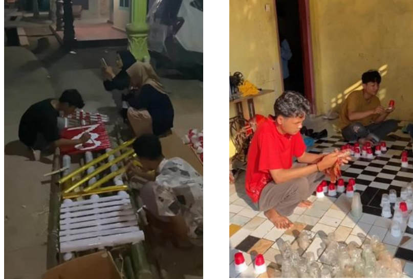
Gambar 2.12 Menghias Dusun dalam rangka HUT RI ke-78