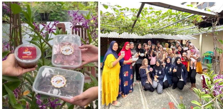
Gambar 2.8 Menciptakan Inovasi Bisnis Keripik Pisang Lumer

Kegiatan ini diikuti oleh ibu-ibu PKK Desa Kota Jawa berjumlah 15 orang dengan harapan dapat membuka sebuah bisnis baru bagi Ibu-ibu PKK Desa Kota Jawa dengan memanfaatkan sumber daya alam yang ada yaitu pisang yang diolah menjadi inovasi ide bisnis baru kekinian. Kegiatan ini dilaksanakan pada tanggal 26 Agustus 2023 dan proses pembuatan berlangsung selama 3 jam dengan hasil produk yang berhasil terselesaikan yaitu 10 sampel keripik pisang lumer.