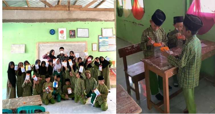
Gambar 2.7 Program Mengajar Menabung

yang dilaksanakan bersama siswa/i kelas 4 dengan jumlah 20 siswa. Kegiatan ini bertujuan untuk membiasakan kegiatan menabung sejak dini.