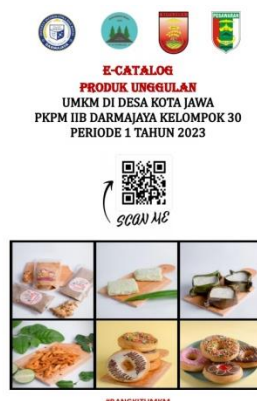
Gambar 2.11 Hasil Pembuatan E-catalog UMKM

Dengan adanya E-Catalog bertujuan untuk mempromosikan bisnis yang ada di Desa Kota Jawa. Sehingga memudahkan masyarakat umum, maupun masyarakat desa kota jawa melihat UMKM yang ada tanpa mengunjungi secara langsung.