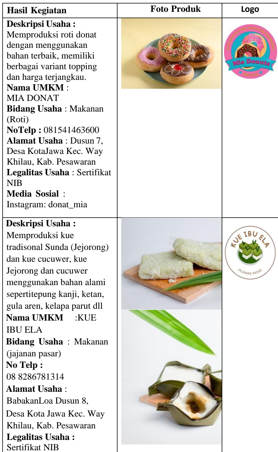
Tabel 2.5 Produk-produk UMKM yang terdapat pada E-Catalog