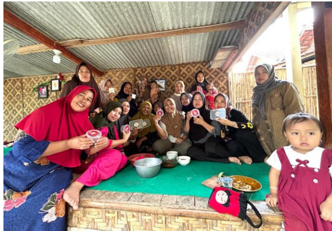
Gambar 2.9 Menciptakan Inovasi Bisnis Sambal Lele Bersama Ibu-ibu PKK