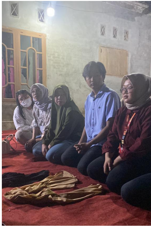
Gambar 2.14 Mengikuti Kegiatan Bertabuh dan Lempar Selendang