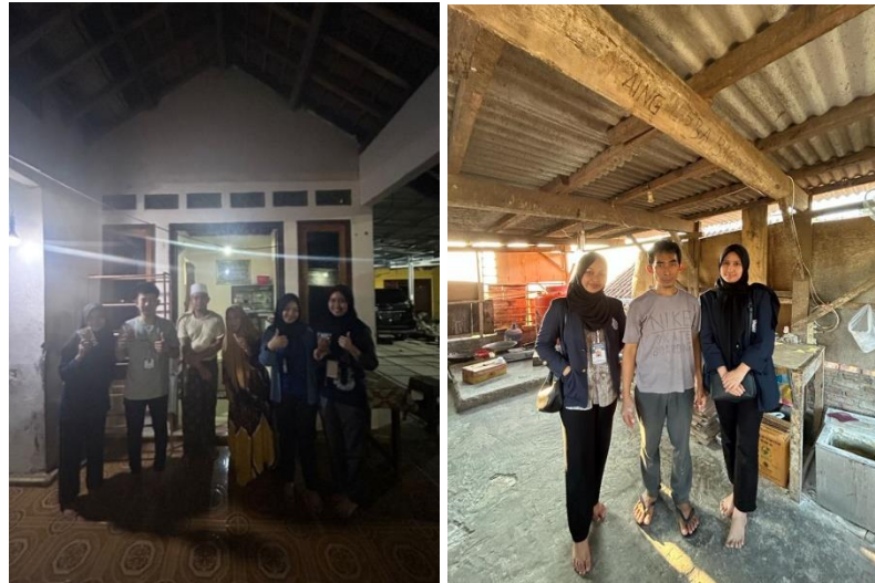
Gambar 2.5 Kegiatan Survei Mengunjungi UMKM