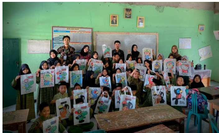
Gambar 2.6 Program Mengajar Kreativitas

Mengajar kreativitas bersama siswa/i MI Mathla'ul Anwar Babakan Loa dengan metode melukis di atas totebag Canvas yang bertujuan untuk menumbuhkan jiwa Entrepreneur dan kreatif sejak dini. Kegiatan ini dilaksanakan bersama siswa-siswi kelas 5 dikarenakan mereka aktif dalam melakukan suatu kegiatan sehingga kegiatan mengajar kreativitas terlaksana dengan hasil 35 karya Totebag Canvas yang berhasil diselesaikan.