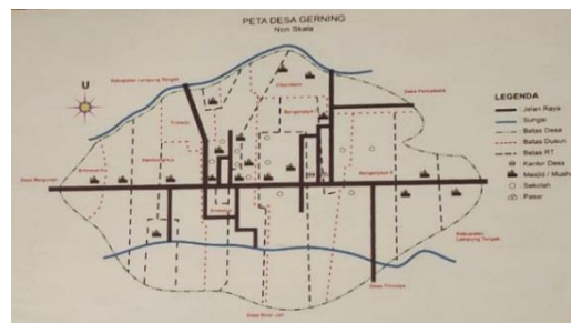
Gambar 1. 1 Peta Lokasi PKPM

Tujuan diadakannya PKPM IIB DARMAJAYA adalah untuk membantu meningkatkan ekonomi menuju masyarakat yang unggul dan tangguh. Dalam pelaksanaannya, Desa Gerning merupakan salah satu desa yang menjadi wilayah Praktik Kerja Pengabdian Masyarakat IIB DARMAJAYA yang berada di Kecamatan Tegineneng Kabupaten Pesawaran dengan luas wilayah yakni 1.629,00 Ha. Desa ini juga terdiri dari berbagai suku diantaranya Sunda, Jawa, dan Ogan yang mayoritas mata pencaharian penduduknya adalah petani.